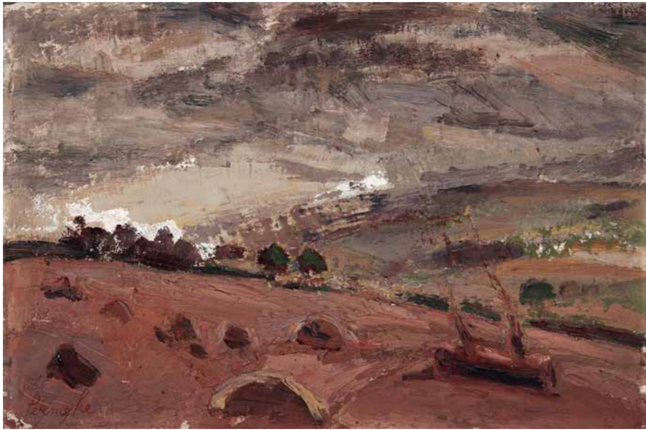
CAT. 21 Constant Permeke, Vue du Devon , 1917, huile sur triplex, 45,5 × 31 cm, collection privée