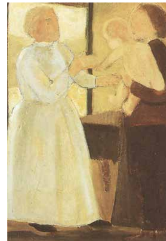
FIG. 33 Constant Permeke, Les trois générations , 1915, collection actuelle inconnue