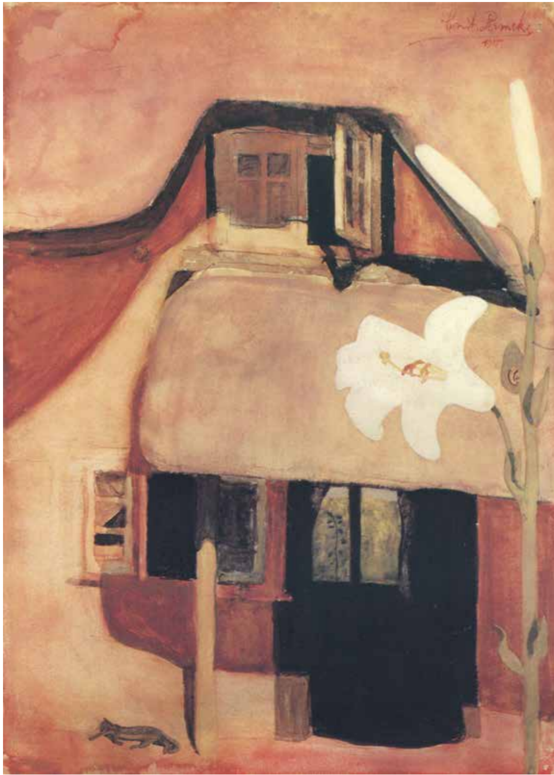
FIG. 36 Constant Permeke, [Stanton St. Bernard], 1915, aquarelle sur papier, collection actuelle inconnue