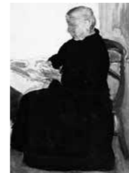
FIG. 27, p. 22

Constant Permeke ne donnait généralement pas de titre à ses œuvres, de sorte que les propriétaires, maisons de vente aux enchères, galeries et auteurs leur en ont attribué un par la suite. De ce fait, ces œuvres ont souvent reçu différents titres, ce qui rend leur identification difficile. Cette liste des œuvres de Permeke datant de sa période anglaise a été établie à partir de collections muséales, collections privées, publications, catalogues d'exposition et catalogues de ventes aux enchères. Pour chaque œuvre, nous avons conservé le titre original ou, s'il n'est pas connu, la plus ancienne mention attestée.