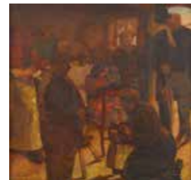
FIG. 49, p. 84

Signée et datée (1916) en bas à gauche Musée d'Ixelles