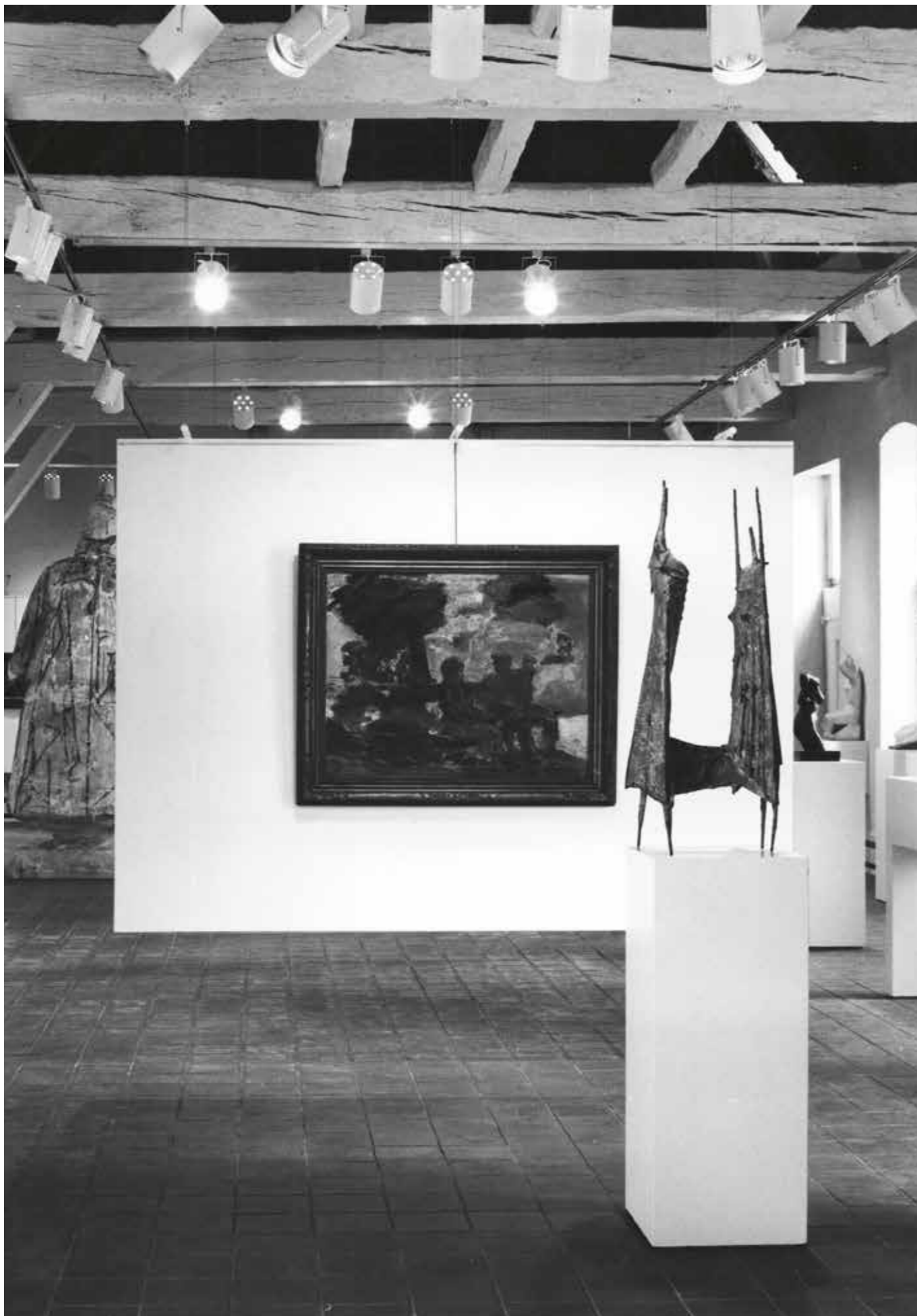
FIG. 52 Constant Permeke, Histoires vraies, avec au premier plan Dance IV (1955) de Lynn Chadwick, dans la Bouwhuis, annexe du château Het Nijenhuis, espace d'exposition inauguré le 23 juin 1969.