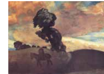
FIG. 37, p. 35

Signée en bas à gauche, titre au verso Galerie Oscar De Vos, Laethem-Saint-Martin