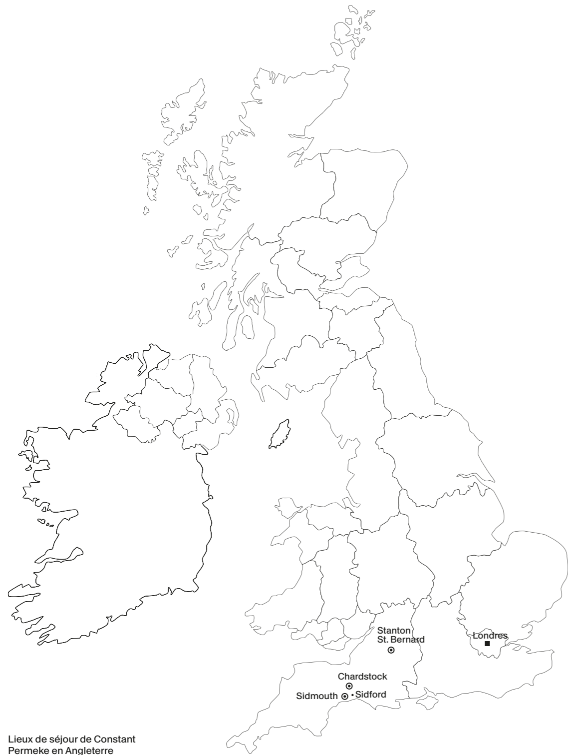
Lieux de séjour de Constant Permeke en Angleterre