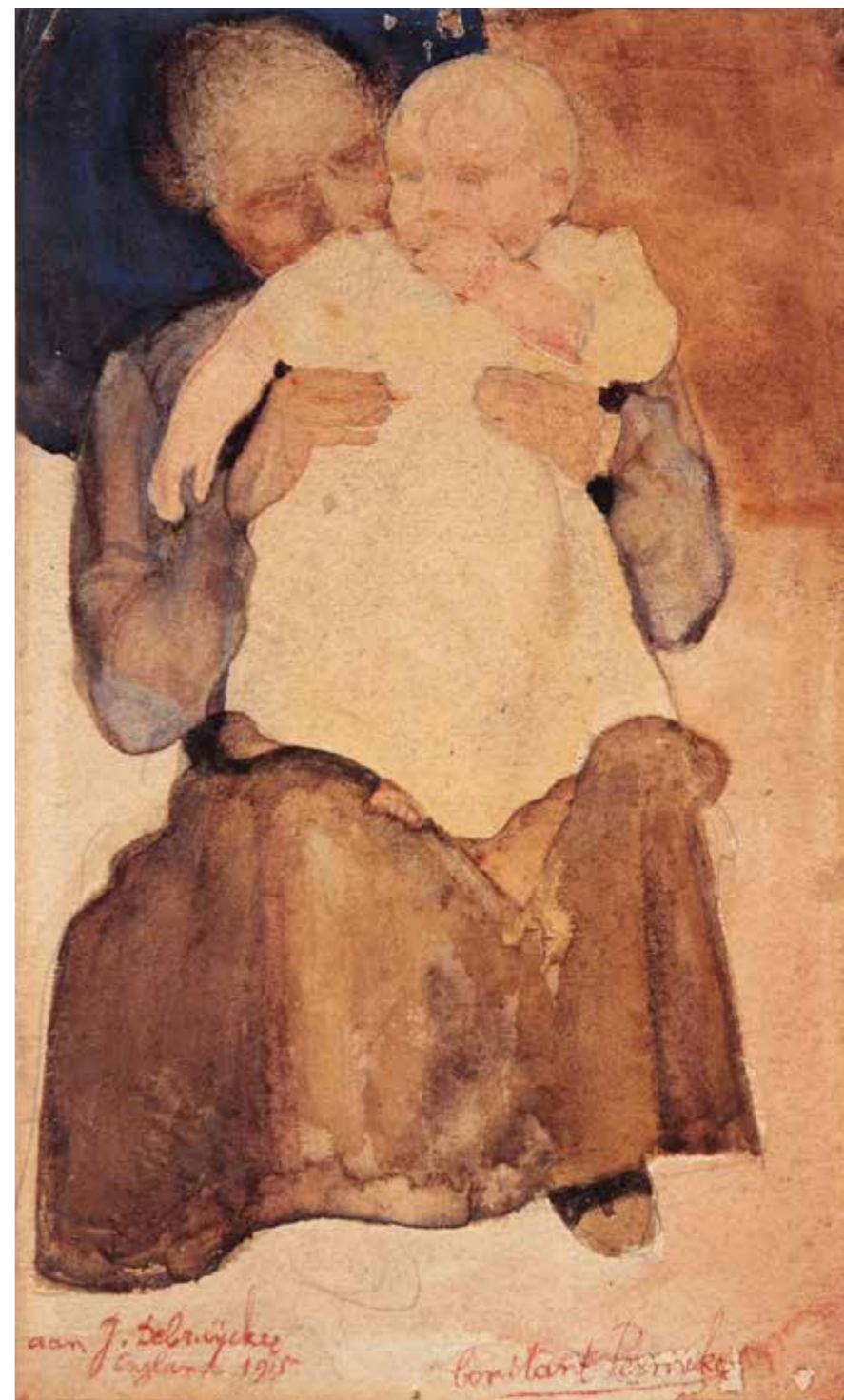
CAT.2 Constant Permeke, Maternité , 1915, aquarelle et encre sur papier, 22 × 13 cm, collection privée