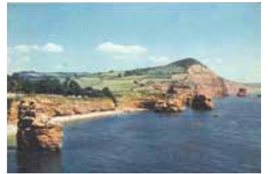
FIG. 35 Sidmouth, Comté du Devon