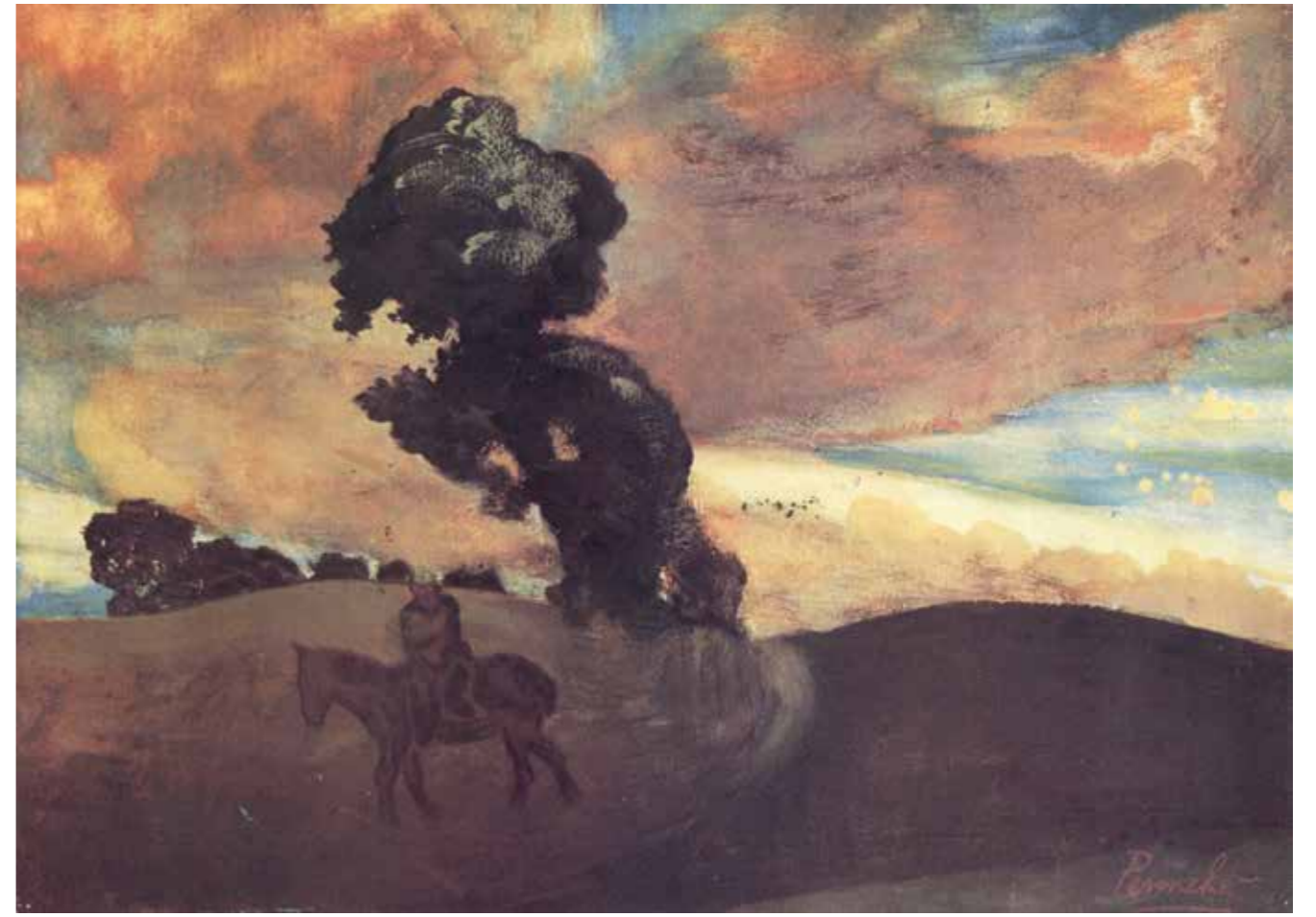
FIG. 37 Constant Permeke, Paysage avec cavalier, 1916-1917, collection actuelle inconnue