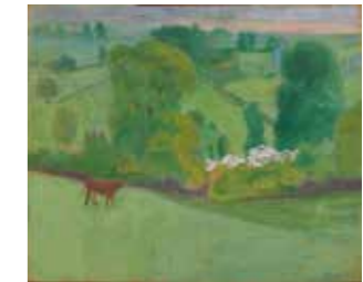
FIG. 38, p. 39

Signé en bas à droite Collection actuelle inconnue (anciennement collection Arthur Cornette, Anvers – publié dans Avermaete 1970, p. 12)