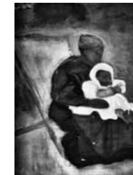
FIG. 28, p. 22

Exposée à la Belgian Exhibition of Modern Art à Kingston upon Thames, 15–27 mars 1915, cat. n° 56 Grand'mère Signée en bas à gauche Collection actuelle inconnue (publiée dans Van den Bussche 1986, p. 23 Couturière )