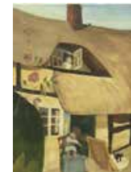
FIG. 29, p. 23

Exposée à la Belgian Exhibition of Modern Art à Kingston upon Thames, 15–27 mars 1915, cat. n° 55 Femme et enfant Signée en bas à gauche Collection actuelle inconnue (publiée dans Van den Bussche 1986, p. 23 Grand-mère et enfant )