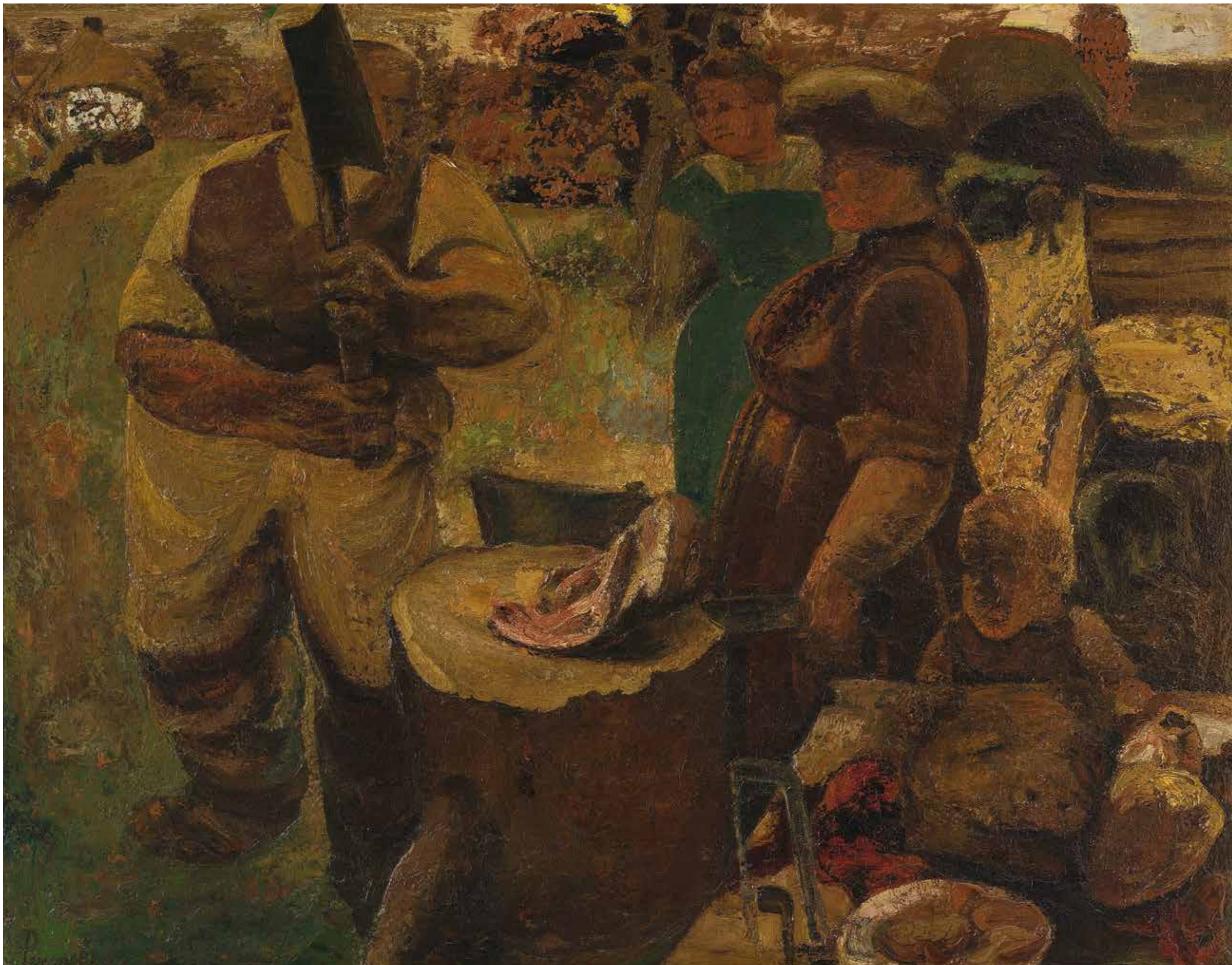
CAT. 5 Constant Permeke, Le boucher , 1916, huile sur toile, 116 × 147 cm, Musée d'Ixelles, collection Communauté flamande