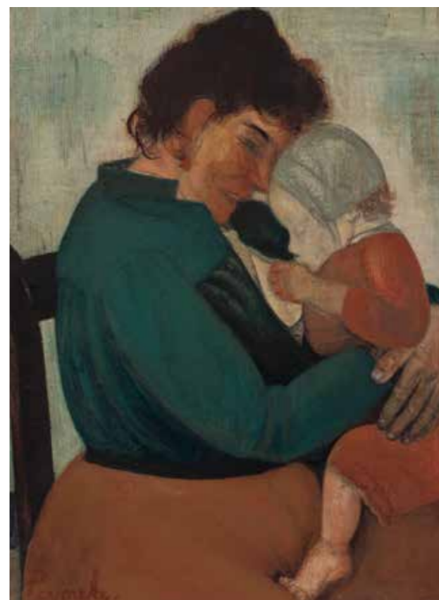
CAT. 1 Constant Permeke, Maternité (Femme ostendaise) , 1913, huile sur toile, 74 × 55 cm, Museum Boijmans Van Beuningen