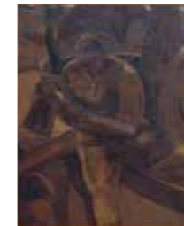
FIG. 42, p. 51

Signée en bas à droite Il s'agit peut-être de l'œuvre exposée à l' Exhibition of Belgian art, painting and sculpture, for the benefit of the Croydon General Hospital à Croydon, du 21 octobre au 11 novembre 1916, n° de cat. 72 Invalide Museum de Fundatie, Zwolle et Heino/Wijhe, inv. 0-2193