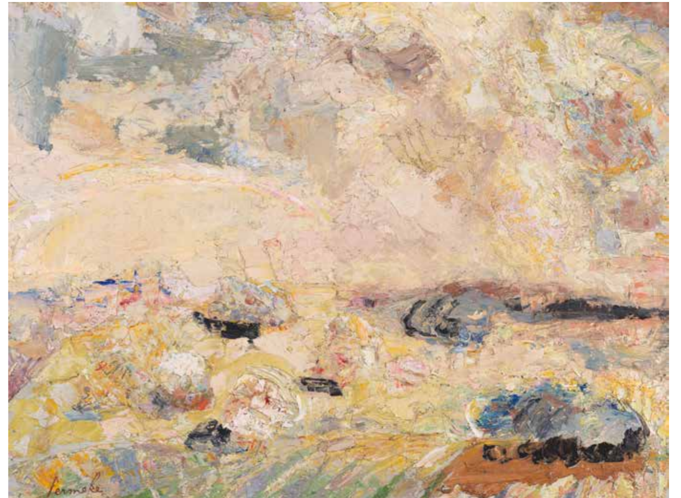
CAT. 22 Constant Permeke, Paysage du Devon , 1917, huile sur panneau, 41,5 × 55 cm, Mu.ZEE – Musée Permeke, inv. K002034, collection Communauté flamande