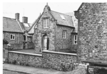
FIG. 31 L'école Saint Andrew à Chardstock, avec l'atelier de Constant Permeke sous le toit, 1916