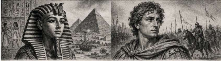
1. De val van een koning Toetanchamon (ca. 1341-1323 v.Chr.)