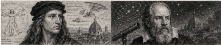
7. De jongen die alles wilde begrijpen Leonardo da Vinci (1452-1519)