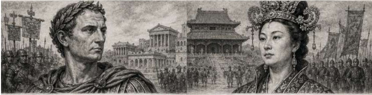
3. De gevangene die niet bang was Julius Caesar (100-44 v.Chr.)