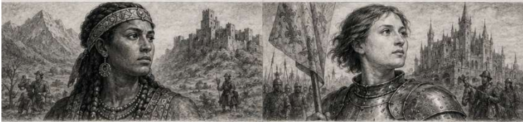
5. De vrouw uit de bergen Koningin Gudith (10e eeuw)