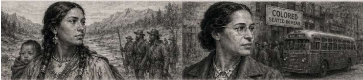
9. De vrouw die de weg kende Sacagawea (ca. 1788-1812)