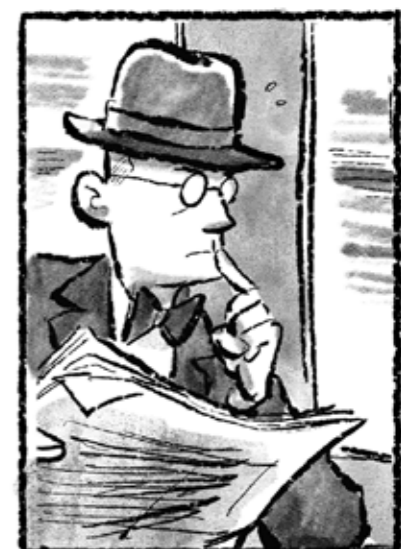
* Invoering algemene dienstplicht