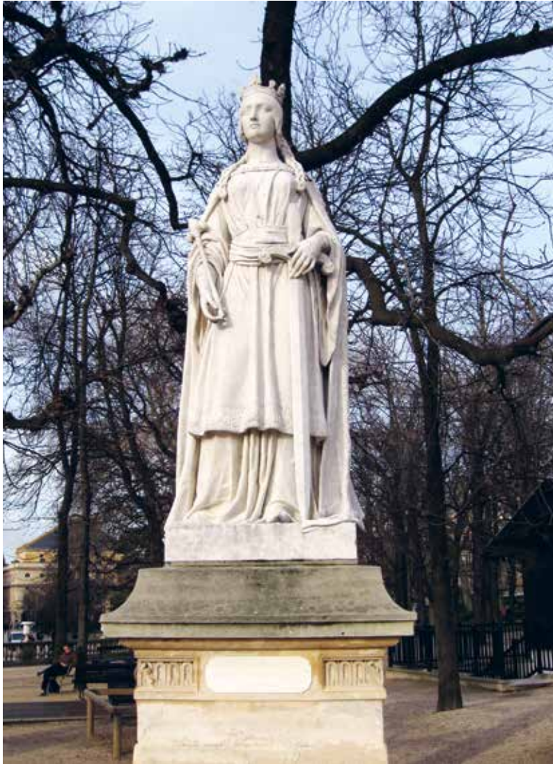
Standbeeld van Mathilde van Vlaanderen (19e eeuw) in Jardin du Luxembourg in Parijs