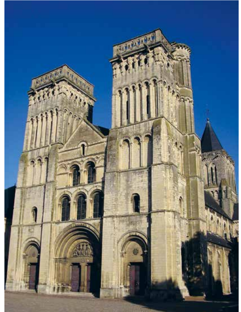
De Abbaye aux Dames in Caen