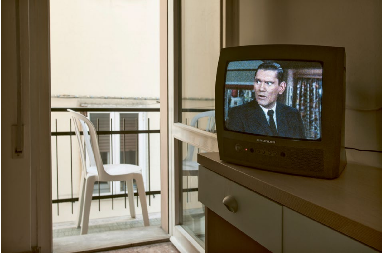
RICCIONE, MAART 2009. Een hotelkamer.