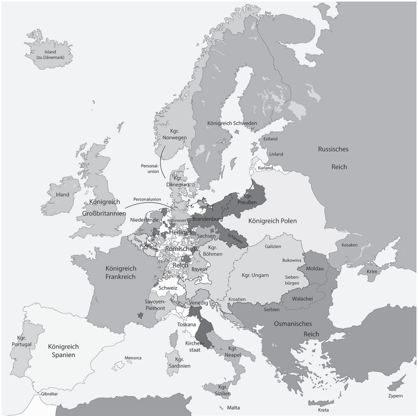
Het koninklijke Europa in 1789, voorafgaand aan de Franse Revolutie.