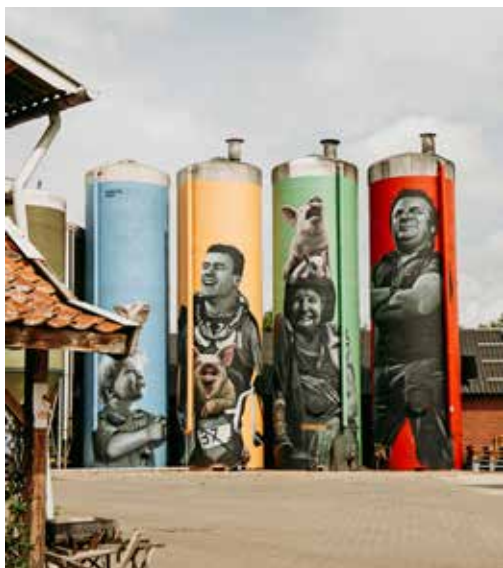
9 SILO ART