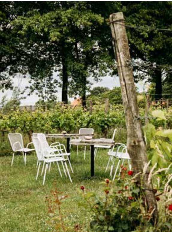
10 WIJNGOED MONTFERLAND