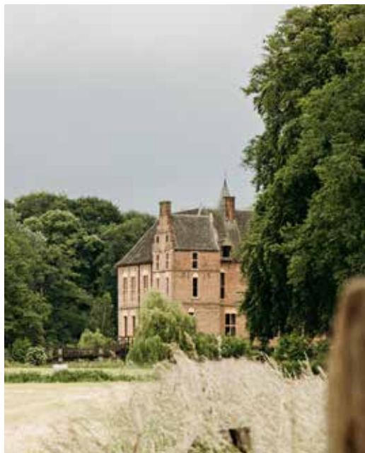
12 ACHTKASTELENROUTE, KASTEEL VORDEN