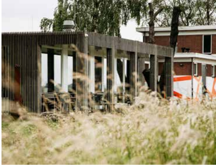
5 BRONKHORST, HET KUNSTGEMAAL