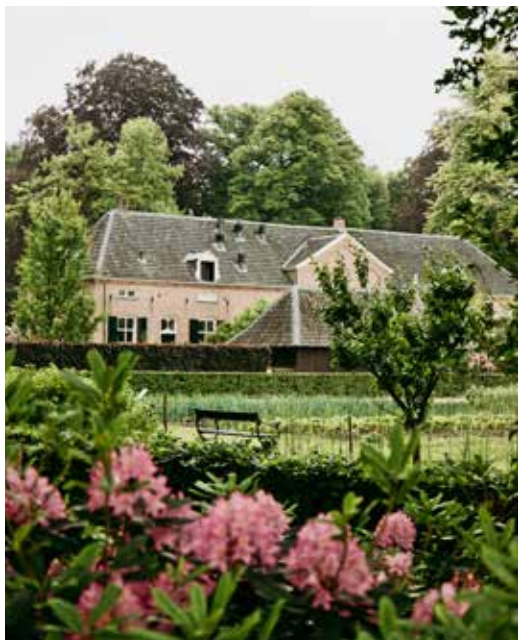
12 ACHTKASTELENROUTE, KASTEEL HACKFORT

Op de laatste dag van deze roadtrip ga je de mooie kastelen en natuur van de regio ontdekken. De Lochemse Berg, Groenlo, Bredevoort en Villa Mondriaan staan op het programma en je sluit de dag af bij een lokale bierbrouwerij of een beachclub! Nog een laatste dag genieten in de Achterhoek.