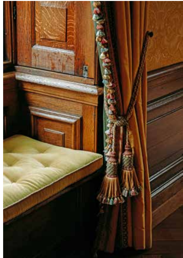
1 KASTEEL RUURLO