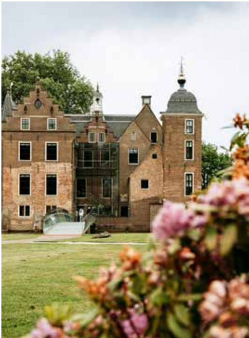
1 KASTEEL RUURLO

Je start diep in de Achterhoek en zet op dag één koers naar Kasteel Ruurlo, waar Museum MORE is gevestigd. Ook bezoek je vandaag het dorp Borculo en je eindigt in Hanzestad Zutphen.