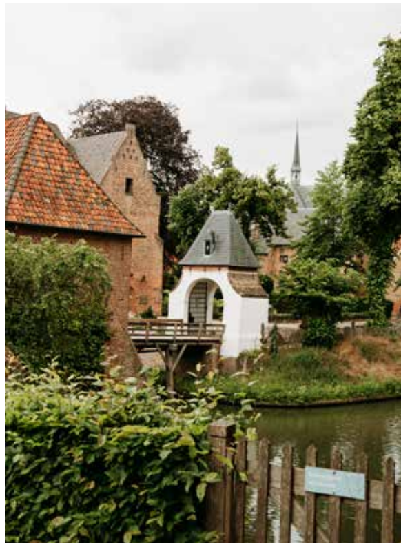
11 KASTEEL HUIS BERGH