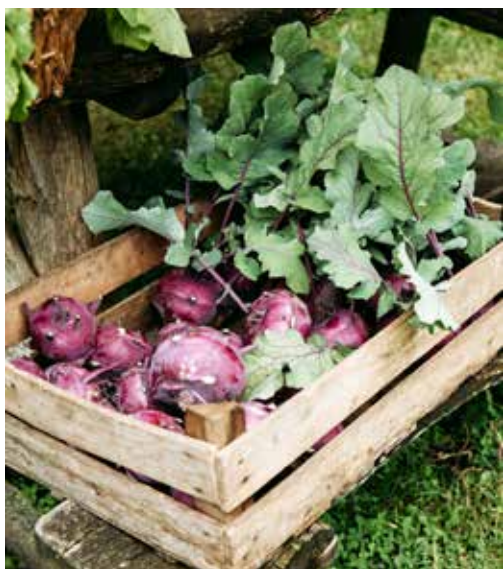
ACHTKASTELROUTE, KASTEEL HACKFORT