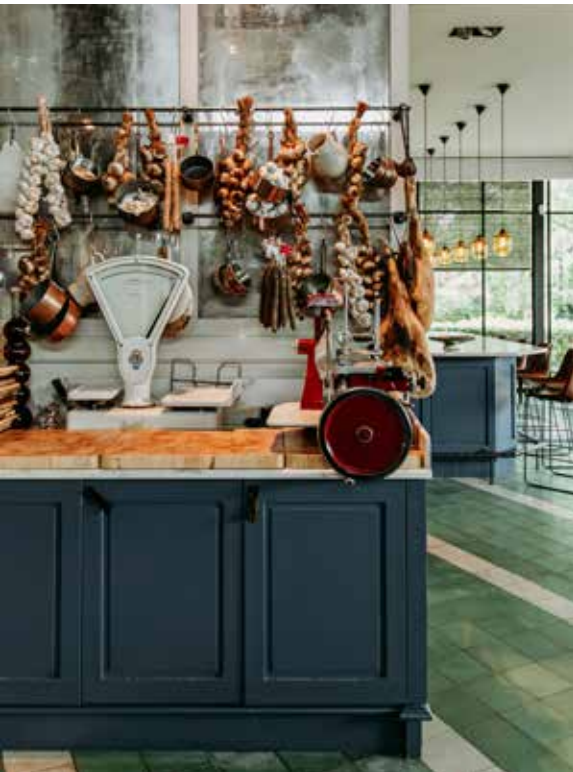
14 GROENLO, WELGELEGEN