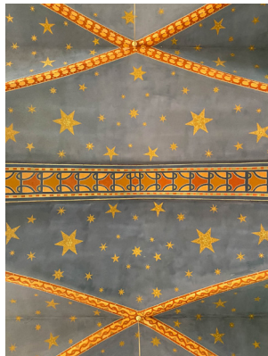
03 Jachthuis Sint Hubertus H.P. Berlage Hoge Veluwe, 1920