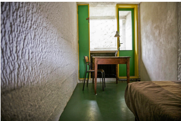
05 Couvent de la Tourette Monnikencel Le Corbusier Éveux, 1960