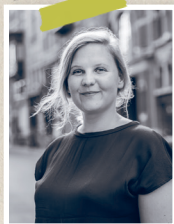
LOCAL NELE REUNBRUECK