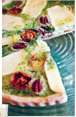
Lunch all afternoon