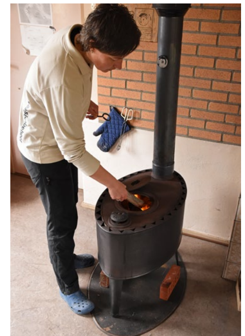
De kachel brandend houden is een dagtaak.