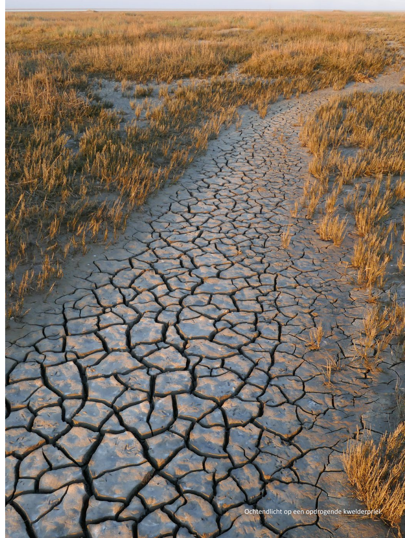
Ochtendlicht op een opdrogende kwelderpriel.