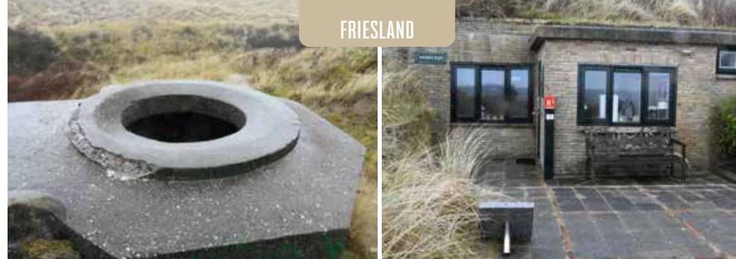
Formerum aan zee

Het is ook voorbij West-Terschelling goed toeven geweest voor de bezetters. De Duitsers stuurden er veel soldaten heen die moesten bijkomen van het front, ver weg. Een invasie viel hier niet te verwachten. Ze zaten er op hun gemak, met schnaps bij de hand. Het was alsof ze er Urlaub hadden, maar