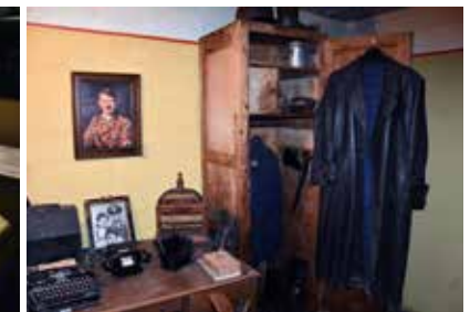
Interieur officiersruimte Bertha-bunker