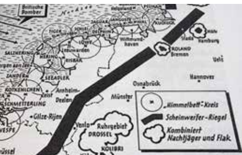
Overzichtskaart van Duitse radarstellingen

werd eerst Anjelier genoemd en heet nu Het Kraaiennest. Het was nog maar het begin van de tournure naar het opnieuw volledig bloot leggen van het Tigercomplex. Dit was geen projectontwikkeling maar het betere erfgoedwerk. De tijd was er rijp voor, het wegstoppen voorbij. De ontginning begon in 2009, nadat Bertha al met veel kruip-door-sluip-door