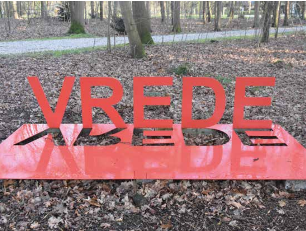
Begraafplaats Ysselsteijn vrede