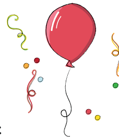
de rode ballon

Bijvoeglijke naamwoorden zijn woorden die iets vertellen over het zelfstandig naamwoord. Het geeft iets aan over een eigenschap, toestand of kenmerk van het zelfstandig naamwoord. Meestal staat het bijvoeglijk naamwoord direct voor het zelfstandig naamwoord. Je kunt het bijvoeglijk naamwoord vinden door jezelf de vraag te stellen: 'Wat is + (zelfstandig naamwoord)?'