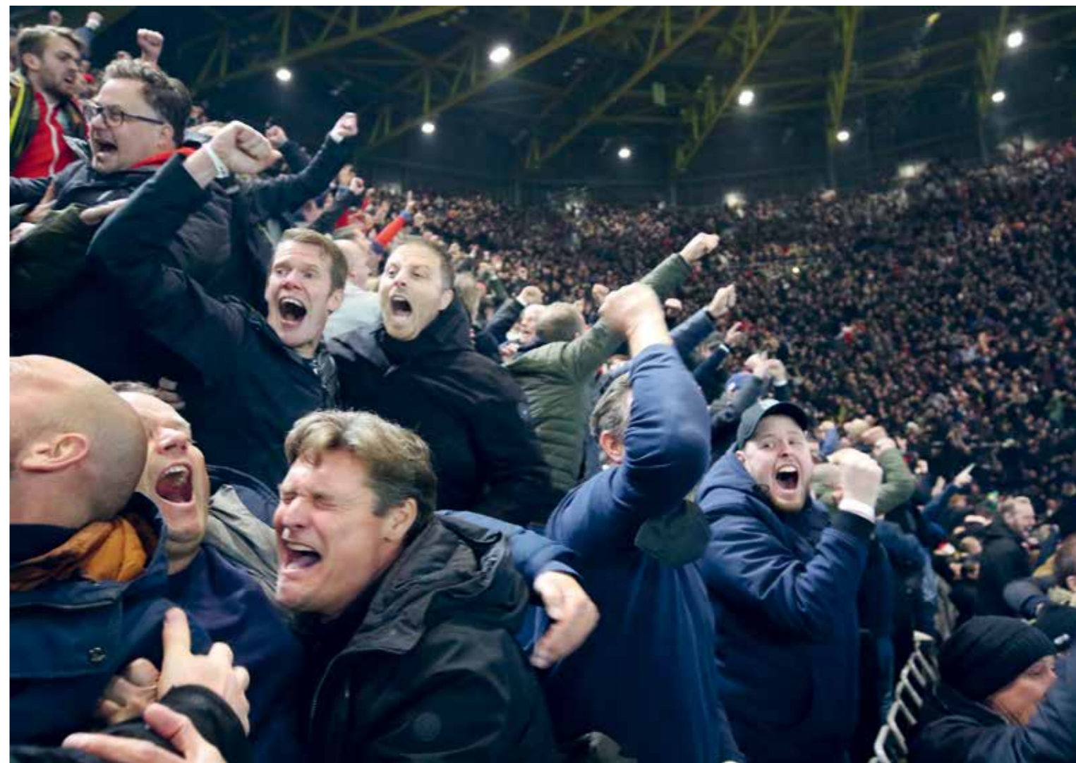
Het Ajax-vak gaat uit zijn dak want Ajax wint in Dortmund.

Het heeft iets van een Wiedergutmachung dat een lichte ingreep van Jurriën Timber jegens Bellingham door