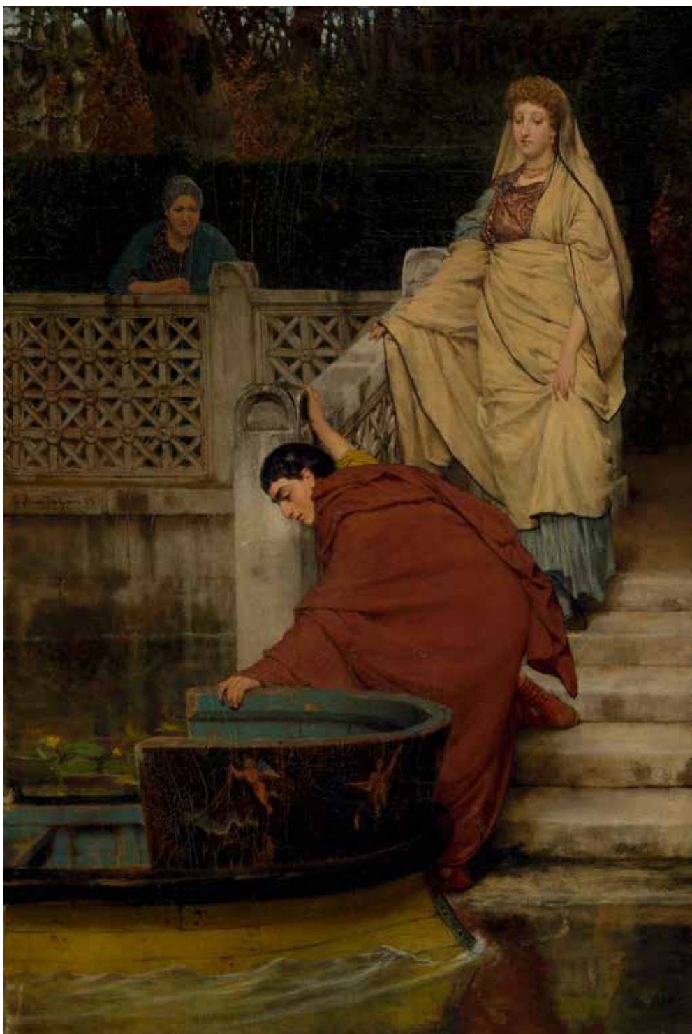
2 Lourens Alma Tadema Spelevaren , 1868 Olieverf op doek 82,5 × 56,3 cm