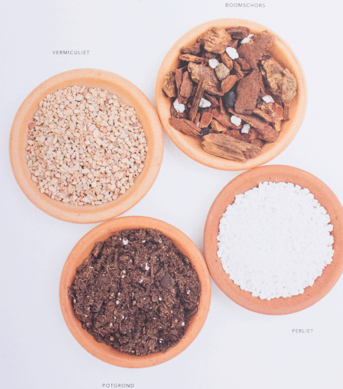
EPIPHEMNUM AUREUM 'PEARLS EN JADE'

Om gezond te blijven hebben je kamerplanten af en toe extra voeding nodig. Het is belangrijk te weten dat kamerplantengrond doorgaans voldoende voedingsstoffen bevat voor de eerste zes maanden na het verpotten. Daarna heeft de plant voeding nodig om mooi te blijven en goed te blijven groeien. Er zijn verschillende soorten kamerplantenvoeding, met name vloeibaar en in korrelvorm. Volg de instructies op de verpakking. Te veel voeding kan de planten schade toebrengen (bladverlies en verbranding). Gebruik de voeding niet bij ongezonde of heel jonge planten, of in de rustfase (herfst/winter). Algemeen geldt: hoe groter de plant en hoe sneller hij groeit, hoe meer voedingsstoffen hij nodig heeft. Dien het voedsel toe in lente en zomer, tijdens de actieve groeiperiode. Hoe vaak? Dat geven we aan per plant bij de plantprofielen.