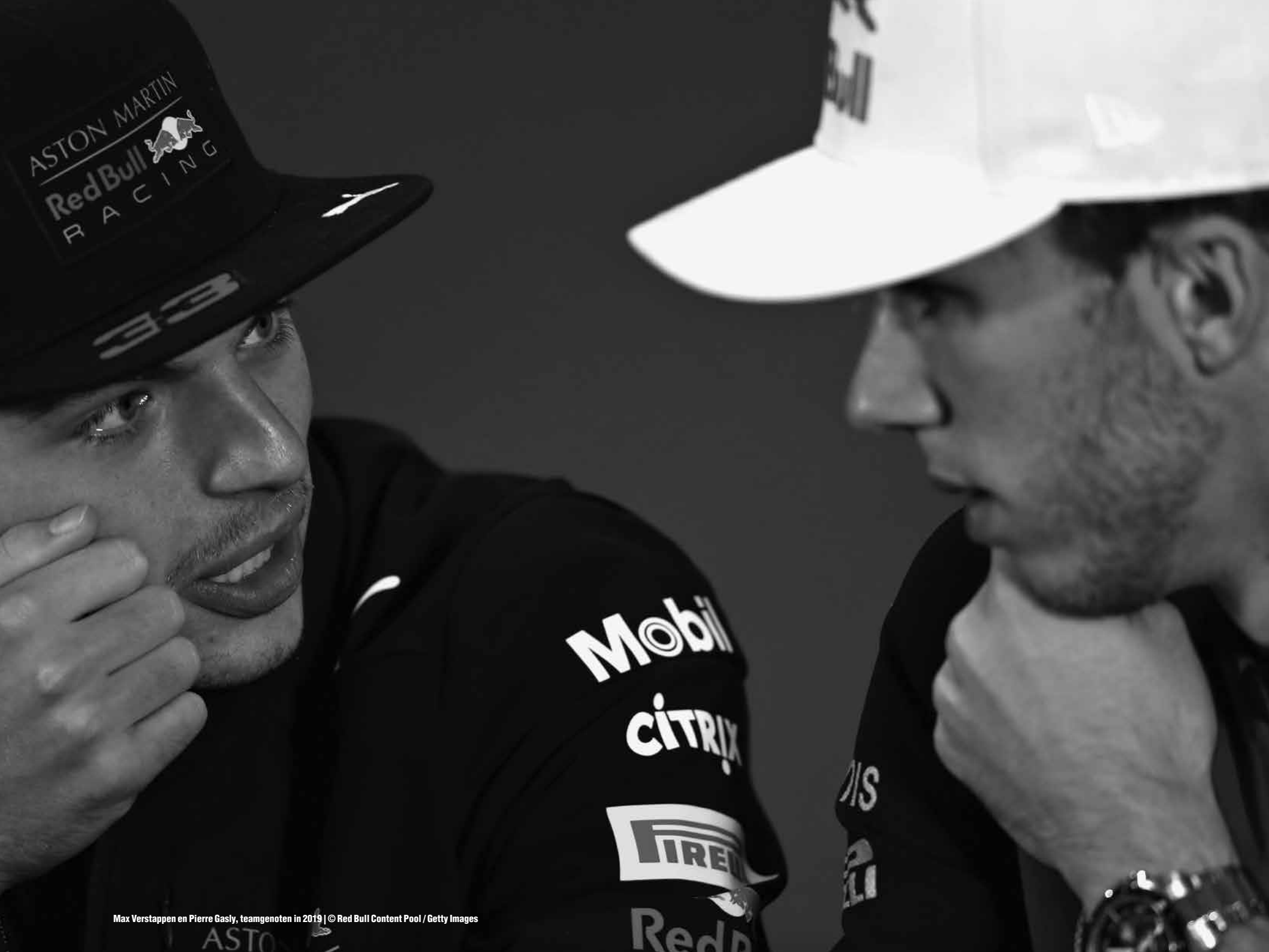
Max Verstappen en Pierre Gasly, teamgenoten in 2019