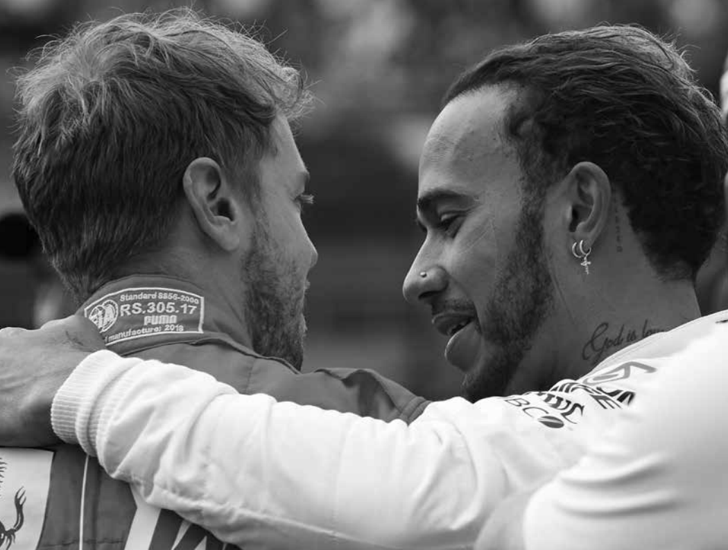
Sebastian Vettel en Lewis Hamilton, de rivalen van 2018

De wandeling naar de pitmuur, waar Vettel zich verontschuldigde bij teambaas Maurizio Arrivabene en de andere leden van het team, was een van de langste van zijn leven. De 31-jarige Duitser wist dat hij het had verknald. Hij deed geen enkele moeite om naar excuses te zoeken. 'We hoeven niet te analyseren waar het misging. We hadden de snelheid, we controleerden de race en het eindigde in de grindbak.' Het was niet de eerste keer dat Vettel in de strijd met Lewis Hamilton, die nu al twee seizoenen duurt, een kostbaar slippertje maakte. In 2017 liet hij in de Grand Prix van Azerbeidzjan al zien dat de spanning hem soms te veel wordt. Toen Hamilton het tempo achter de safety-car flink liet zakken, was Vettel zijn irritatie niet langer de baas. Uit het niets deelde hij in de smalle straten van Bakoe een beuk uit, alsof hij Hamilton wilde aansporen nu eindelijk eens normaal te doen. Het incident bij de start van de Grand Prix van Mexico dat jaar, tussen Max Verstappen, Hamilton en Vettel, was misschien nog wel veelzeggender. Daar vergooide hij zijn titelkansen onnodig en definitief. Je zou verwachten dat hij ervan geleerd zou hebben, maar in 2018 ging het niet veel beter. Een slippertje zoals in – weer – Bakoe kan een keer voorkomen. Maar Vettel raakte afgelopen seizoen bij te veel incidenten betrokken. De crash met Valtteri Bottas in Frankrijk, de gridstraf die