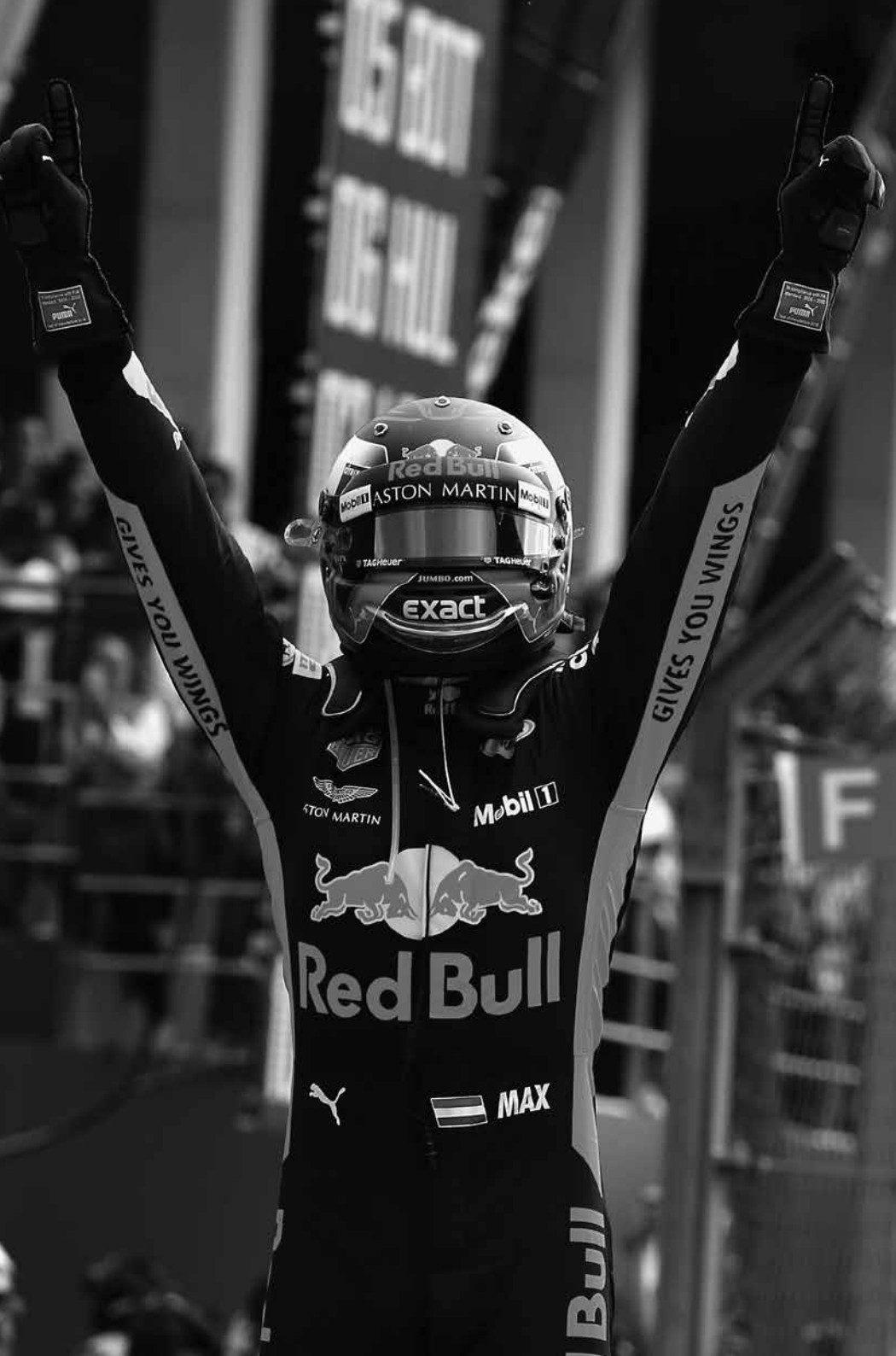
Max Verstappen, 2018