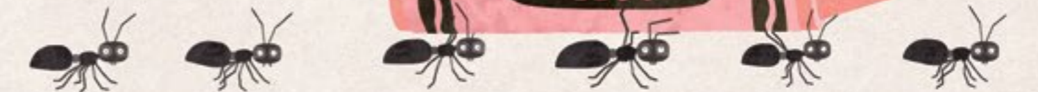
En dit is een mier.