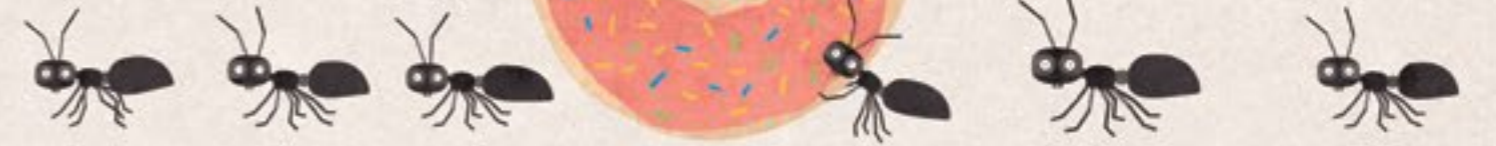
En dit is een mier.