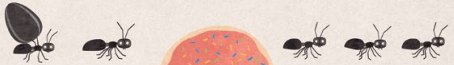
En dit is een mier.