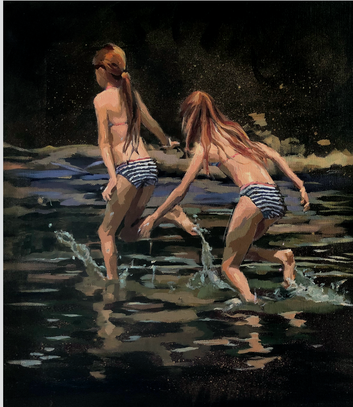
Twingirls 80 x 70 cm - 2019