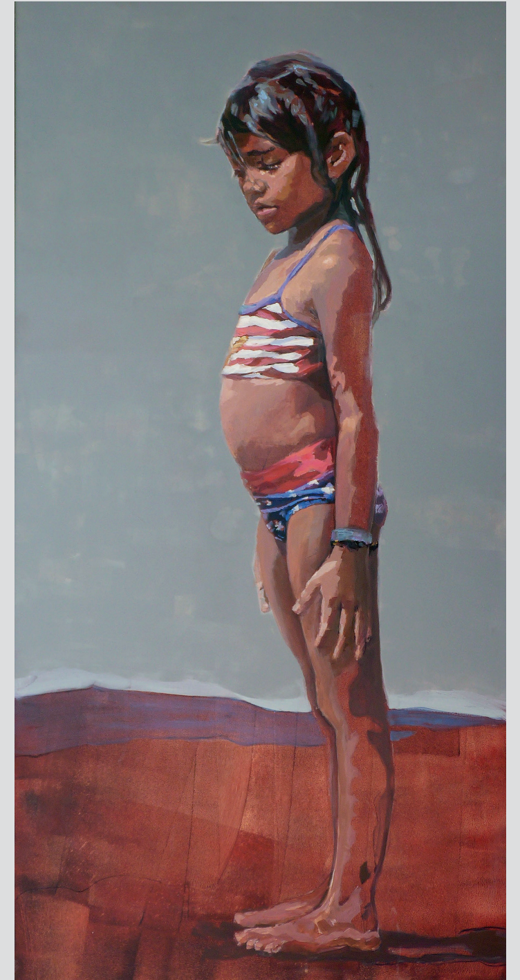
Standing Still nr.2 120 x 60 cm - 2018

Omdat ik mijn werk iets universeels probeer mee te geven, ben ik altijd op zoek naar dit soort veelzeggende momenten. Voor ik begin met schilderen maak ik het doek of paneel vaak eerst heel donker, zelfs zwart. Van daaruit schilder ik het licht erin. Door delen van de donkere ondergrond te laten staan lijkt er meer diepte in het schilderij te komen. Soms ook houd ik de achtergrond helemaal donker en is alleen de figuur lichter, wat in sommige situaties de zeggingskracht sterker kan maken.