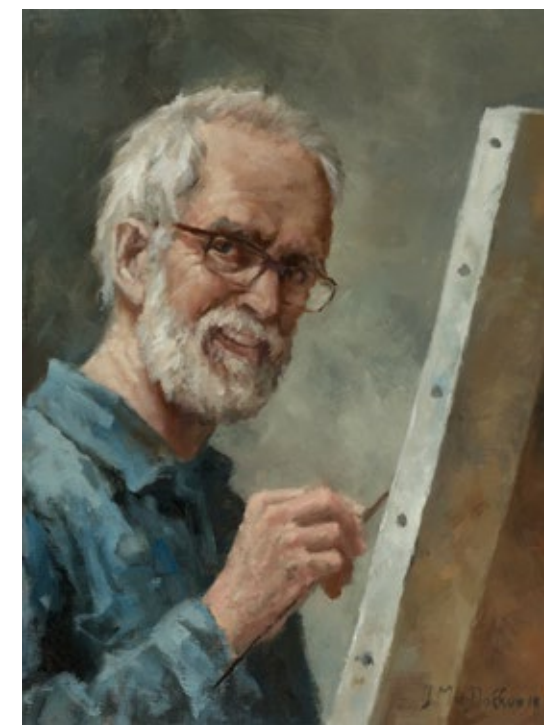
Zelfportret • 40 x 30 cm • 2015