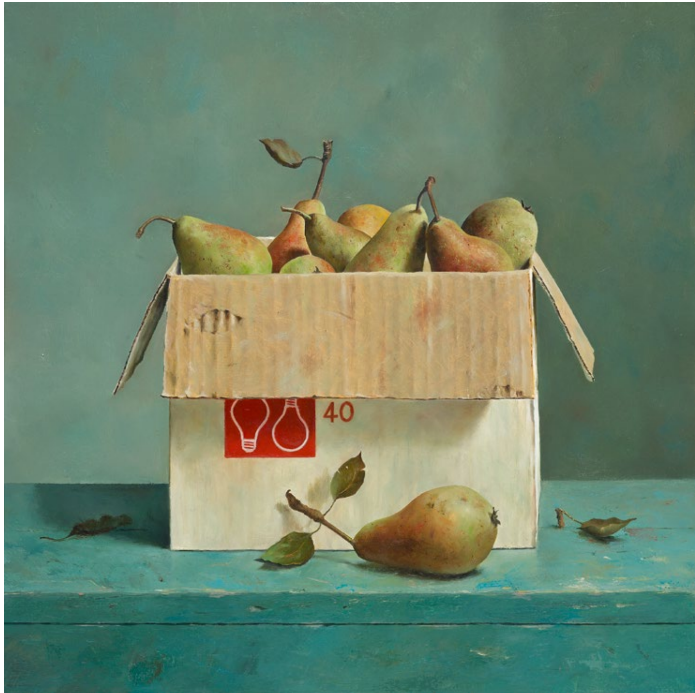
Doos met peertjes • 38 x 39 cm • 2001