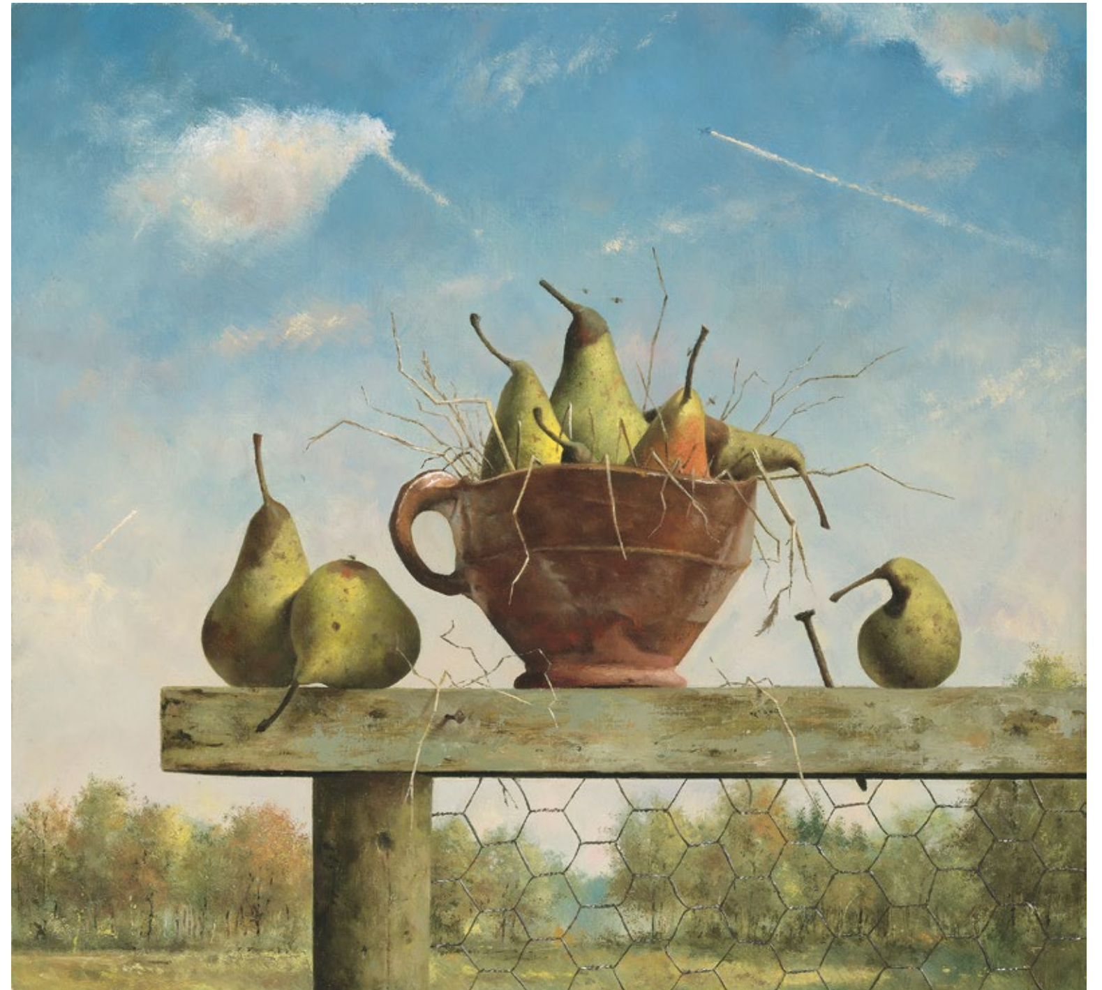
Nest met peren II • 41 x 45 cm • 2006