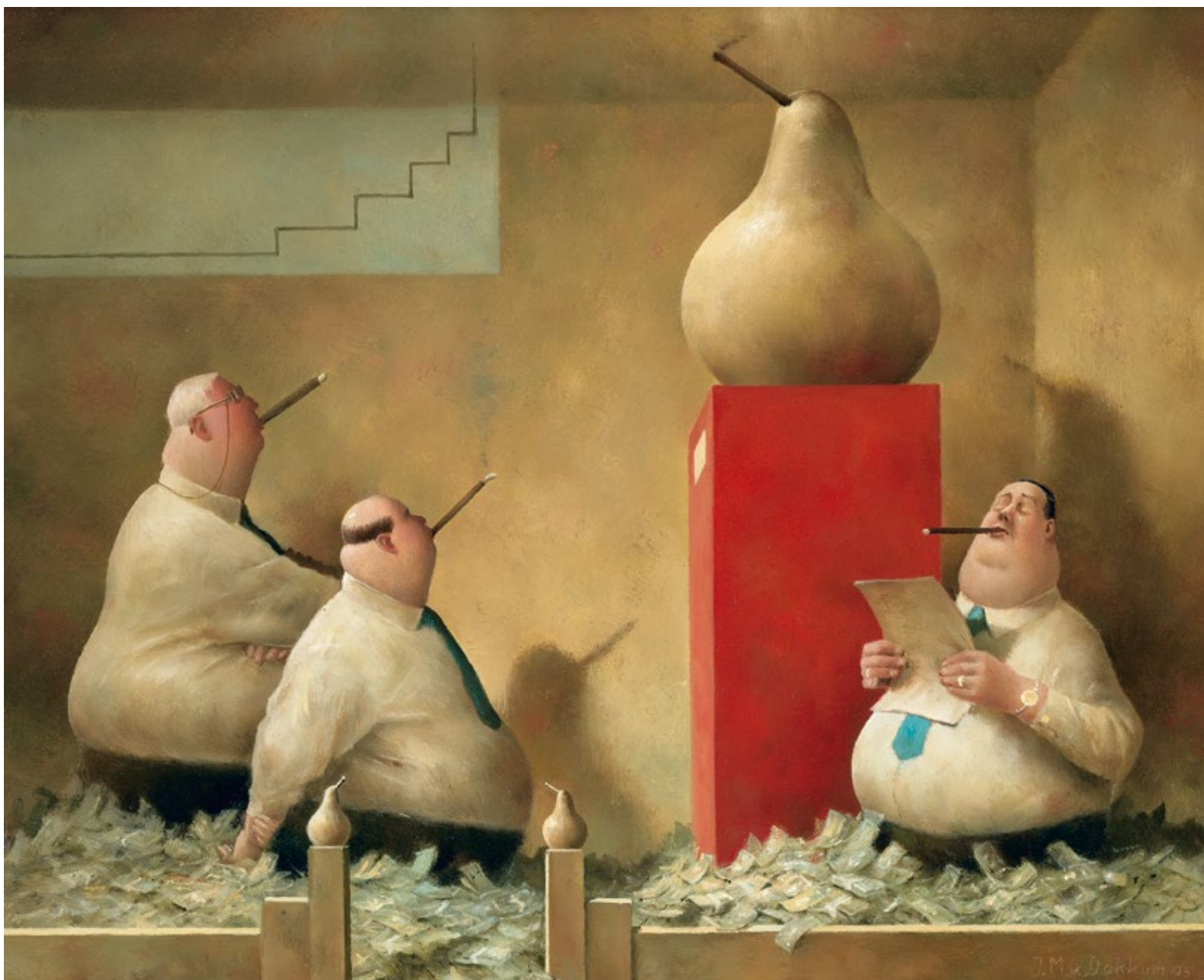
Gouden peren • 40 x 49 cm • 2005