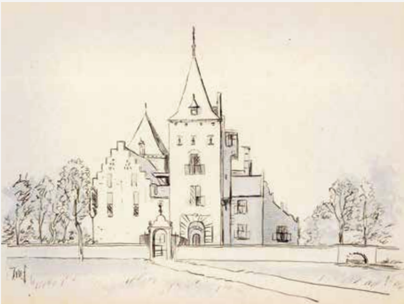
Gezicht op huis Amerongen, gezien vanuit het oosten, naar Roelant Roghman.