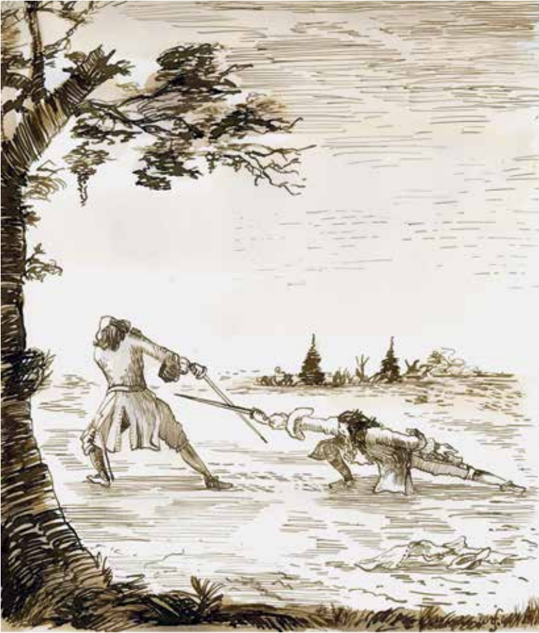
Duel op het Malieveld, naar gravure.