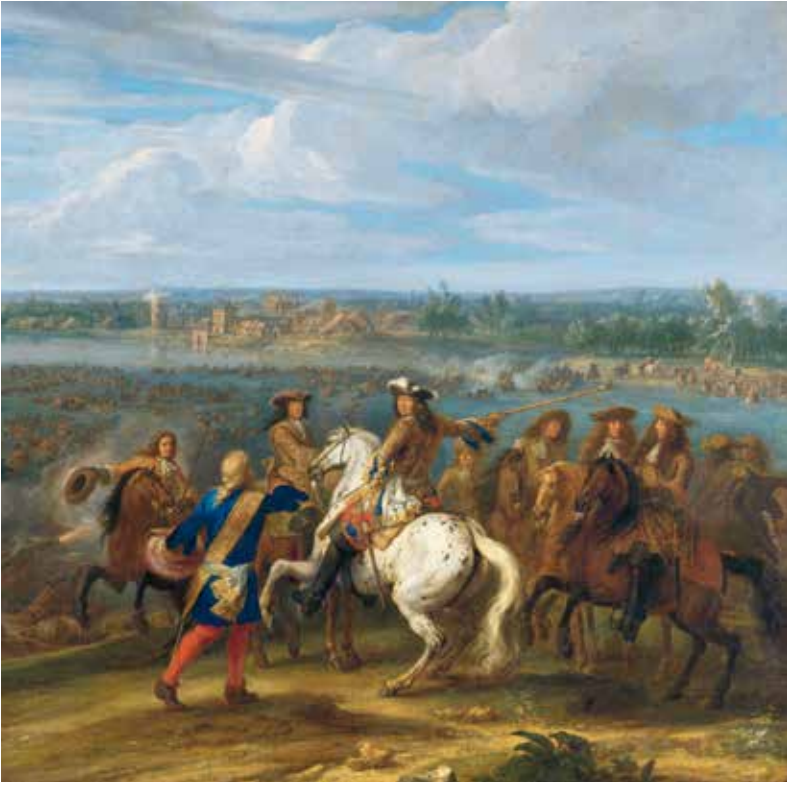
Lodewijk xiv trekt bij Lobith Nederland binnen, 1672, Adam Frans van der Meulen, Rijksmuseum Amsterdam.

Op 18 mei verklaarden Münster en Keulen de oorlog aan de Republiek. Twee enorme Franse legers van in totaal 120.000 manschappen waren de dag ervoor verenigd in het plaatsje Visé (Wezet), vlak onder Maastricht.