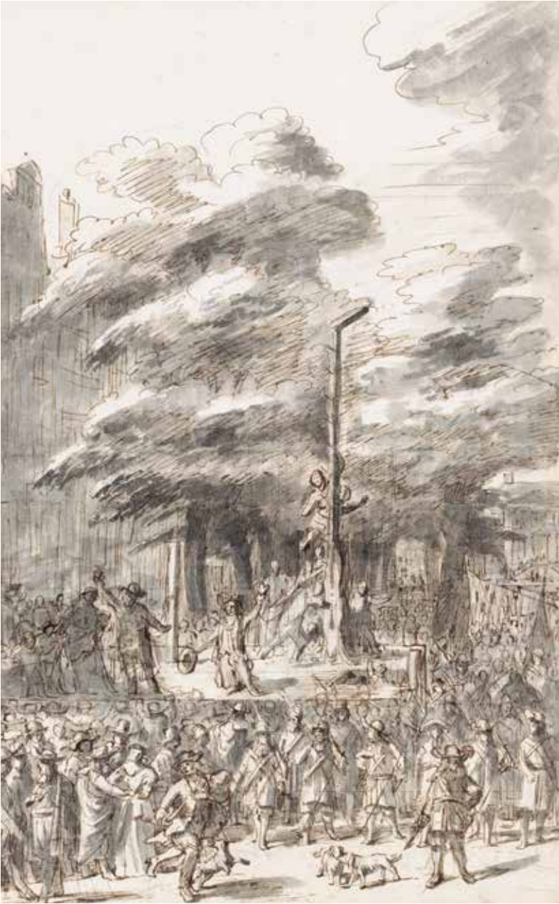
Verminking van de lichamen van de gebroeders de Witt, Romeyn de Hooghe, 1672, Rijksmuseum Amsterdam.