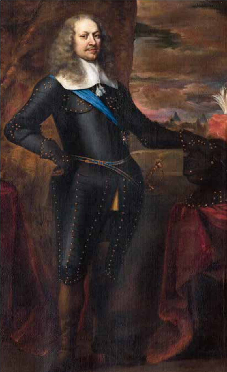
Godard Adriaan baron van Reede, Jurriaen Ovens, 1660, Collectie Stichting Kasteel Amerongen.