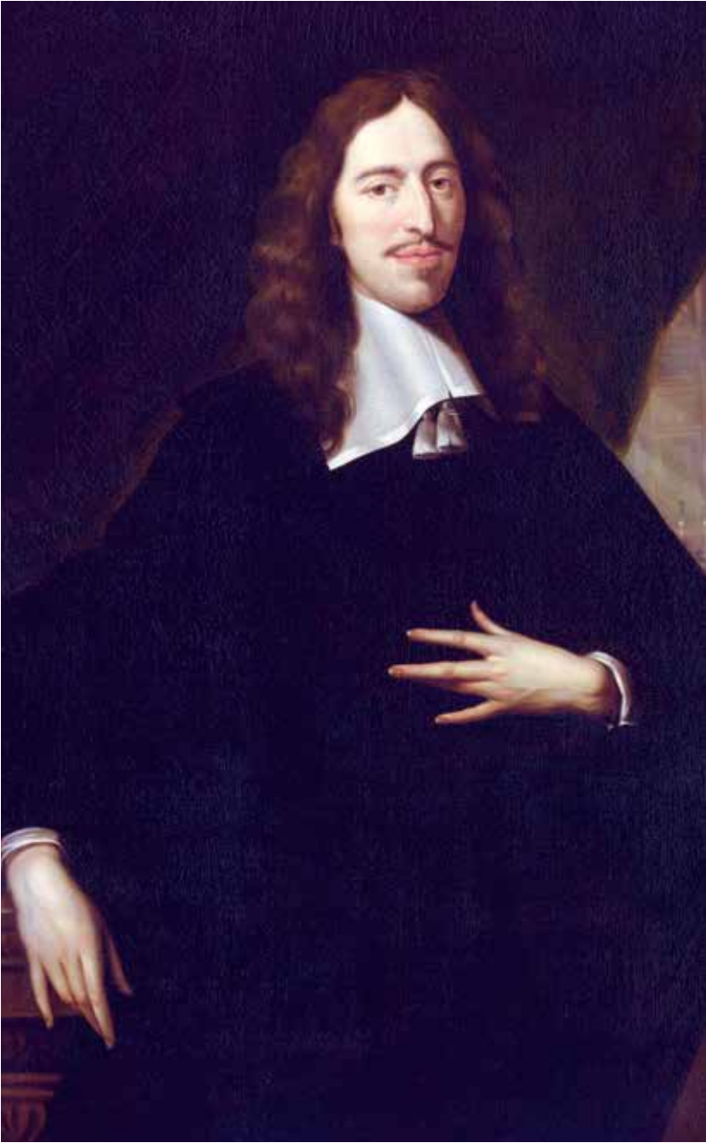
Portret van Johan de Witt, (kopie naar) Jan de Baen 1643-1700, Rijksmuseum Amsterdam.