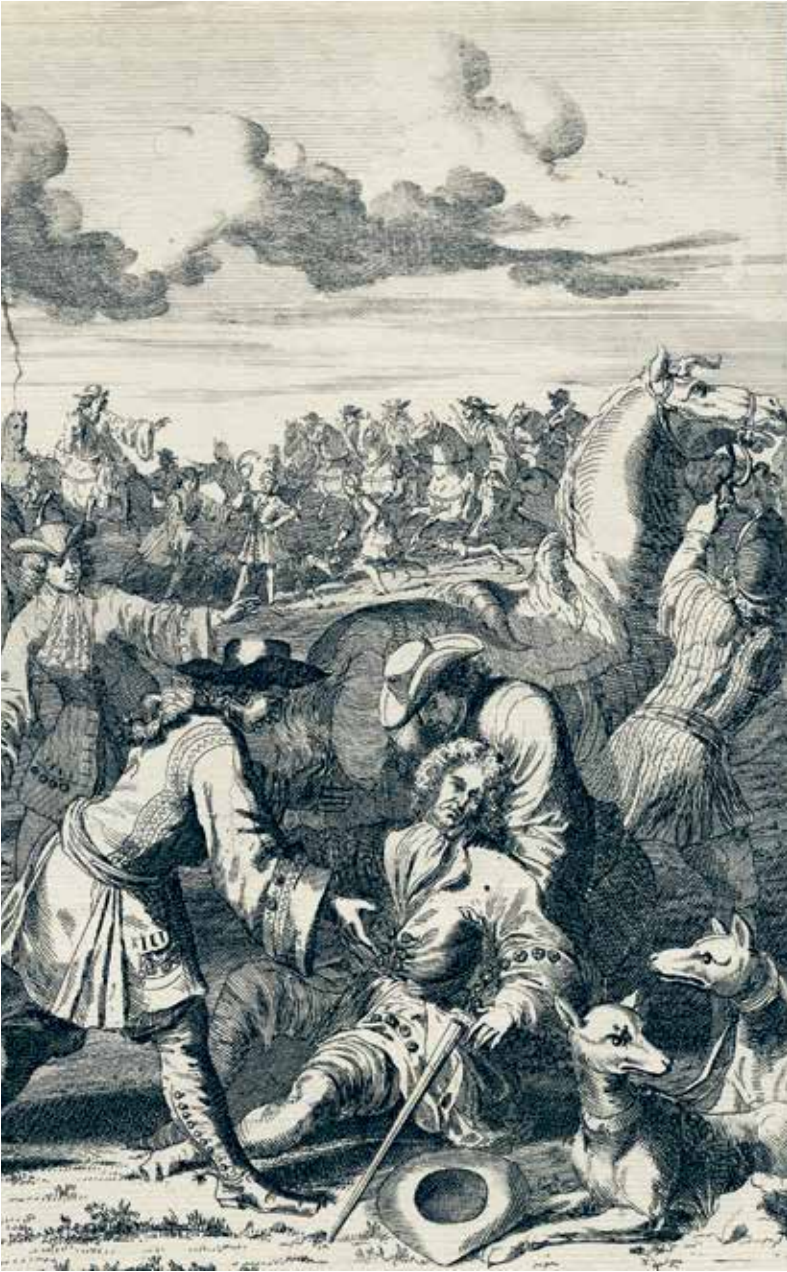
De dodelijke val van Willem III tijdens een jachtpartij, 1702, Pieter van den Berge, Rijksmuseum Amsterdam.