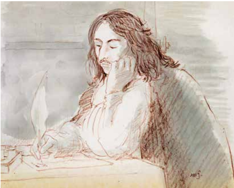
De briefschrijver, naar Caspar Netscher.

Een dag later, op 20 juli, voelde De Witt zich gedwongen zich in een brief aan de Staten van Holland, die integraal zou worden gedrukt en verspreid, te verweren tegen aantijgingen van corruptie (zie pagina 209).