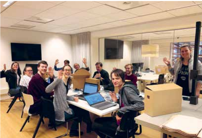
Het Johan de Witt-team aan het werk op het Nationaal Archief op 11 maart 2020, de laatste keer voordat de COVID-pandemie uitbrak.