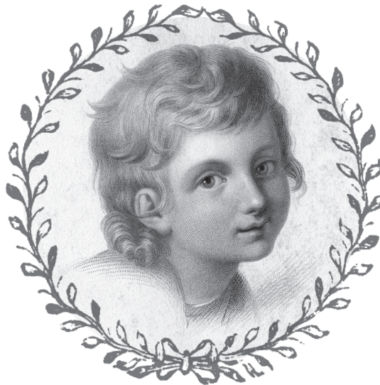
..... Hierboven: Een jonge prins Albert, Victoria's neefje en jonge huwelijkskandidaat Volgende bladzijde: Prinses Charlotte; haar dood bracht Victoria dichterbij de troon.