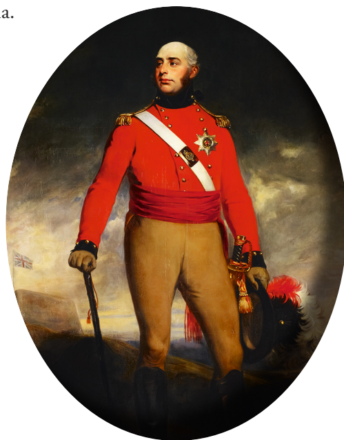
..... Hierboven: De hertog van Kent, Victoria's vader en vierde zoon van George III

Zes dagen na de dood van de hertog stierf ook zijn vader, koning George III. Binnen een week tijd was kleine baby Drina een heel stuk dichterbij de troon gekomen.