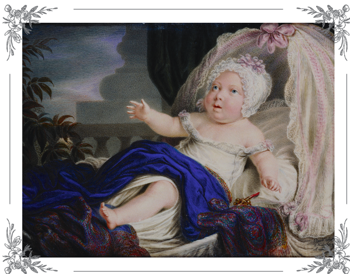
..... Rechtsboven: Aankondiging van de koninklijke geboorte in The London Gazette Hierboven: 'Blond en mollig' – baby Victoria

Ondanks de uitputtende 690 kilometer lange reis vanaf het continent beviel de hertogin van Kent, die hiervan geen nadelige gevolgen leek te hebben ondervonden, op 24 mei om kwart over vier in de morgen van een mooie, blonde en mollige baby. Het meisje leek op haar vader, met de onmiskenbare grote blauwe ogen van de Hannoverianen. De geboorte zorgde ervoor dat het Britse volk unaniem een zucht van verlichting slaakte, aangezien deze samenviel met een van de aanvallen van waanzin van de oude koning George III en het regentschap van zijn oudste, impopulaire zoon George.