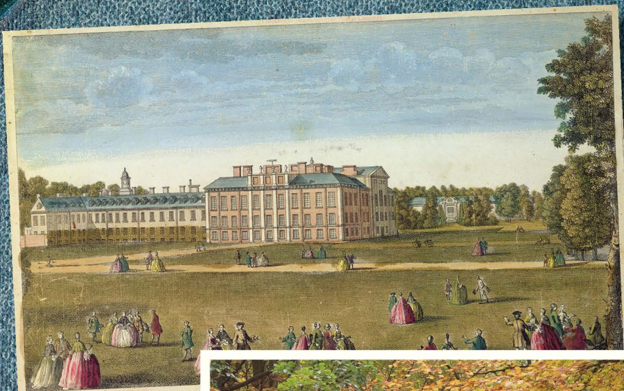
A Front View of the ROYAL P.