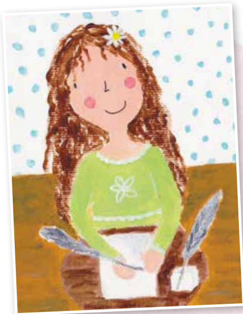
In nachtjapon de laatste hand leggen aan Mansfield Park