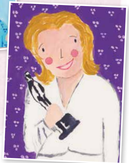
In 1996: belangrijke filmprijs voor Sense and Sensibility!