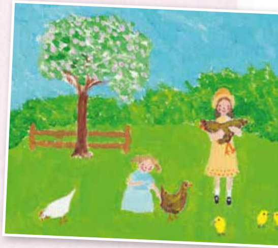
Vroege jeugd in Steventon