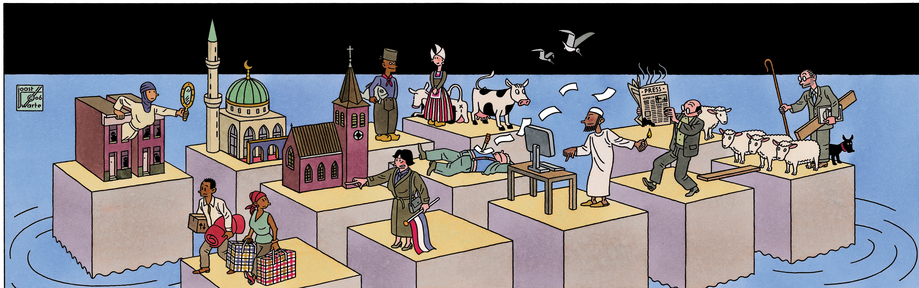
22 Maatschappelijke kwesties die spelen in Nederland per onderwerp toegelicht. Ik tekende Nederland als eilandenrijk met de vermoorde Theo van Gogh als middelpunt.