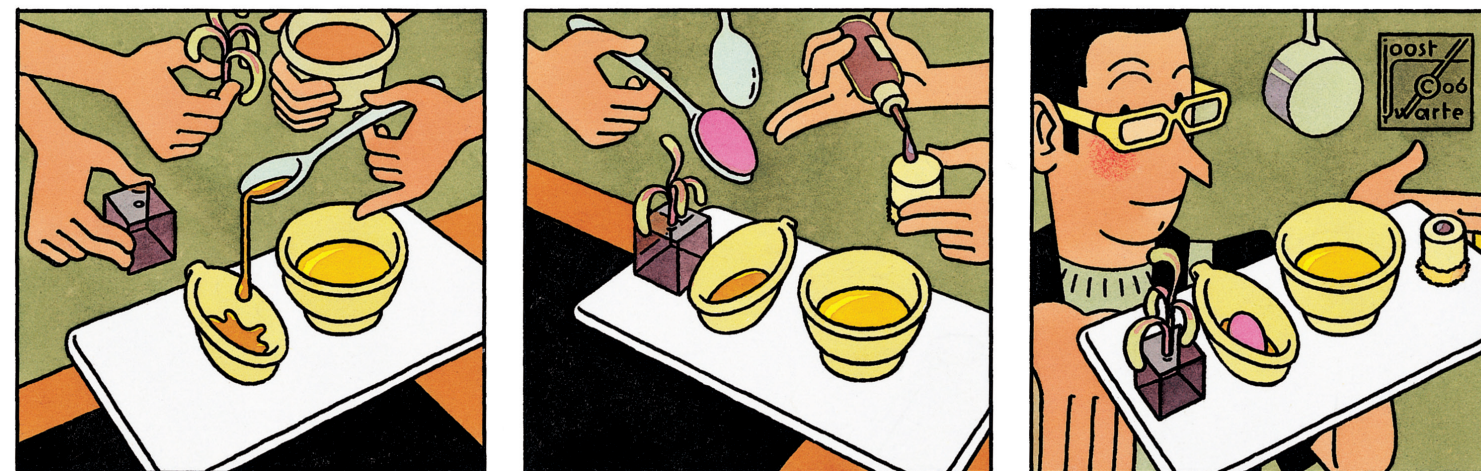
27 Een nieuwe trend: het dessertlaboratorium. In een restaurant dineren en daarna naar een andere, gespecialiseerde zaak voor het dessert en de nazit.