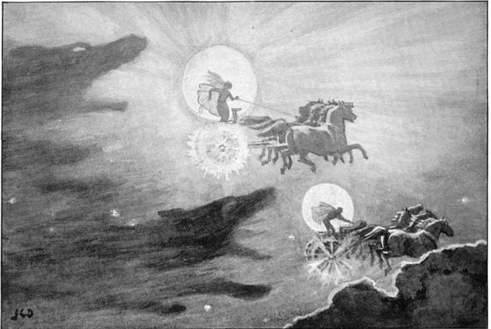
De Wolven vervolgen Sol en Mani

De godin van de nacht was driemaal getrouwd geweest, en bij haar eerste man Naglfari, had zij een zoon die Aud heette, bij haar tweede, Annar, een dochter Jörd; en bij haar derde, de god Dellinger (dageraad) werd haar nu een andere zoon, van stralende schoonheid, geboren, en hij ontving de naam Dag.