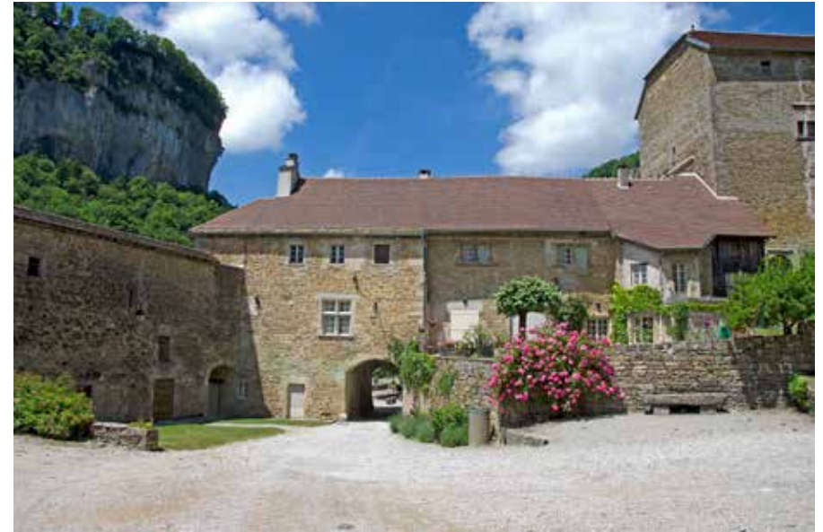
Het Benediktijnse klooster van Baume-les-Messieurs in het grootse decor van kalkstenen rotswanden

Op weg naar een van de mooiste locaties in de Jura, Baume-les-Messieurs, komen we langs Poligny (N83, N5) en Château-Chalon (D68, D96 en D5). Poligny is de hoofdstad van de Comté kaas en Château-Chalon is bekend vanwege de 'Vin Jaune'. We nemen deze route omdat we via de D5 dwars door het wijndorp komen. Hoewel de weg soms akelig smal wordt, genieten we van de panorama's over de wijngaarden vanuit Château-Chalon en op de slingerweg naar Voiteur. We rijden dit stuk in het late voorjaar, maar hier moet je eigenlijk eind september zijn, als de druivenbladeren geel en dieprood kleuren. Het op een heuvel gelegen dorp met zijn fraaie abdijkerk is een van de meest fotogenieke in de Jura.