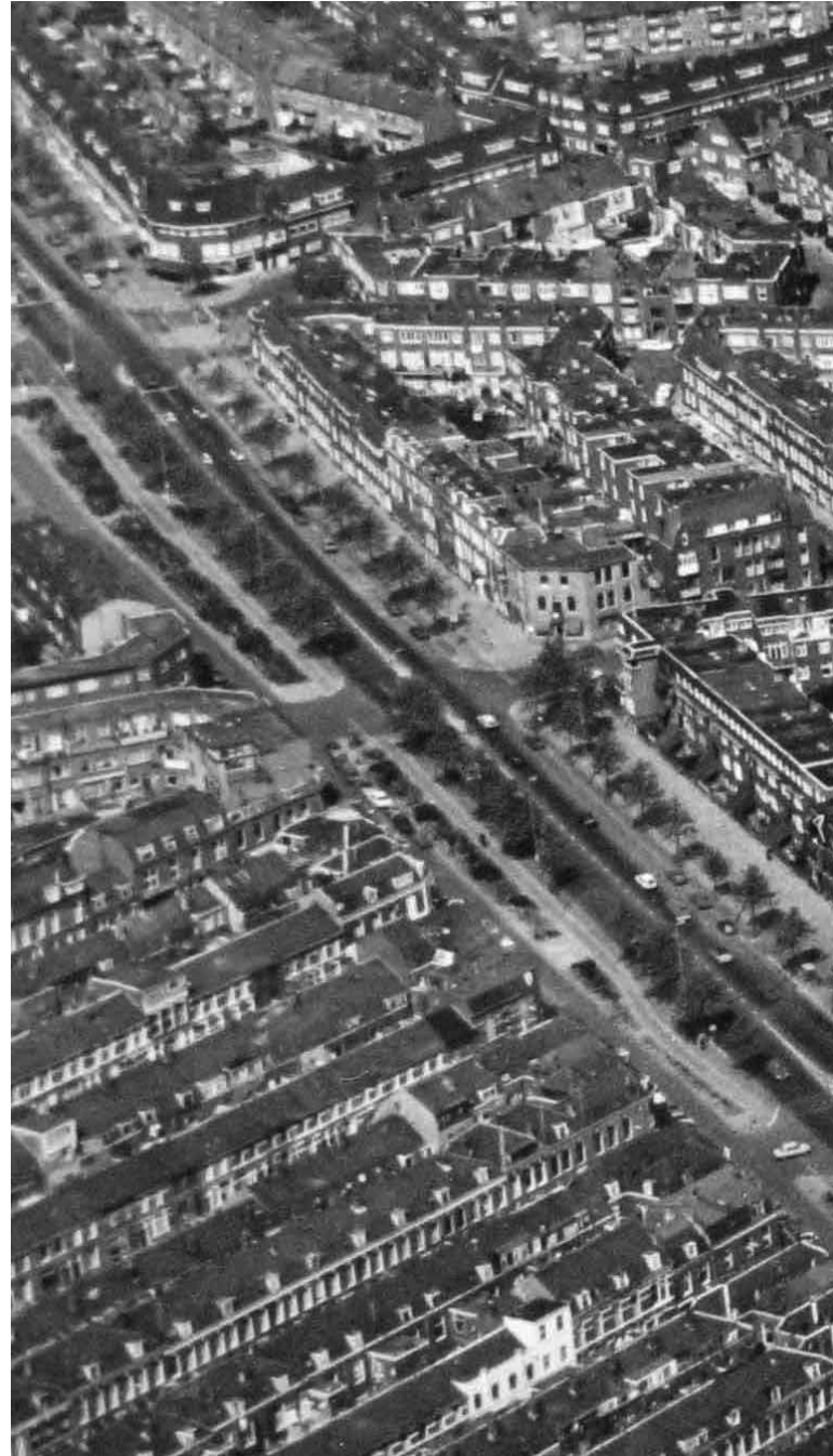
► Ca. 1985