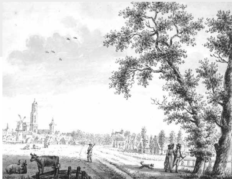
› Gezicht vanaf de herberg Jaffa, 1799

In 1865 maakt J. Kuypers een kaart van de gemeente Utrecht voor zijn bekende gemeentekaart. Hij brengt alle gemeenten in Nederland in kaart, een unieke momentopname van de bewoonde delen van Nederland. Het overgrote deel van de bebouwing in de gemeente Utrecht ligt dan nog binnen de singels. In het noorden staan langs de Vecht in Lauwrecht ook vrij veel huizen, net als in het zuiden langs de Vaartse Rijn. Verder zijn op Kuypers' plattegrond alleen losse gebouwen te zien: vrijstaande huizen, boerderijen en landhuizen langs de Maliebaan, de Bilstraat en andere oude uitvalswegen. De Vleutenseweg is ook zo'n oude uitvalsweg, een smalle weg die al zo'n achthonderd jaar langs de vaart naar het westelijk gelegen Vleuten loopt. Als we op de kaart de Vleutenseweg vanaf de spoorlijn volgen naar het westen, is het gebied aan de rechterkant onbebouwd. Waar nu de wijk Nieuw Engeland ligt grazen koeien. Het eerste gebouw dat we aan de rechterkant tegenkomen is het huis Jaffa, ter hoogte van het huidige Majellapark. Helemaal nauwkeurig is de kaart niet, er stonden ook wel wat kleinere huizen aan het begin van de Vleutenseweg. Kuypers'