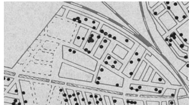
› Doden door TBC tussen 1912 en 1918

De Woningwet regelt ook dat er voortaan uitgewerkte plannen moeten komen voor nieuwe woonwijken. De gemeente kan bijvoorbeeld eerst een stratenplan maken en zo zorgen voor ruimer opgezette wijken. Ook gaan woningbouwverenigingen een rol spelen bij de volkshuisvesting door te zorgen voor goede en betaalbare huizen, bijvoorbeeld voor arbeiders. We zien dat terug in de ontwikkelingsgeschiedenis van Nieuw Engeland.