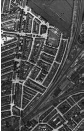
► Ca. 1930