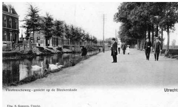
► Vleutenseweg tussen 1890 en 1905

Hoewel de stad dus pas na 1865 flink groeit, bestonden de plannen daarvoor al veel langer. Zo is er in 1664 het uitbreidingsplan van Hendrick Moreelse, hoogleraar en burgemeester. Hij maakt een gedetailleerd plan met kaarten waarop aan de westkant van de stad tal van nieuwe grachten te zien zijn. Het doet denken aan de Amsterdamse grachtengordel, onderdeel van een vergelijkbaar uitbreidingsplan. In Utrecht blijft het bij plannen. Pas in 1824 volgt een belangrijke stap op weg naar groei: de stadswallen en muren worden gesloopt. De oude verdedigingswerken hebben na zevenhonderd jaar trouwe dienst geen militaire functie meer. Langs de singels worden de parken aangelegd, die nu nog altijd het aanzicht van de binnenstad bepalen. Ter verdediging van de stad zijn aan de oostkant forten gebouwd die