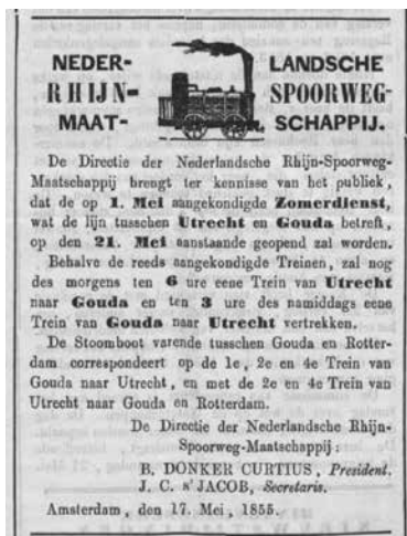
► Advertentie bij opening van de spoorlijn, 1855