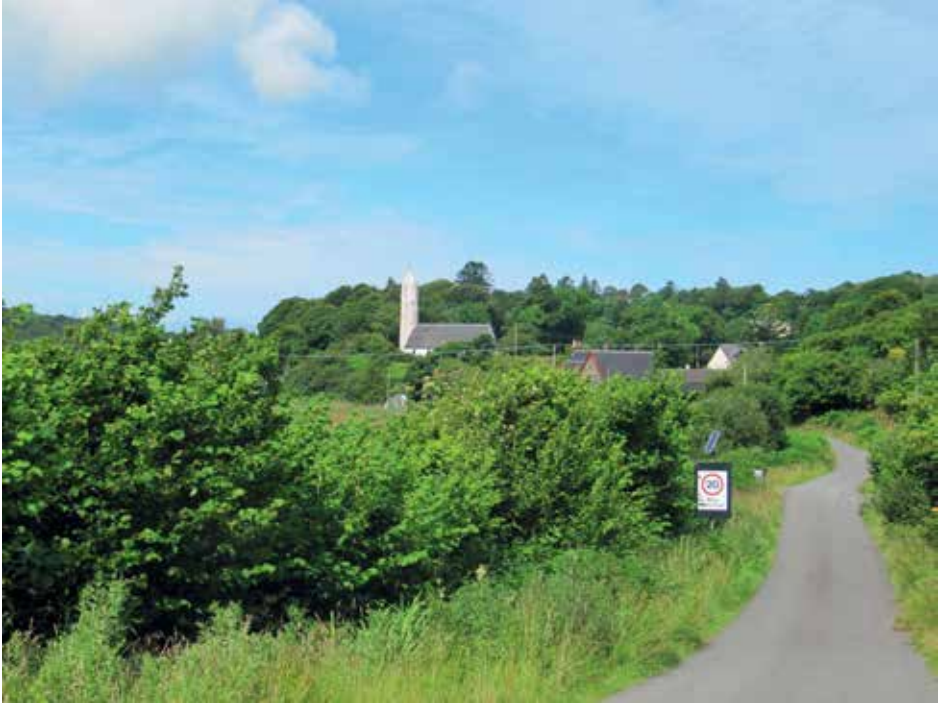
Afb. 2 Kilmore Church in een verlaten streek, Dervaig, the Isle of Mull, Schotland. De toren is typerend voor het Ierse Keltische christendom.

Het bleek – zo stond in een plaatselijk boekje over Kilmore Church – dat deze kerk verbonden was met het Schotse eiland Iona en dat het plaatsje Dervaig vroeger schatplichtig was aan de grote abdij van Iona. Dat gaf me direct een reden om diezelfde week nog af te reizen naar Iona, waar ik in het museum een fascinerende ontdekking deed.