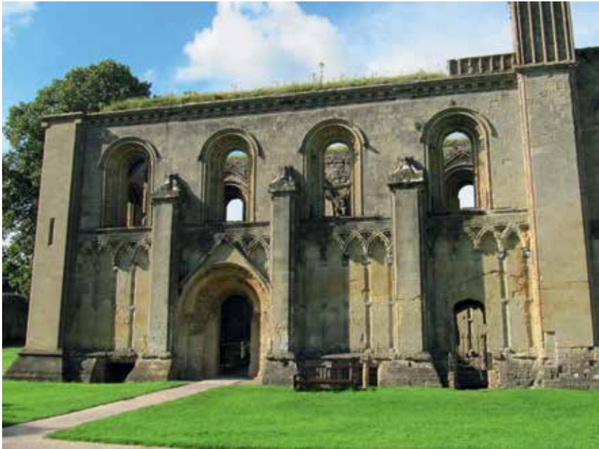
Afb. 4 De Lady's Chapel, Glastonbury, eigen foto 2017.

Maar er is meer: 2018 vraagt dringend om een nieuwe kijkrichting – of moet ik zeggen: ‘voelrichting’ –, want het wordt tijd dat we de wijsheid van het hart serieus gaan nemen. De wetenschap heeft recentelijk aangetoond dat het hart eerder op een situatie reageert dan de hersenen en dat het hart ook meer signalen stuurt naar de hersenen dan andersom. Het hart heeft een heel eigen intelligentie en een heel eigen zenuwstelsel.