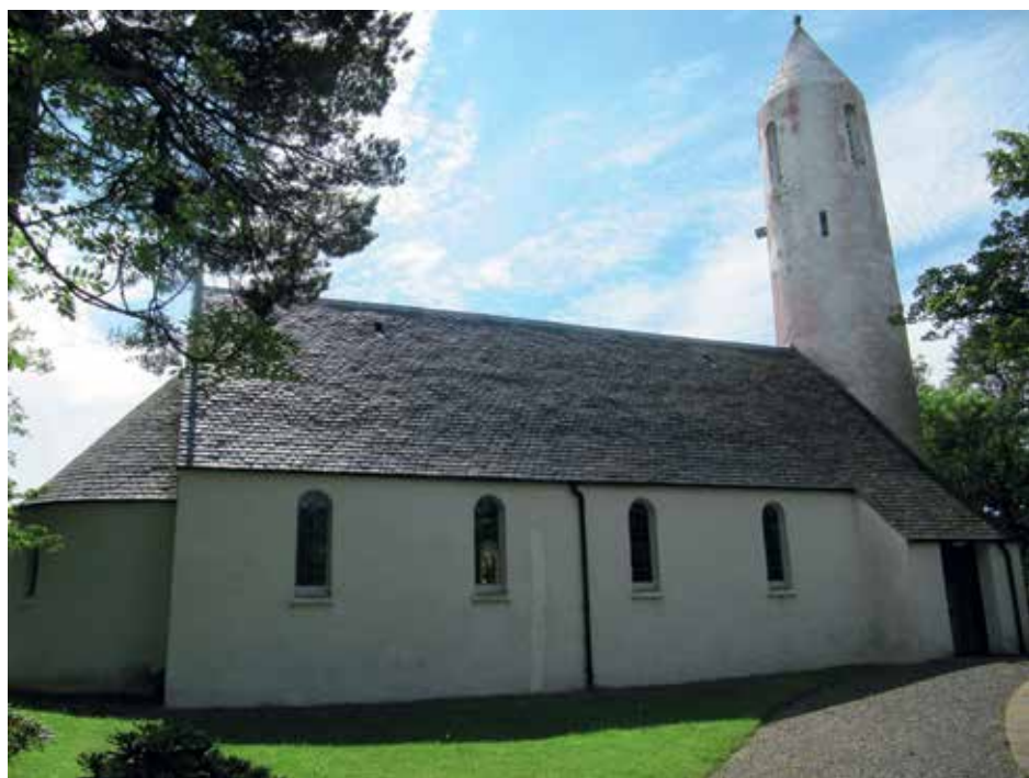
Afb. 3 Kilmore Church, Dervaig, the Isle of Mull, Schotland.

Jezus en haar reis naar Zuid-Frankrijk en later naar Noord-Spanje. In 2016 verscheen Maria Magdalena uit de verf – een boek waarin ik 40 schilderijen over Maria Magdalena beschrijf bij de grote meesters van de Renaissance en bij de Vlaamse Primitieven.