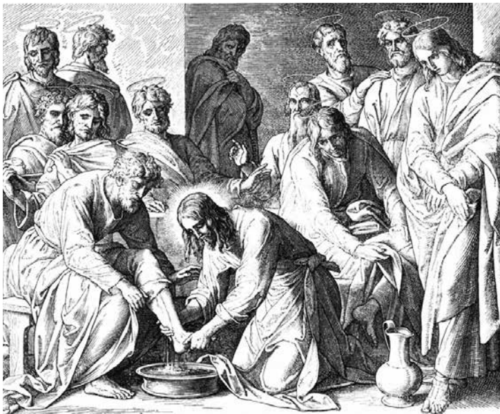
Afb. 5 Jezus wast Petrus' voeten, Julius Schnorr von Carolsfeld (1794-1872).

Jezus verrichtte veel daden. Hij genas zieken, melaatsen en blinden; hij zat aan tafel met tollenaars en zondaars, bestreed de handelaars die in de grote Tempel van Jeruzalem geld probeerden te verdienen en sprak met en over de vrouw als gelijkwaardige. Hij kleepte zich eenvoudig en at geen vlees. Hij beledigde nooit iemand persoonlijk, maar spiegelde diens daden en sprak in gelijkenissen om duidelijk te maken wat hij bedoelde en wat de ander zou kunnen inzien. Hij gaf de ander volledig de vrijheid om de verantwoordelijkheid van zijn of haar daden zelf te dragen: ‘Wie zonder zonden is, werpe de eerste steen.’