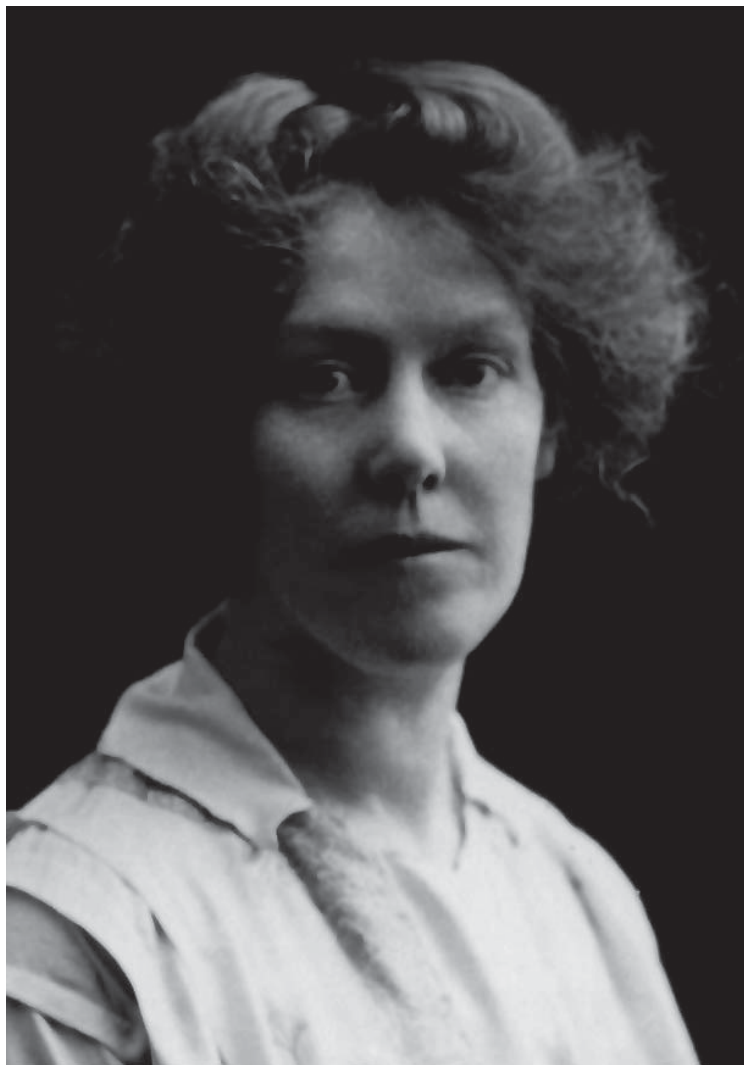
Edith Maryon - 1912