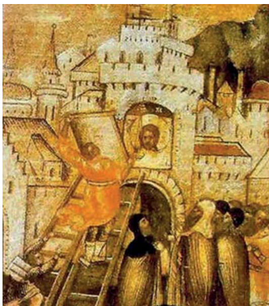
Plaat 6 De Lijkwade, verborgen in de Kappapoort van Edessa, schildering. In de muur boven de stadspoort werd bij de grote overstroming van 523 de Lijkwade gevonden.