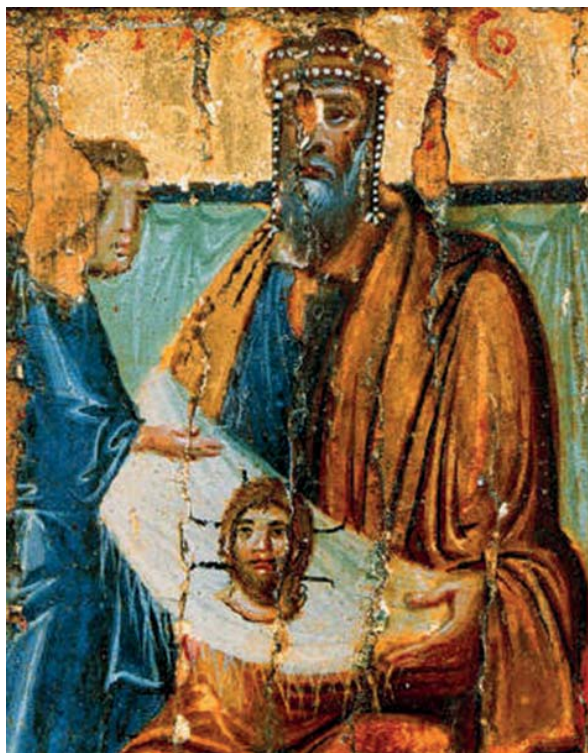
Plaat 5 Koning Abgar V van Edessa krijgt de doek van Thaddeus, een van de leerlingen van Jezus (schildering uit de tiende eeuw). Het is de Lijkwade in acht gelijke delen gevouwen en zo gepresenteerd dat alleen het gezicht van Jezus zichtbaar is. Deze koning wordt ook wel 'de Zwarte' genoemd.