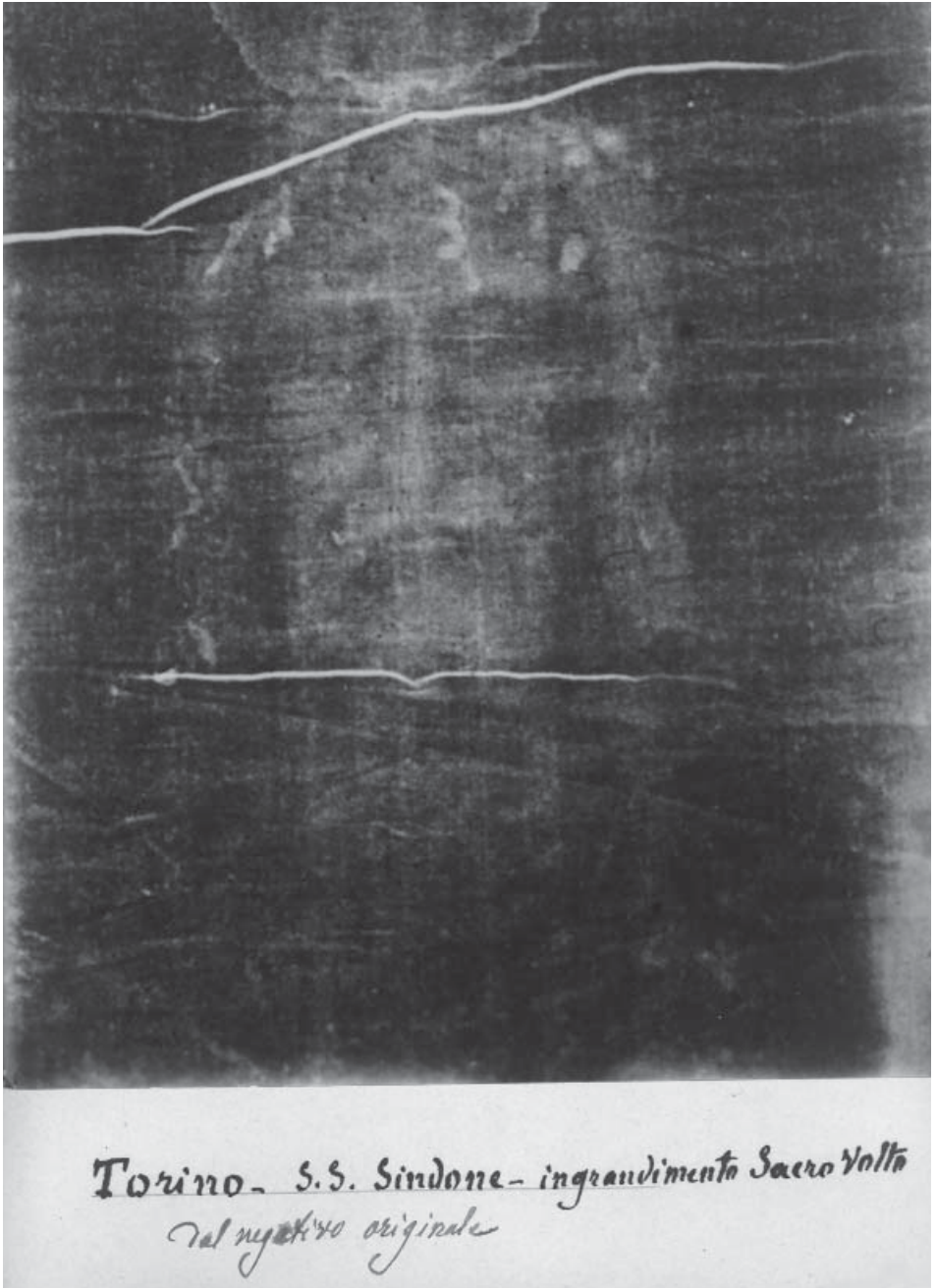
Afb. 1 Het gezicht van Jezus op de fotografische plaat van Secondo Pia.