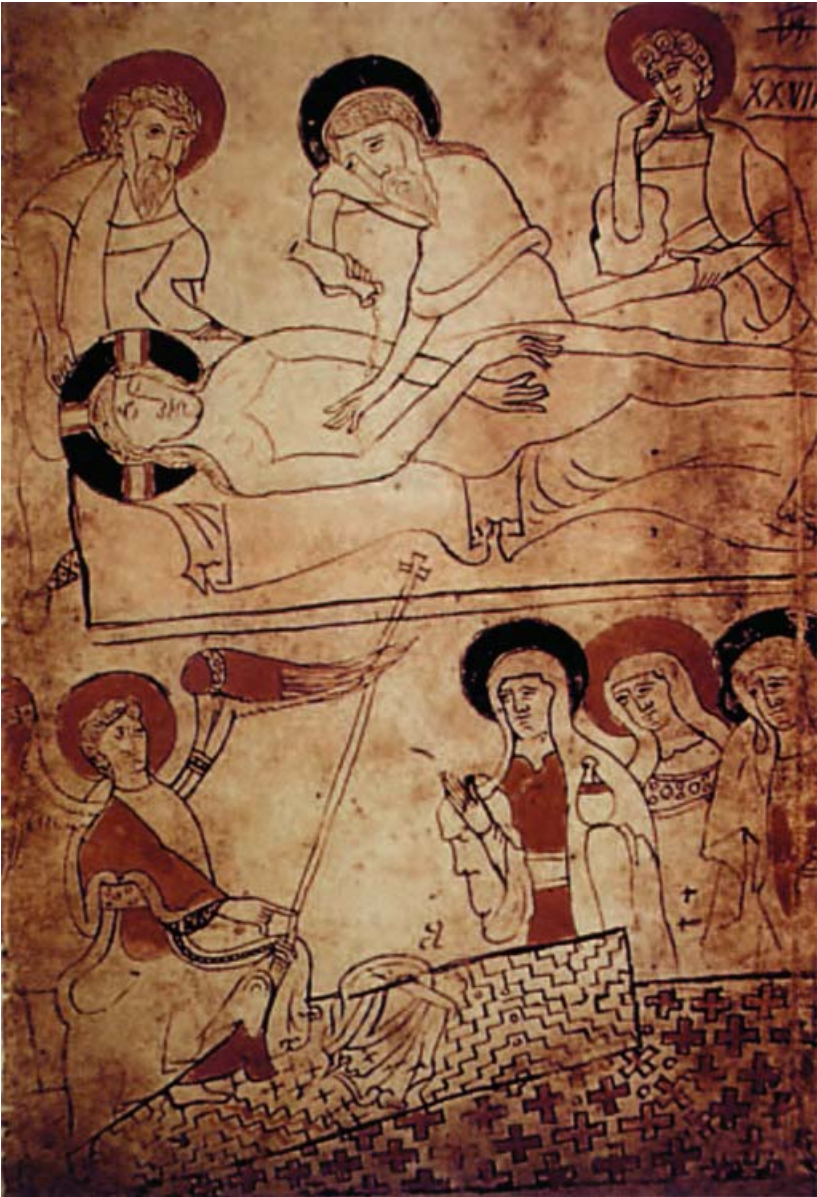
Plaat 12 De Lijkwade, illustratie in de Pray Codex, ca. 1192. Hier zijn de vier kenmerkende gaatjes van de Lijkwade te zien op de tekening (drie op een rij en een los daarvan). Deze tekening verwijst naar de echte Lijkwade, die eveneens exact deze vier gaten had. De Codex is geschreven tussen 1192 en 1195. De koolstofdatering wees zogenaamd uit dat de doek niet ouder kon zijn dan 1290 na Christus.