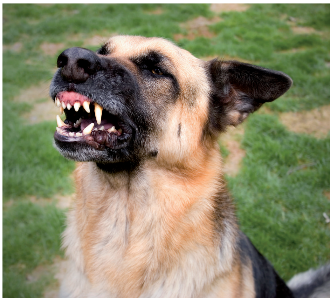
Als de hond weinig keuzes heeft, kan hij zijn toevlucht nemen tot agressie.

Een hond zal altijd de strategie kiezen die tot dan toe gewerkt heeft, zoals blaffen. We kunnen wachten tot hij gaat blaffen en hem dan corrigeren. Dat is wat veel mensen jarenlang hebben gedaan. Gedragsanalisten hebben inmiddels meer dan een halve eeuw onderzoek gedaan naar bekrachtiging, en we zijn nu veel verstandiger. Een goede skileraar leert een kind niet skiën door hem meteen van de top van de berg te laten skiën en hem dan te straffen als hij iets verkeerd doet. Een goede leraar creëert een situatie waarbij de leerling maximaal succes kan behalen, zodat via bekrachtiging sterke gedragspatronen worden ontwikkeld. Als je de hond vaak een grote kans op succes biedt, kan hij veel oefenen en tegemoetkomen aan zijn eigen behoeftes door middel van gedrag dat je graag ziet. Een win-winsituatie.