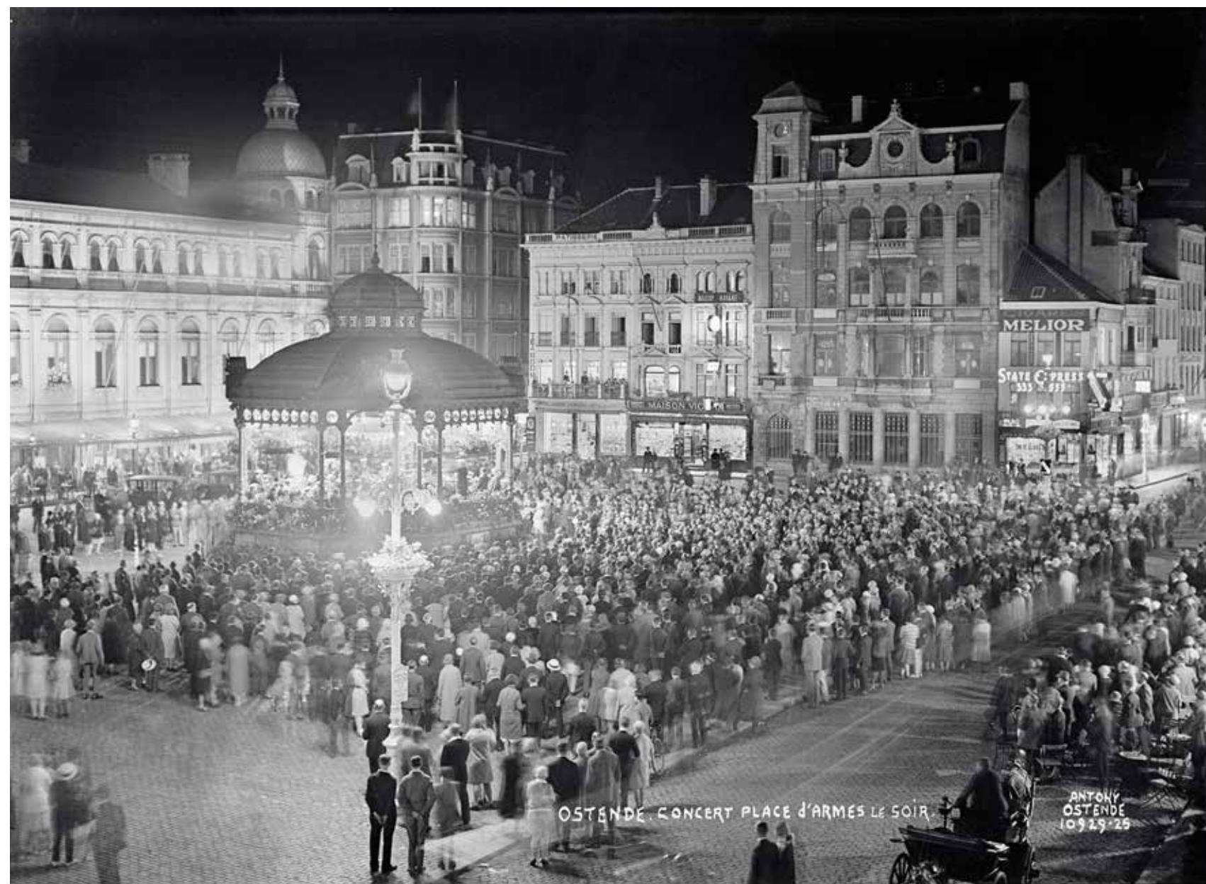
Avondconcert op de verlichte kiosk op het Wapenplein, 1 september 1929