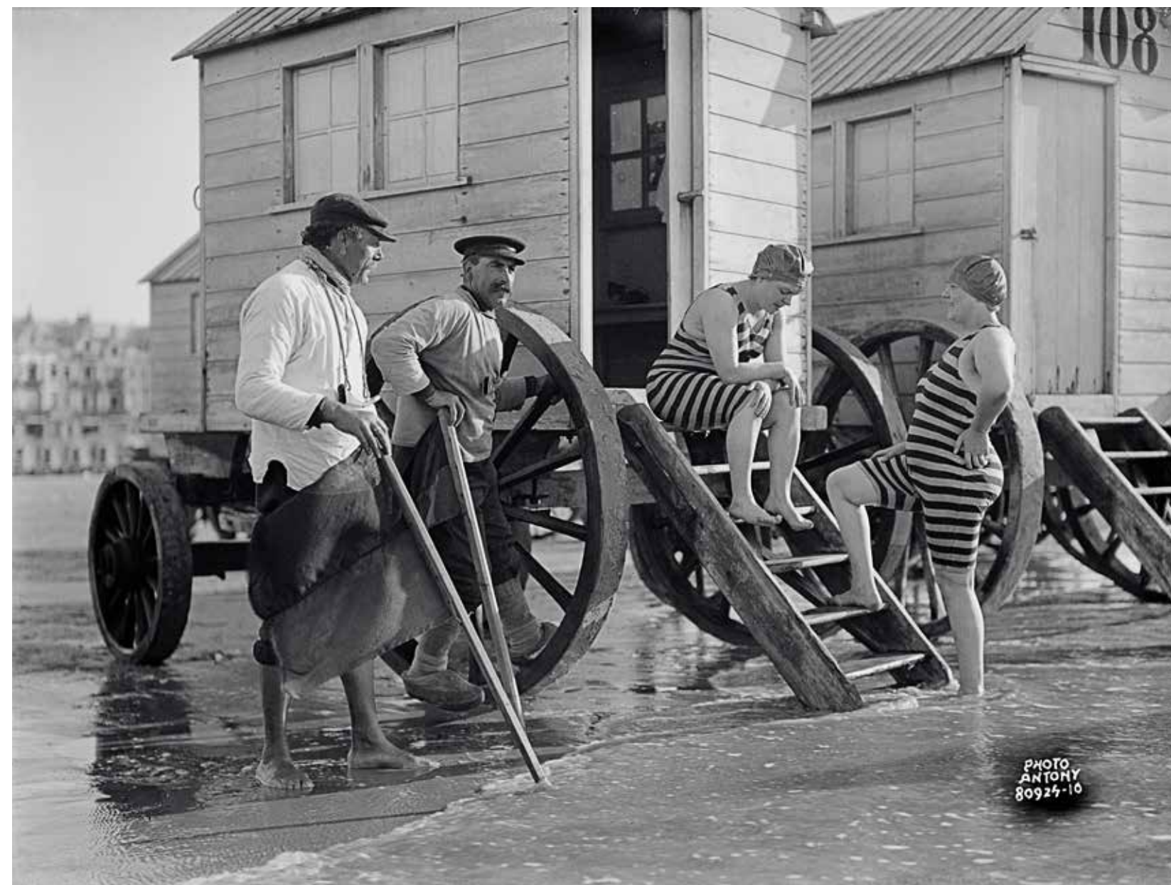
Baadsters en redders met vlag naast de typische Oostendse badkarren aan de waterlijn, 8 september 1924