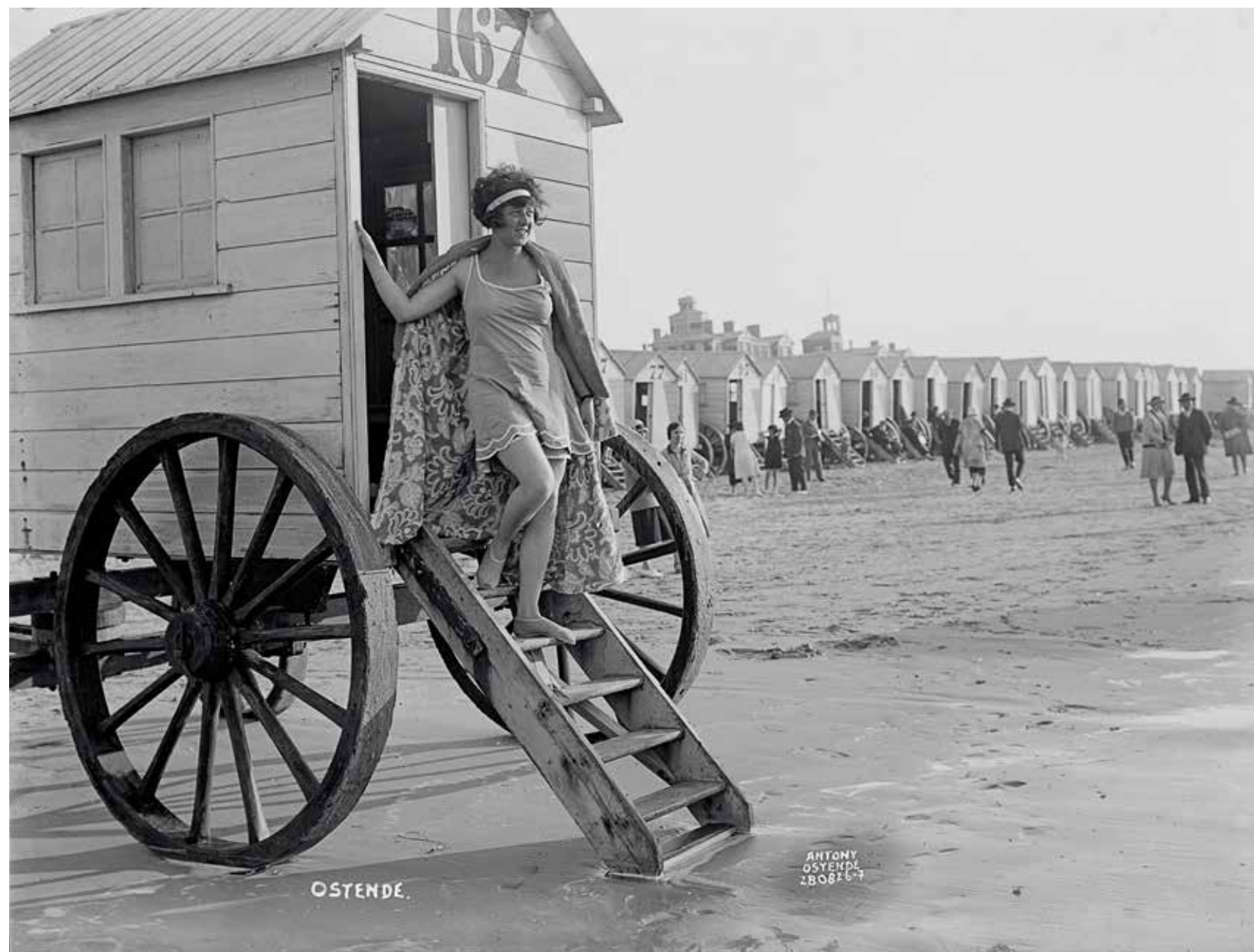
Baadster poserend op de trap van een badkar aan de waterlijn. Op de achtergrond is het Koninklijk Chalet te zien, 28 augustus 1926