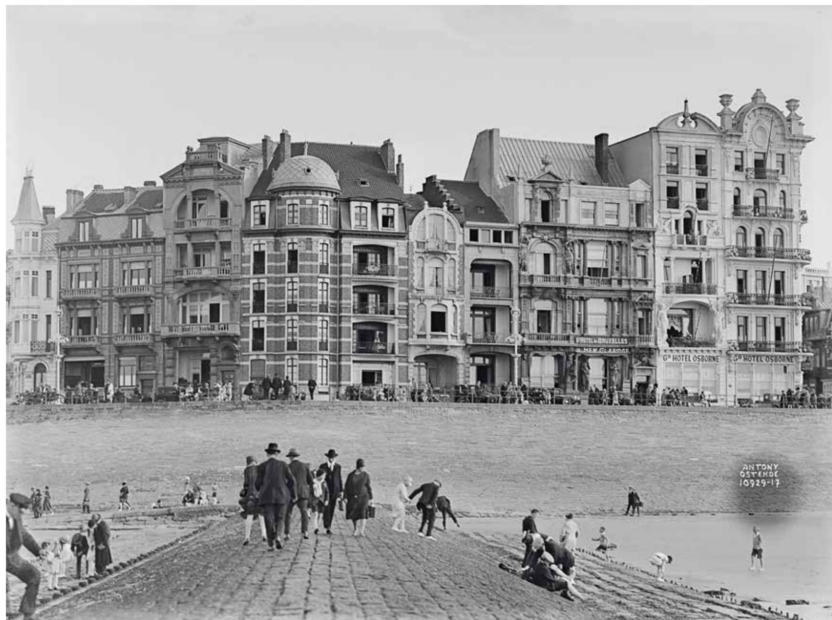
Zicht op de oostelijke Zeedijk, met het Hôtel de Bruxelles & New Claridge en het Grand Hôtel Osborne, 1 september 1929