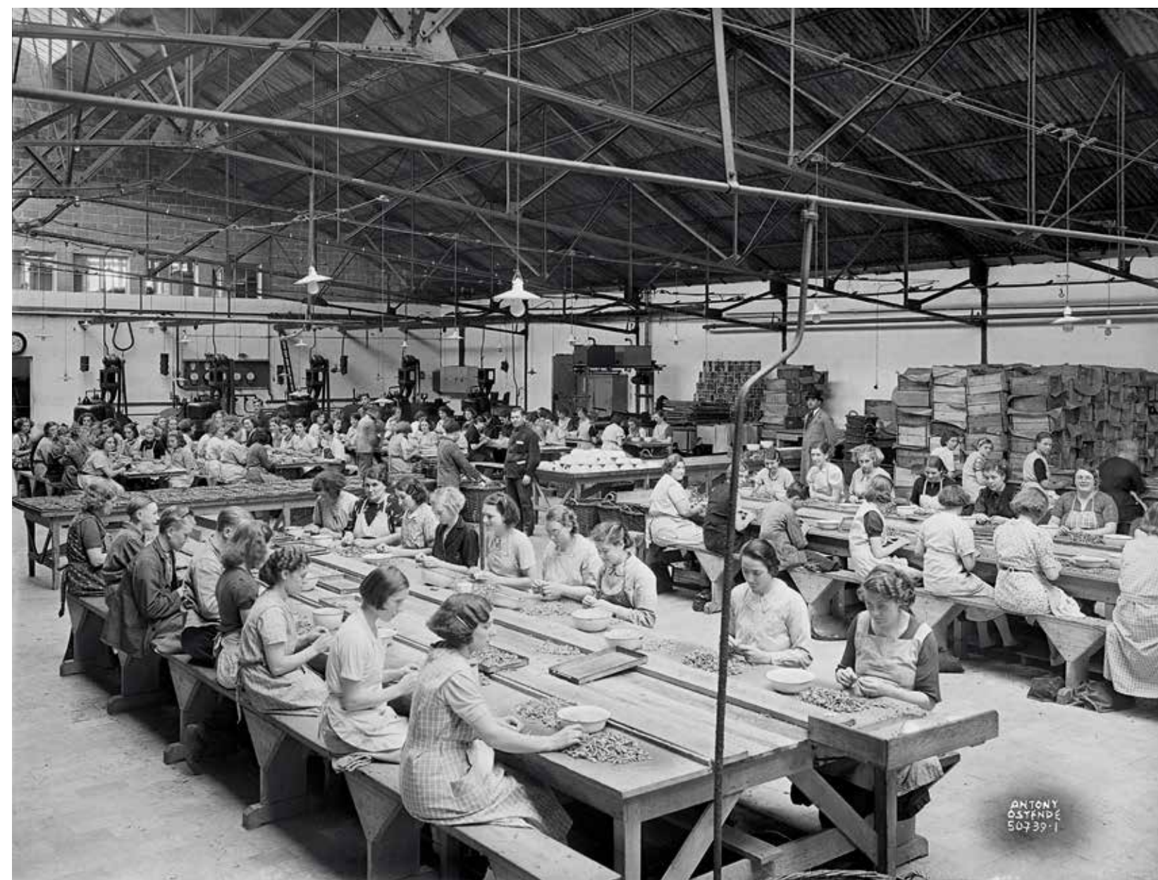
Garnalen pellen in de Ostendia-loods. Dit was vooral een job uitgeoefend door jonge vrouwen en meisjes, maar er zijn ook enkele jongens te zien, 5 juli 1939