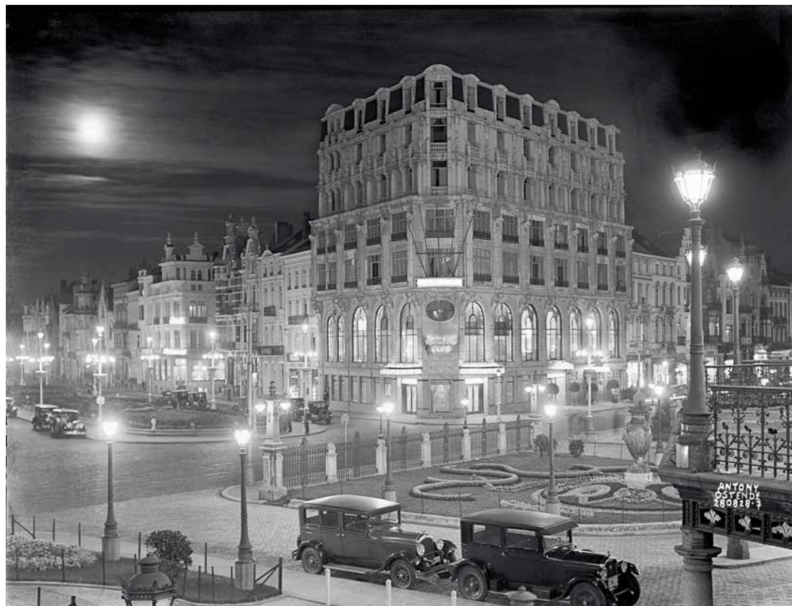
Avondzicht op de hoek van de huidige Leopold II-laan en de Van Iseghemlaan. Foto genomen ter hoogte van de zijkant van het Kursaal, 28 juli 1928