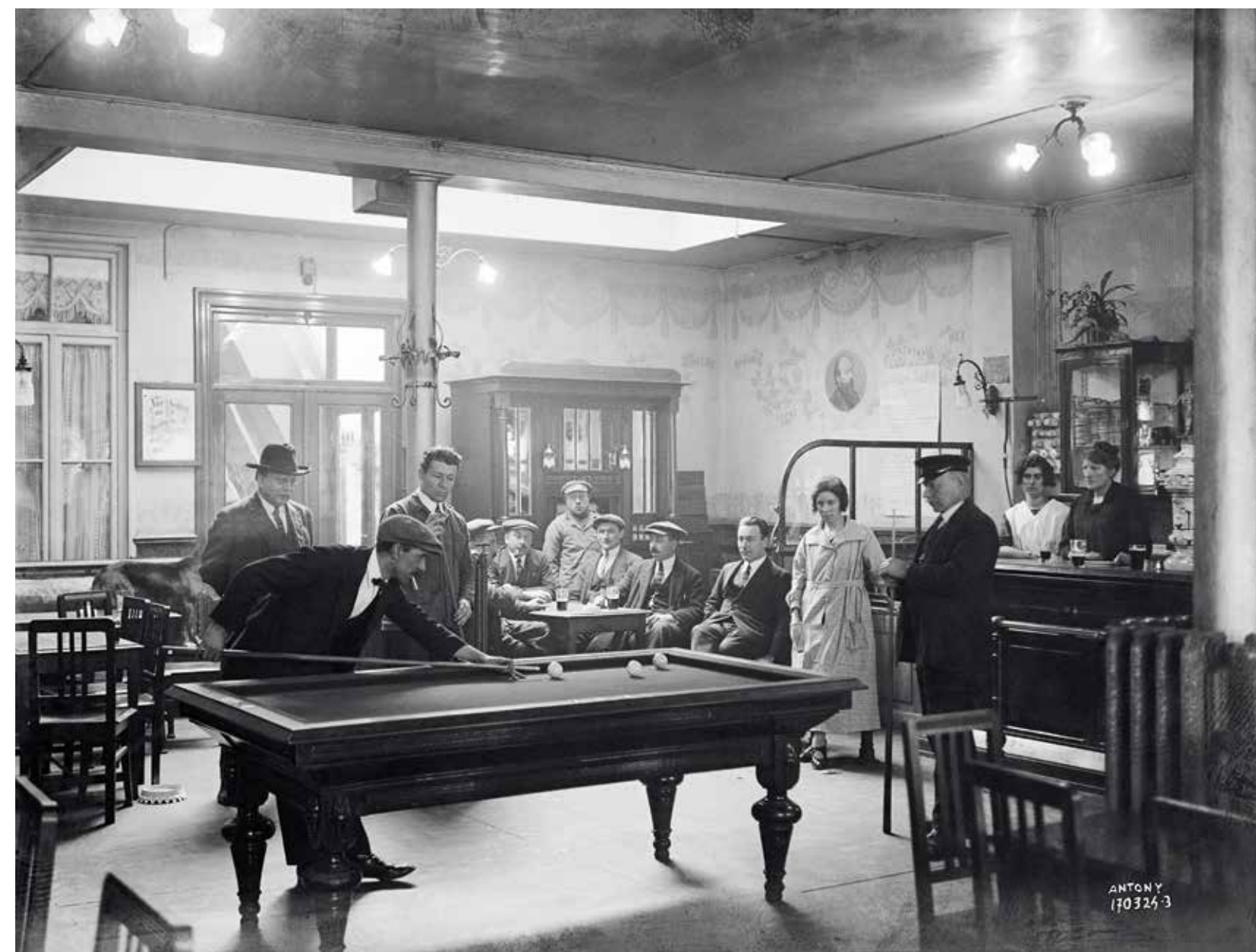
Biljartspeel in het socialistische Volkshuis Noordstar, 17 maart 1924