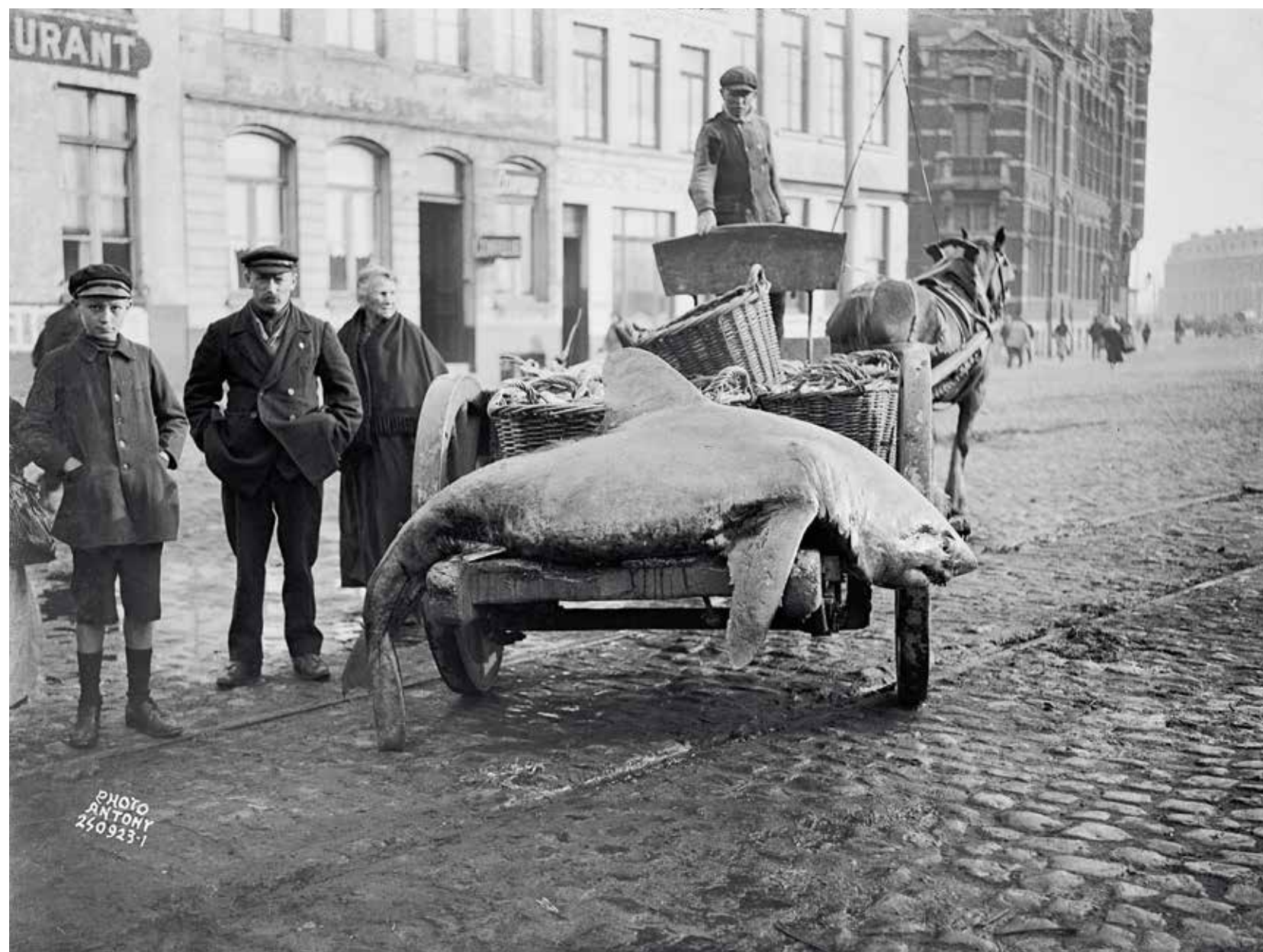
Een paard trekt een kar met visbennen en een grote haaiachtige op de Vindictivelaan tussen de Dekenijstraat en de Zuidstraat, 24 september 1923