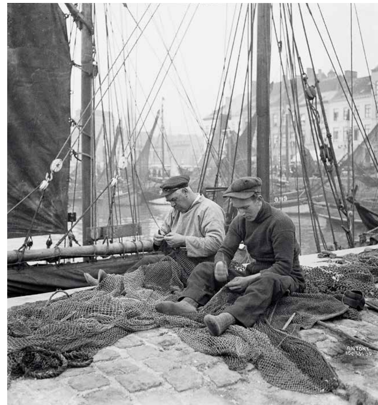
Twee vissers herstellen netten aan wal, 10 juli 1934