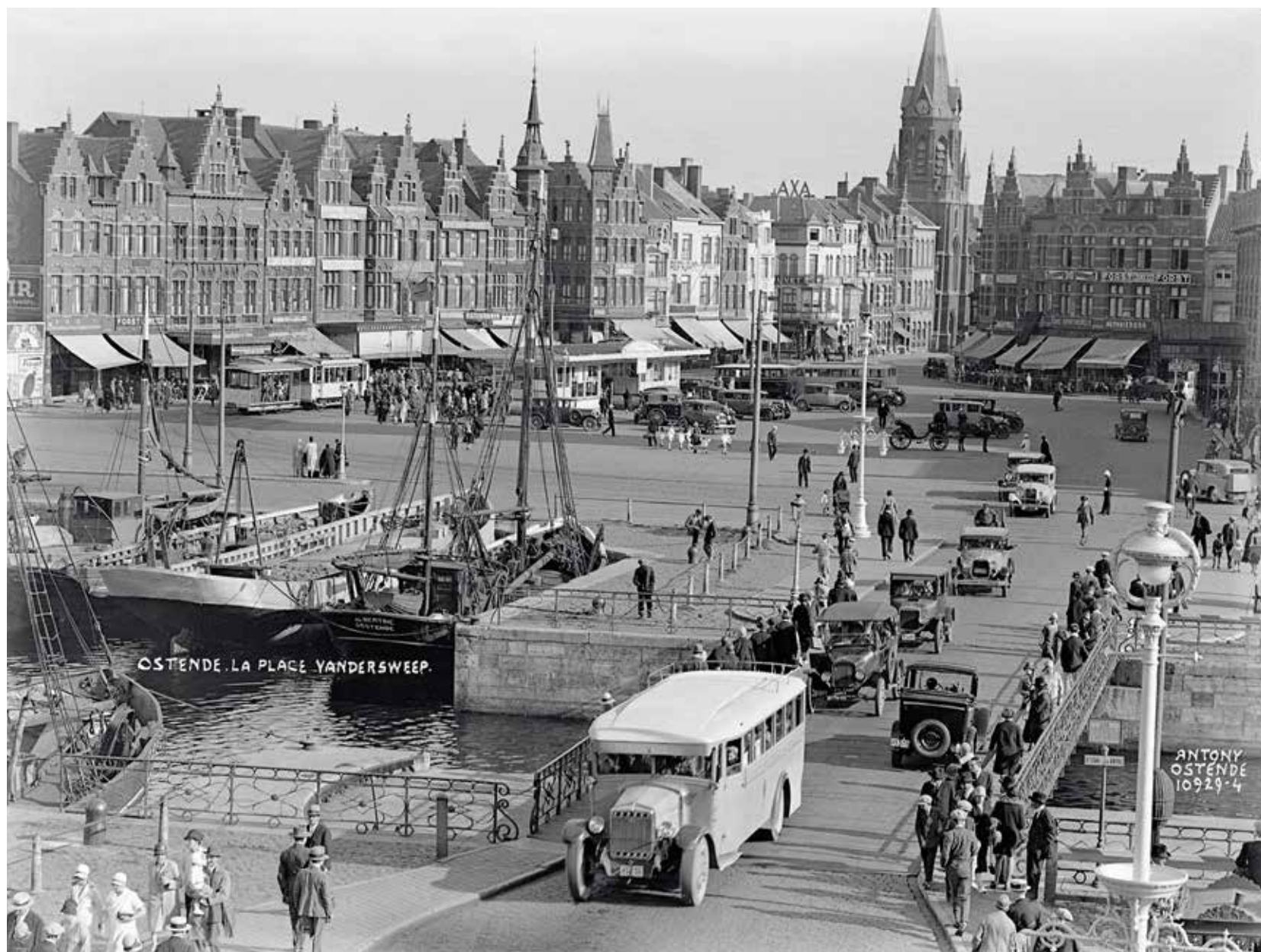
Zicht op het Vandersweepplein (het huidige Ernest Feysplein), met op de voorgrond de Kapellebrug en achteraan de kerk van Hazegras (afgebroken in 1995), 1 september 1929