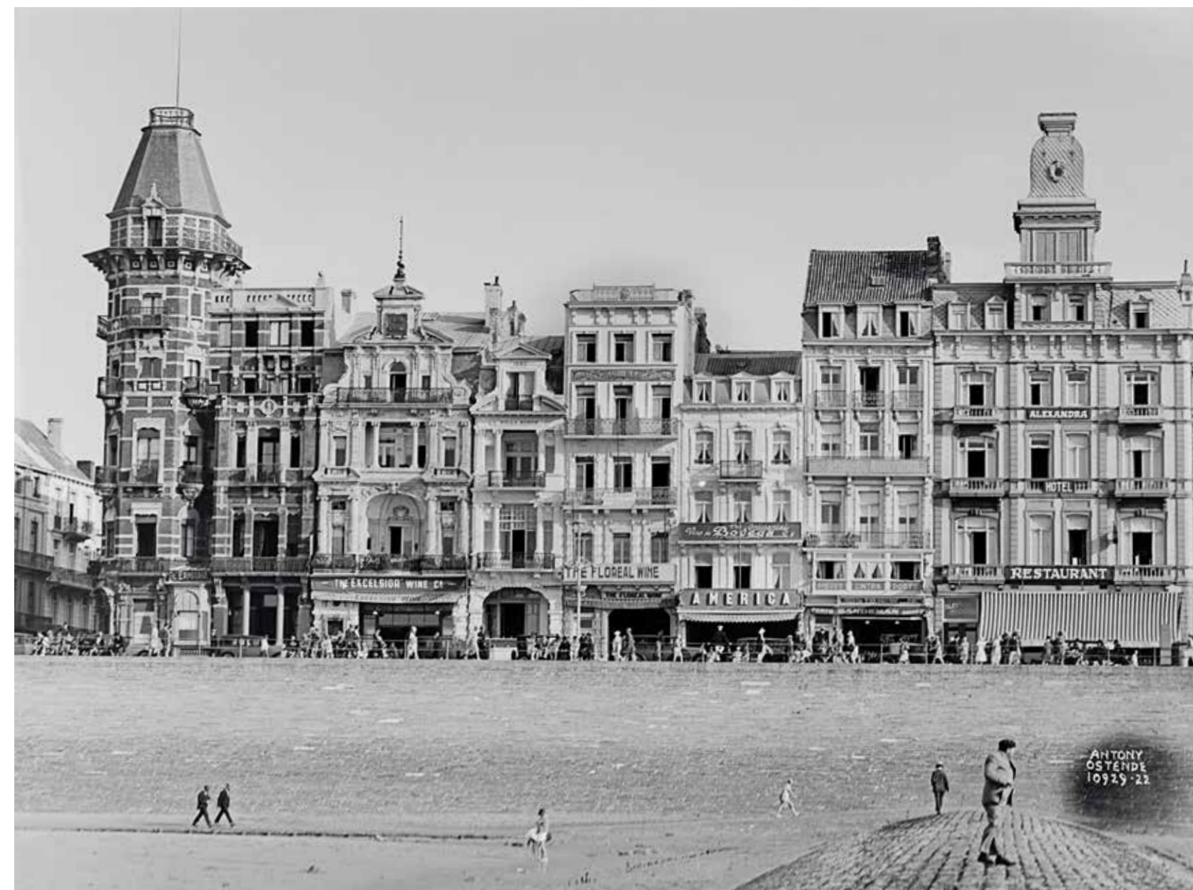
Zicht op de villa's en hotels op de oostelijke Zeedijk, tussen de Christinastraat (links) en de Hertstraat (rechts), 1 september 1929