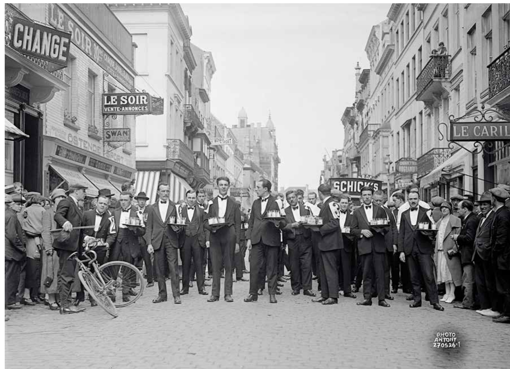
Plateaukoers voor obers met volle glazen in de Adolf Buylstraat, 27 mei 1926