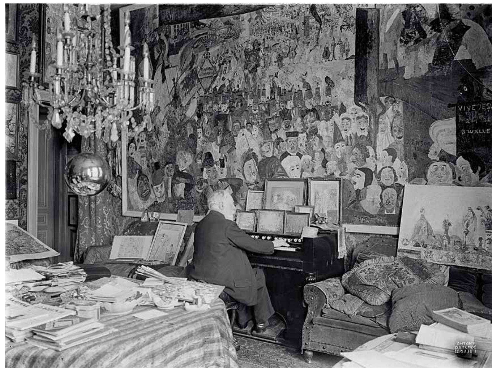
James Ensor aan zijn harmonium in het Blauwe Salon voor het schilderij De Intrede van Christus in Brussel , 28 juli 1933