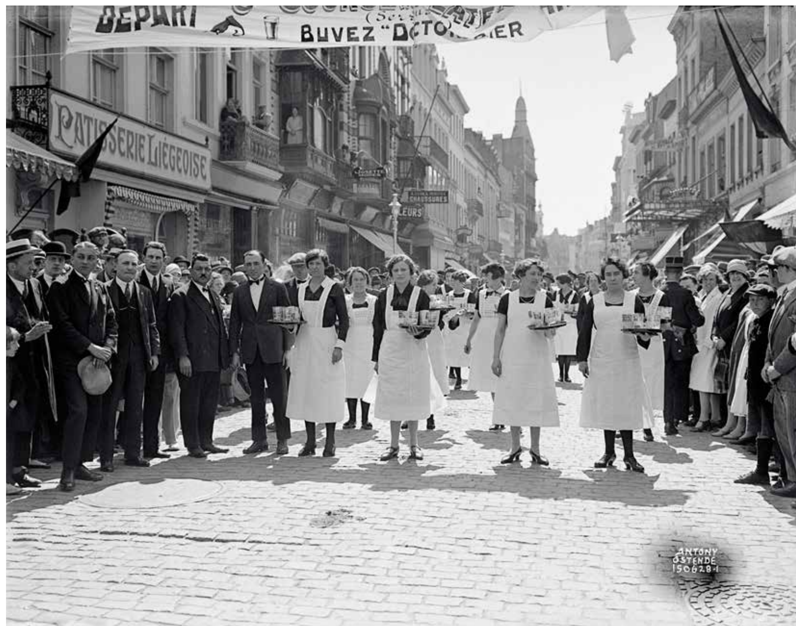
Plateaukoers voor vrouwen in de Adolf Buylstraat. Een twaalfstal serveersters staan met volle plateaus klaar voor de start, 15 juni 1928