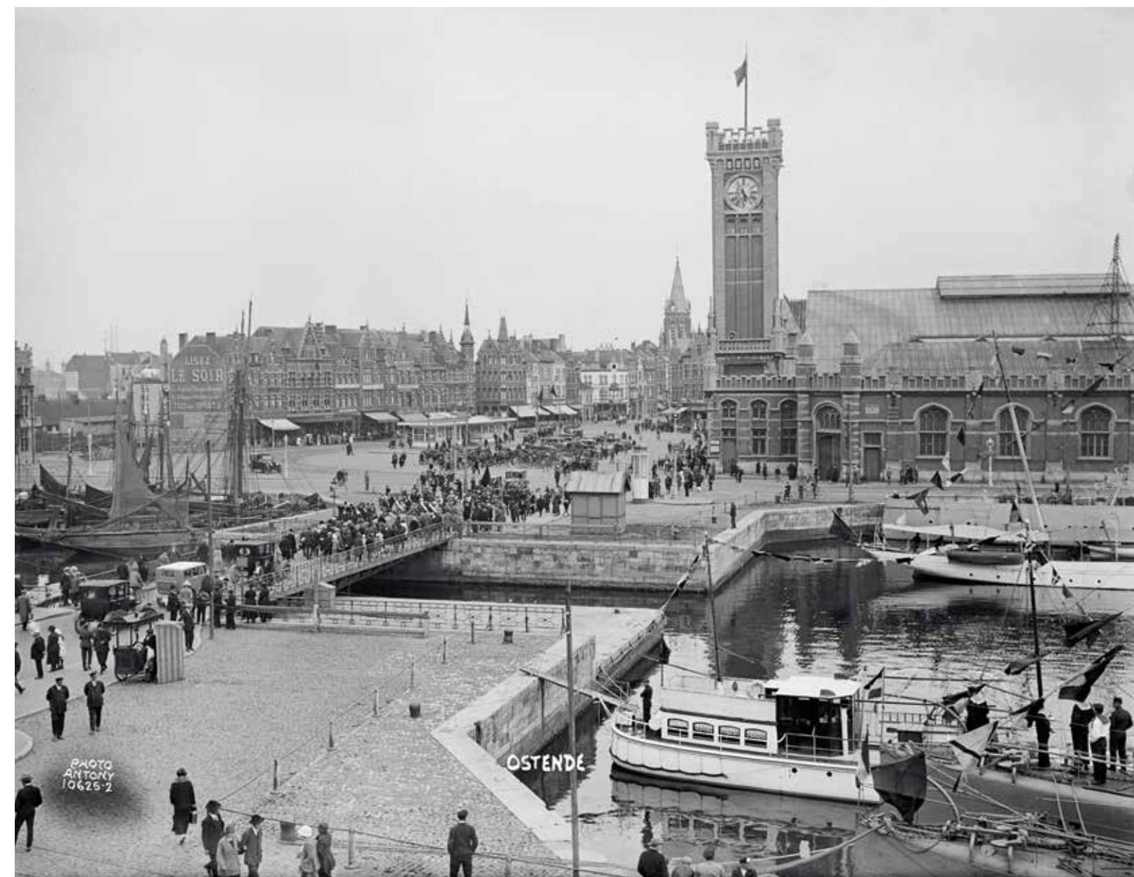
Zicht op het Tweede Handelsdok, de Kapellebrug, het oude station en de Hazegraswijk, 1 juni 1925