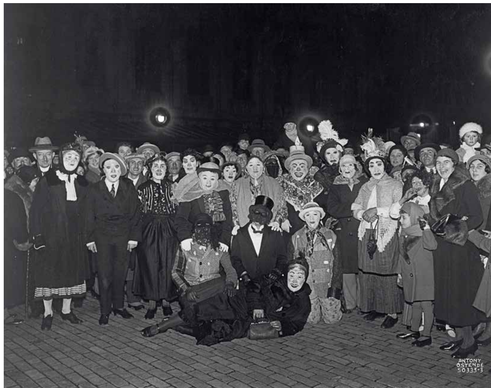
Een groep carnavalisten met typisch Ensoriaanse maskers, 5 maart 1933