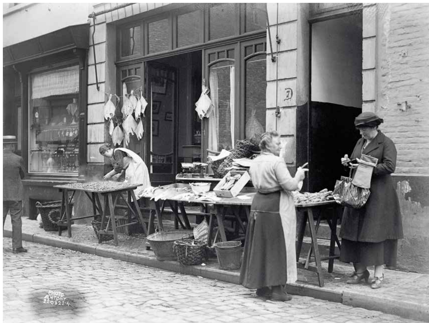
Visstalletjes voor een huis. De droogvis hangt buiten voor het uitstalraam. Op de tafel links op het voetpad zie je dampende garnalen, 22 augustus 1922