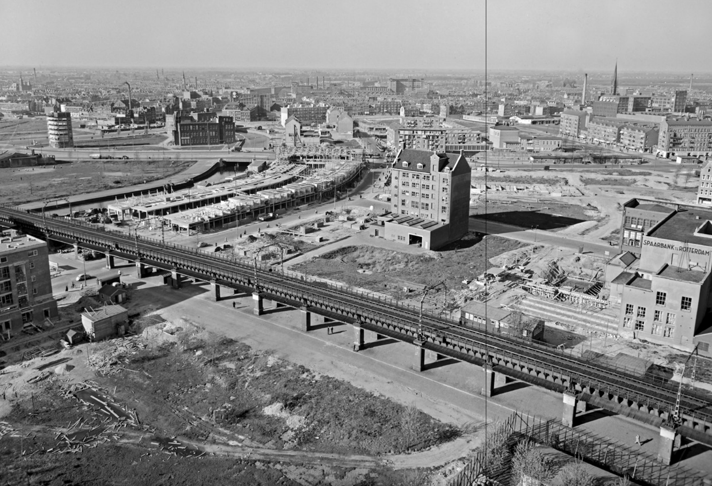
Het Luchtspoor vanaf de Laurenstoren, 1953