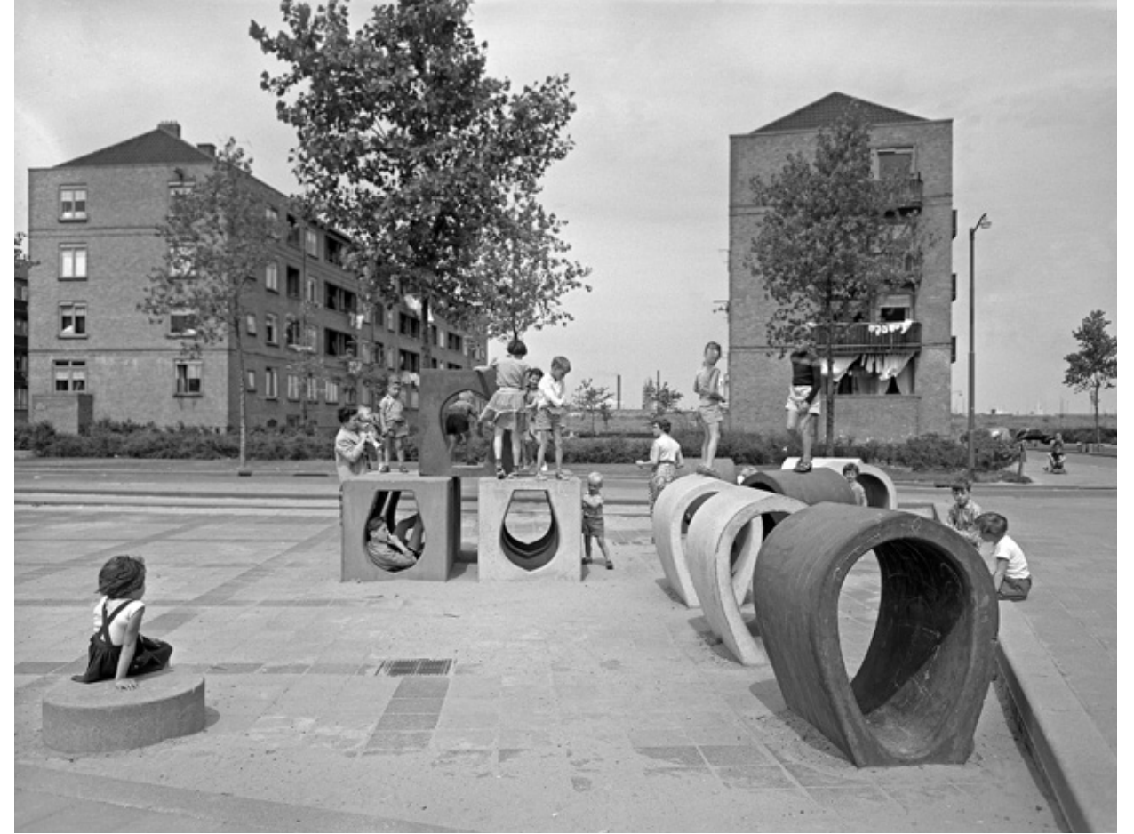
Oldegaarde, 1962 | Bakoestraat, 1958