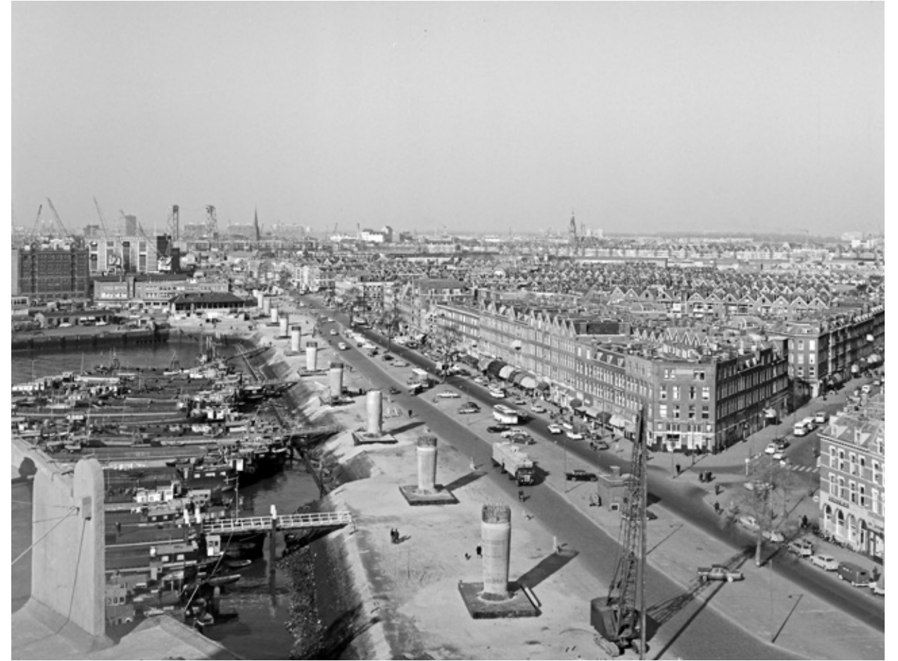
Bouw Metrostation Maashaven, Brielselaan, 1965 | Aanleg metroviaduct, Maashaven Oostzijde, 1965