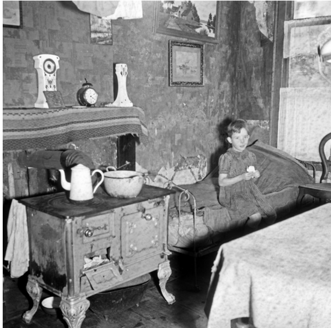
Frederikspad, 1946 / Hendrikstraat, 1946