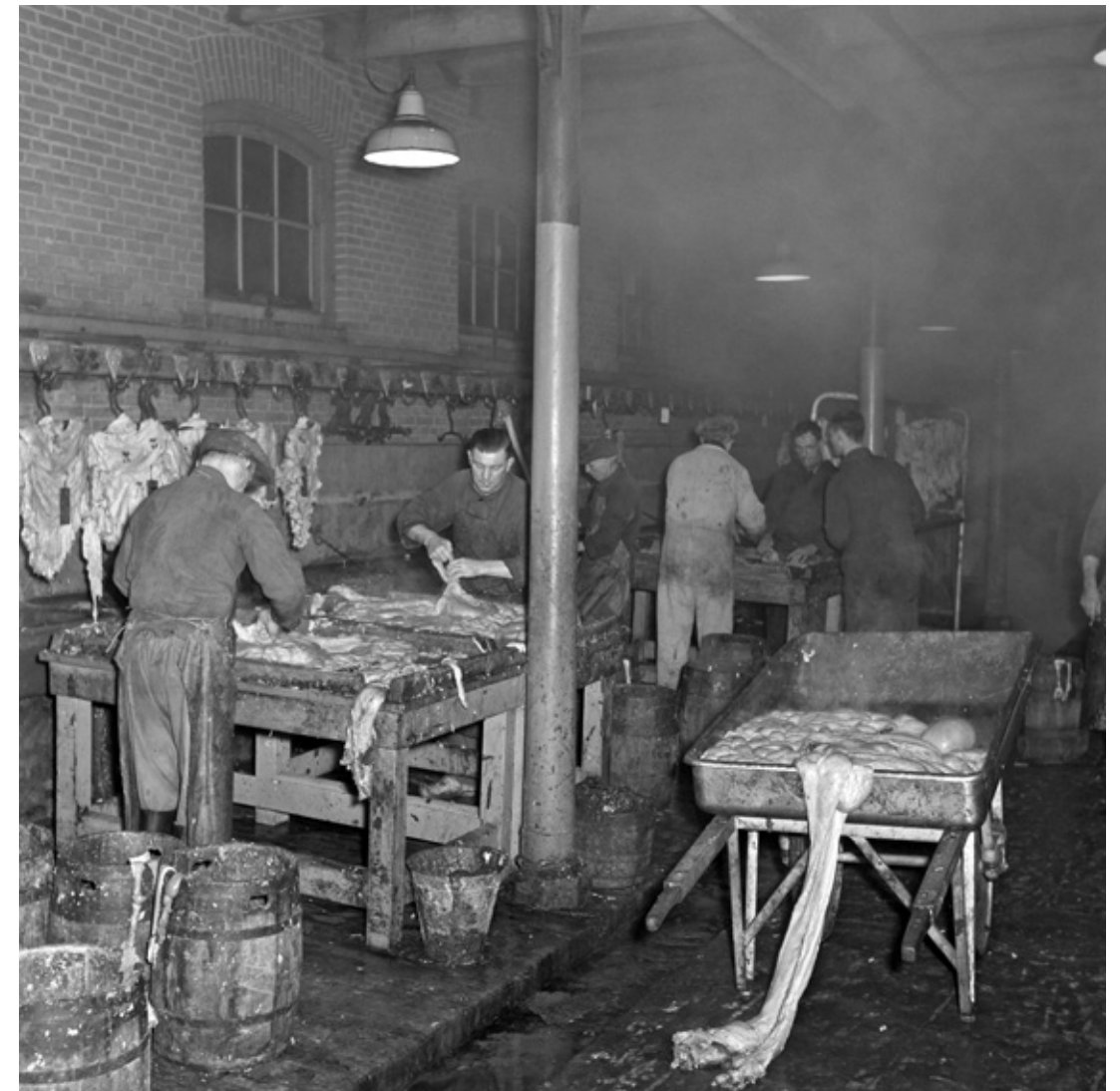
Openbaar Slachthuis, Boezemstraat, 1951