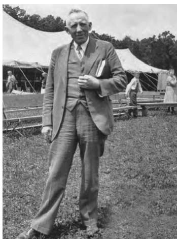
Charles S. Price voor een evangelisatie-tent in Lancaster, Pennsylvania (ca. 1930).

Price heeft gedurende de laatste vijftig jaar van zijn leven campagnes gehouden op vele plaatsen in Amerika en Canada, en in Europese landen als Zweden, Noorwegen, Italië en Engeland. Hij kwam ook in Egypte, Israël, Turkije, Syrië en Libanon - een unicum in zijn tijd.