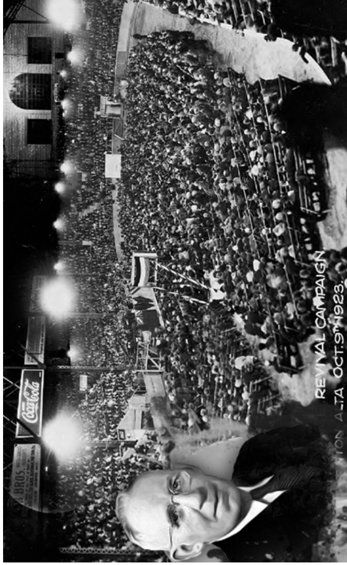
'Charles S. Price Revival Campaign' in ijs hockey stadium in Edmonton, Alberta (1923). Nadat de deuren waren gesloten omdat alle 12.000 zitplaatsen bezet waren, sloegen mensen ramen in om toch nog binnen te komen.