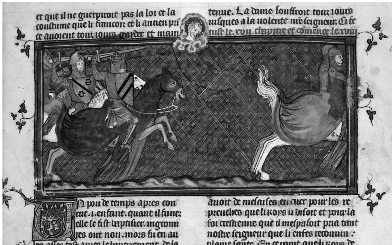
De tot het christendom bekeerde Frankische Koning Clovis (466-511) verslaat de Alemannen.

De Middeleeuwen werden voorafgegaan door de Grote Volksverhuizingen in de 5 e eeuw. De Hunnen, een nomadisch ruitervolk uit Centraal- Azië, plunderden zich een weg naar het westen en dreven op die manier andere Germaanse volkeren voor zich uit. Europa werd bezet door deze Germaanse stammen wat leidde tot de ineenstorting van het West- Romeinse Rijk in 476 na Christus, waardoor het centrale gezag wegviel in Europa. Rond 500 verenigde de Frankische koning Clovis (466-511) Noordwest-Europa tot één rijk: het Merovingische Rijk. Zijn legermacht bestond vooral uit zwaarbewapende ruiters (cavalerie) die beschikten over een maliënkolder, zwaard, schild, werpspies en een paard. Zo'n wapenuitrusting was kostbaar en moest de ruiter zelf betalen. Daarom schonk Clovis zijn krijgslieden na elke overwinning een deel van de buit, zodat zij hun uitrusting konden onderhouden. Op die manier zorgde Clovis er ook voor dat ze hem bleven steunen. De Frankische overheersers deelden niet alleen geld en edelmetalen (goud, zilver) uit, maar ook land, kastelen, boerderijen of bepaalde rechten, zoals het jachtrecht, visrecht, tolheffing, delven van kolen en molendwang (het recht van een heer om te eisen dat zijn onderdanen hun graan lieten malen op zijn molen). De beste baantjes gaf de heer weg aan zijn trouwste onderdanen.