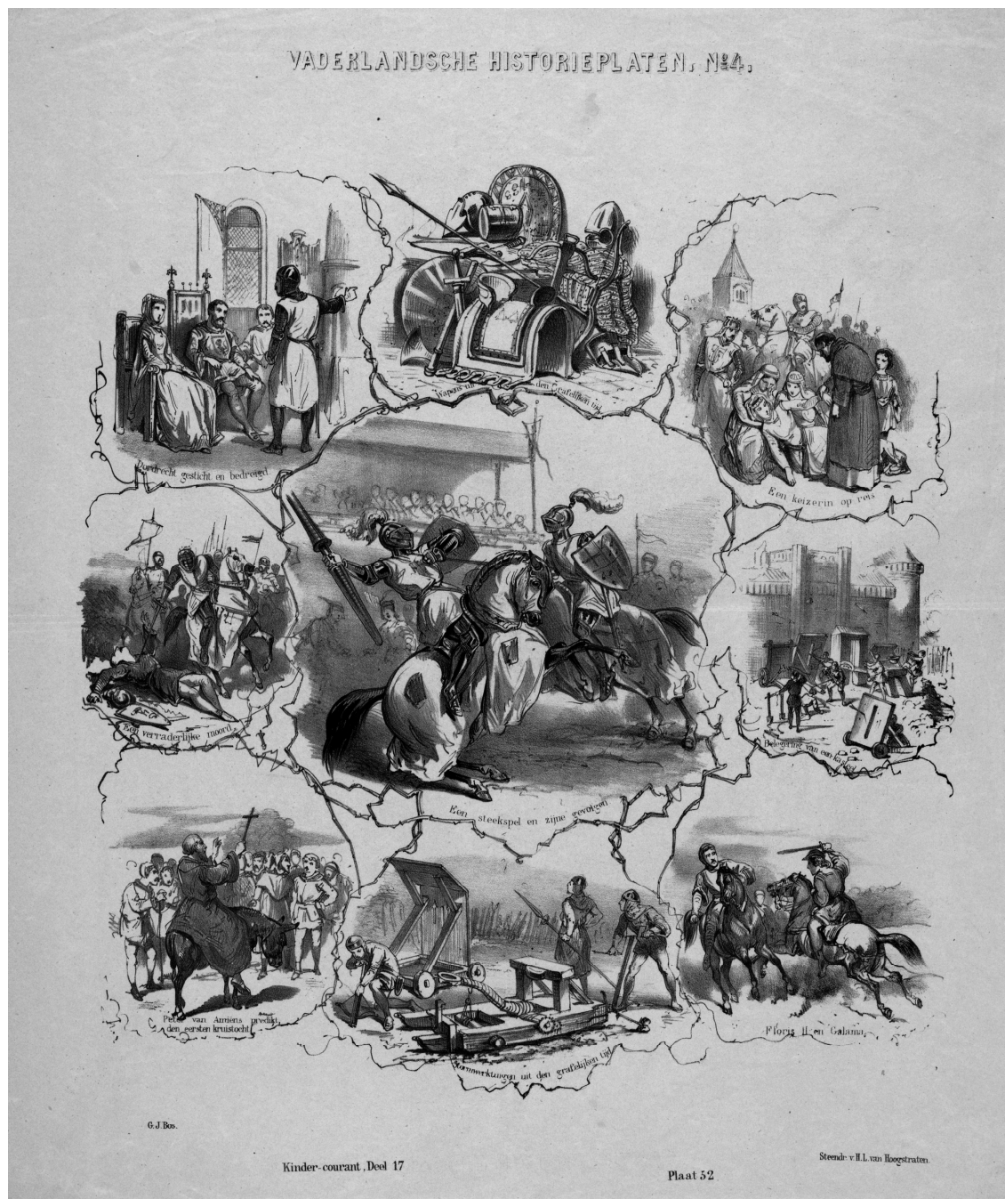
Scènes uit de tijd van de kruistochten. Kinderprent 1848-1896.