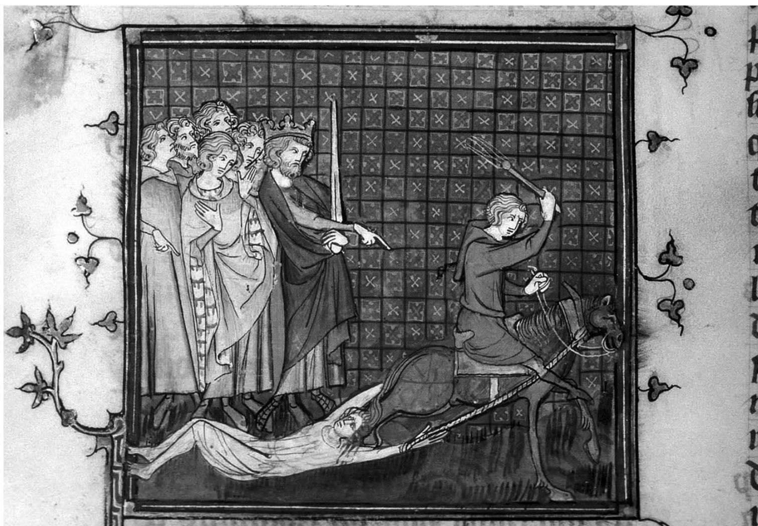
Brunhilde (534-613) (dochter van Athanagild, koning der Visigoten) wordt aan handen en haren voortgesleept door een paard. Bibliothèque nationale de France