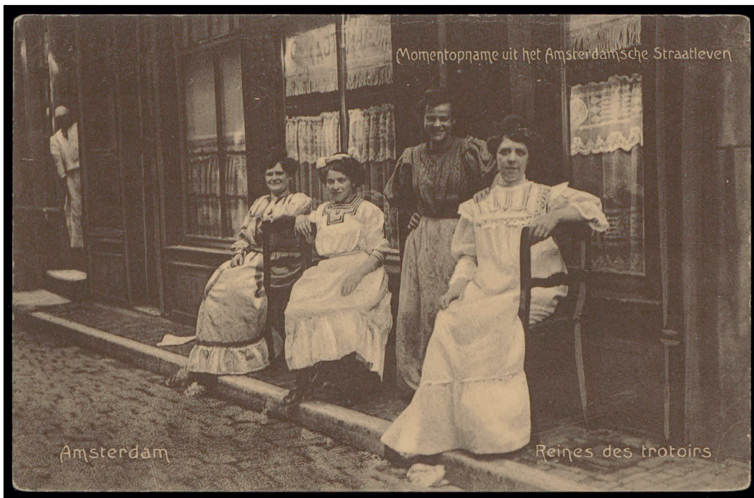
Prentbriefkaart. Uitgave Berg Co Reines des trottoirs, prostitutie in de Oudekennissteeg bij Café "de Stadt Hamburg".. Momenten uit het Amsterdamse straatleven. Prostitutie. Circa 1905