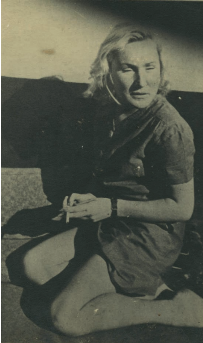
Portret van een prostituee met een sigaret in de hand in Kamp Neuengamme. Mogelijk is de foto gemaakt vlak na de bevrijding.

Alle kleine resultaten die de vrouwenemancipatie voor de Tweede Wereldoorlog had bereikt, verdwenen als sneeuw voor de zon onder het terreurbewind van de nazi's. In nazi Duitsland was de vrouw volledig ondergeschikt aan de man. "Emancipatie van vrouwen is een symptoom van verdorvenheid", aldus Hitler. 1 Vrouwen moesten thuis blijven, kinderen baren, voor de kinderen zorgen en het huishouden doen; mannen verdedigden het vaderland en op die manier hun gezin, aldus Joseph Goebbels (1897-1945), minister van Volksvoorlichting en Propaganda. 2 De voornaamste taak van vrouwen was het ras zuiver en sterk houden. In de ogen van de nazi's werkten prostituees voor alle rassen en waren opzichtig gekleed en waren daarom verderfelijk. 3 Prostituees waren de hoofdschuldigen van geslachtsziekten en degeneratie van het ras. 4 Zo bestempelde de (min of meer) aseksuele Hitler prostitutie verder als "verjoding van het zielenleven" en een "mammonisering van de geslachtsdrift." Vrouwen moesten Spartaans getraind worden, mochten geen cosmetica gebruiken, moesten zich eenvoudig kleden, mochten niet ijdel zijn en moesten afzien van culinaire lekkernijen. Homoseks en seks tussen Duitsers en "minderwaardige rassen" werd zwaar bestraft.