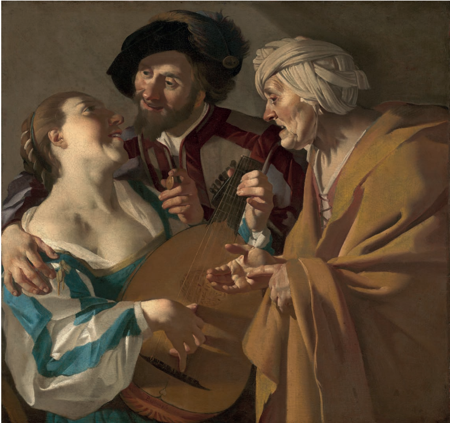
De koppelaarster. Dirck van Baburen. 1662. Museum of Fine Arts, Boston