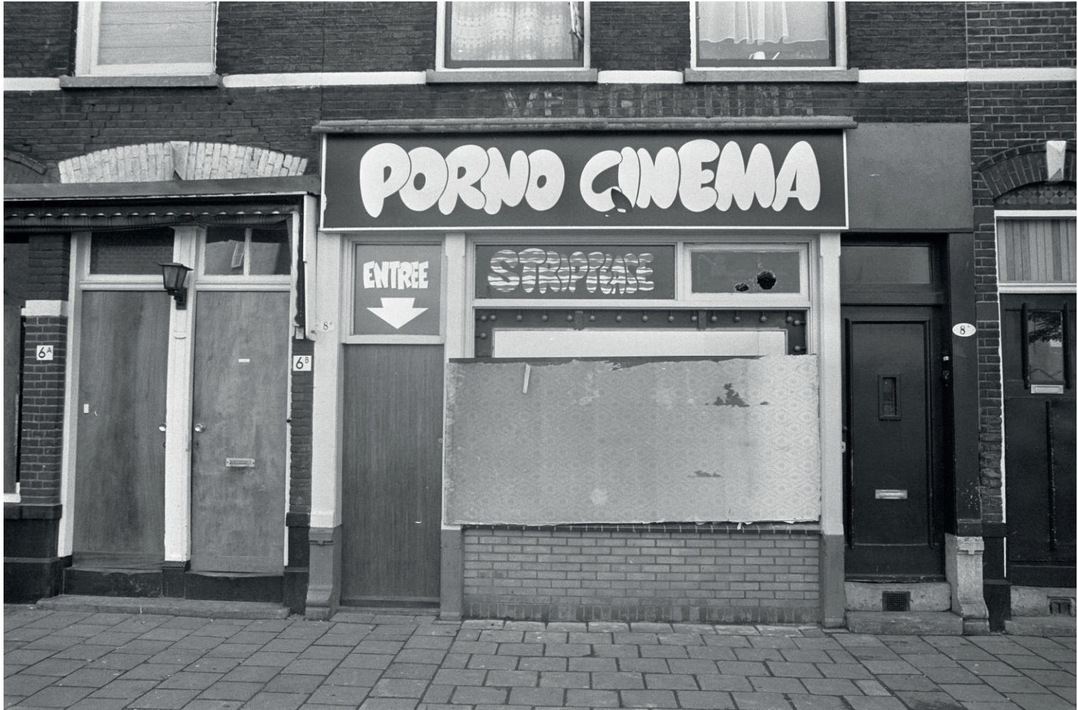
Buurtbewoners van Katendrecht (Rotterdam) gooiden ruiten in van bordelen en clubs. 1974.