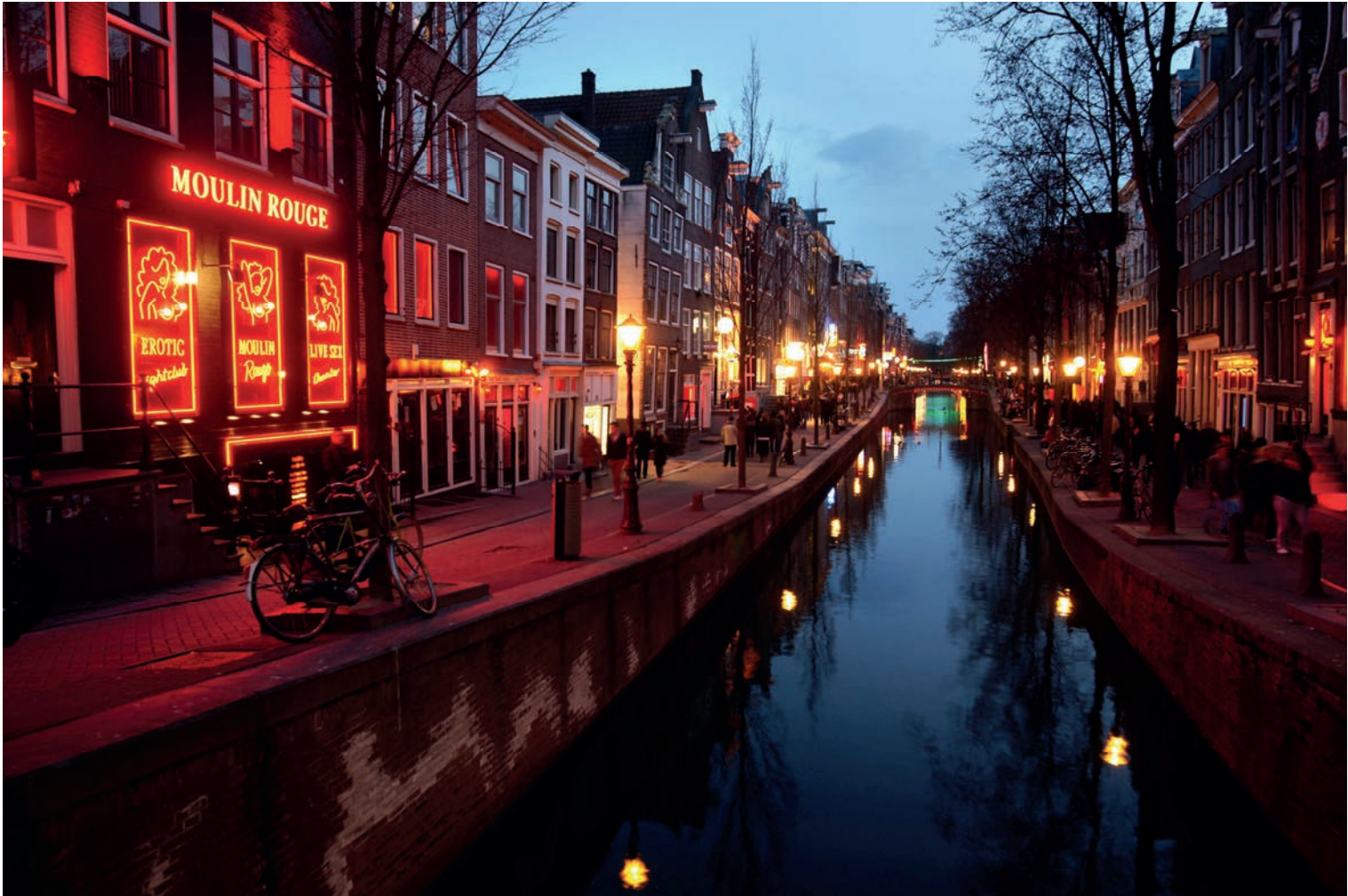
Oudezijds achterburgwal https://pic-amsterdam.com/