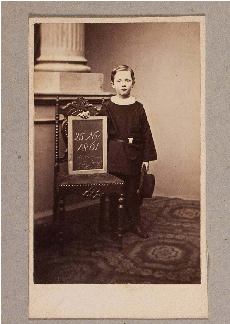
Beschrijving: portret van een onbekende jongen. Periode: 25 november 1861. Plaats: Arnhem. Nummer: 0894-1627-0564.

Niet alle foto's zijn terug te voeren op een fotograaf. Dat ligt ook aan de fotografen die op den duur hun negatieven vernietigden om de privacy van hun klanten te waarborgen of om magazijnruimte vrij te maken. Soms nam een fotograaf de zaak van een andere fotograaf over inclusief de lopende bestellingen, maar veel fotografen zullen uiteindelijk hun voorraad hebben opgeruimd als ze stopten met werken. Weinigen zullen zich bewust zijn geweest van de latere waarde van hun foto's. Uitgeverijen hechtten veelal ook niet veel waarde aan naamsvermelding van de fotograaf. Gelukkig kunnen we tegenwoordig nog genieten van een aantal foto's en prentbriefkaarten van de eerste fotografen in Arnhem.