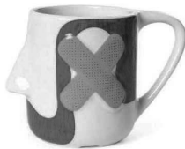
Mok uit het Van Gogh Museum

In de winkel van het Van Gogh Museum wordt een mok verkocht zonder oor, voorzien van pleisters. Volgens de shop een knipoog naar Vincent van Gogh. Ik vind het moreel verwerpelijk dat het museum een slaatje wil slaan uit het verlies van (een deel van) een oor van Vincent. De van commercie afkerige kunstenaar zou zich in zijn graf omdraaien als hij de holle reactie van het museum vernam: „Bedankt voor uw bericht en dat u de moeite heeft genomen uw gevoel met ons te delen. Wij proberen in onze winkels een zo breed mogelijk publiek te bereiken met een assortiment waar ieder iets van zijn gading kan vinden. Ik begrijp dat deze mok u tegen de borst stoot en dat het naar uw idee niet in ons museum hoort. Het betreft hier een test met artikelen waarvan wij weten dat ze buiten het museum erg populair zijn.” Ik concludeer hieruit dat het museum zich laat leiden door de publieke opinie en hun geldbuidel. Ik denk dat de tijdens zijn leven getormenteerde en afgewezen grootheid beter verdient en dat het Van Gogh Museum zowel in de letter als in de geest Vincents erfgoed moet koesteren.