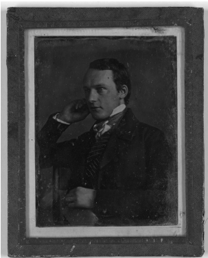
Foto van Oom Cent

In maart 1868 keerde Vincent terug naar zijn ouderlijke huis in Zundert. Zijn ouders maakten zich grote zorgen om de toen 15-jarige rebelse tiener en probeerden hem op het rechte pad te krijgen, althans hun rechte pad. Met (financiële) hulp van zijn familie ging hij al op jonge leeftijd werken in kunst- en boekhandels in de grote steden Den Haag en Londen. Gedurende de periode 1869-1873 werkte Vincent als bediende in de Haagse vestiging van de Franse kunst- en prentenhandel Goupil & Cie, waarvan zijn Oom Cent medevenoot was.