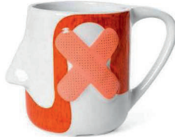
Mok uit het Van Gogh Museum

In de winkel van het Van Gogh Museum wordt een mok verkocht zonder oor, voorzien van pleisters. Volgens de shop een knipoog naar Vincent van Gogh. Ik vind het moreel verwerpelijk dat het museum een slaatje wil slaan uit het verlies van (een deel van) een oor van Vincent. De van commercie afkerige kunstenaar zou zich in zijn graf omdraaien als hij de holle reactie van het museum vernam: „Bedankt voor uw bericht en dat u de moeite heeft genomen uw gevoel met ons te delen. Wij proberen in onze winkels een zo breed mogelijk publiek te bereiken met een assortiment waar ieder iets van zijn gading kan vinden. Ik begrijp dat deze mok u tegen de borst stoot en dat het naar uw idee niet in ons museum hoort. Het betreft hier een test met artikelen waarvan wij weten dat ze buiten het museum erg populair zijn.” Ik concludeer hieruit dat het museum zich laat leiden door de publieke opinie en hun geldbuidel. Ik denk dat de tijdens zijn leven getormenteerde en afgewezen grootheid beter verdient en dat het Van Gogh Museum zowel in de letter als in de geest Vincents erfgoed moet koesteren.