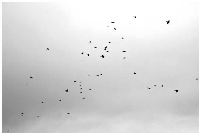
Roodvleugelspreeuwen in de herfst, Bettysbaai