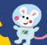
Piep, de astromuis