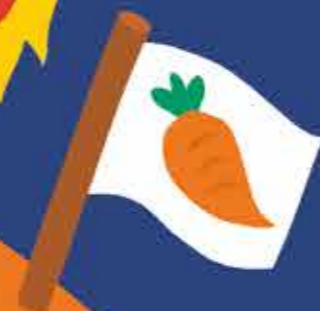
de onbekende planeet