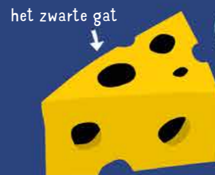
het zwarte gat