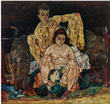
Boven: De familie, Egon Schiele, 1918, olieverf op doek.

pijn was zo overheersend dat die het gevoel van een innerlijk zelf uitwiste. "Resonance" begon als poging om structuur aan te brengen en afstand te nemen van een overweldigend bestaan.' In de werken uit deze serie leggen de MRI-grids van de hersenen zowel de oorsprong van de pijn vast, als het concept van een zelf. Het veranderde oppervlak - overschilderd, bekrast, met collages beplakt - komt door strijd tot stand.