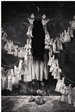
Links: Historia of She , Darla Teagarden, 2017, digitaal werk.

De surrealistische fotografische verhalen van Darla Teagarden houden het midden tussen sprookje en werkelijkheid en vinden veel werkklank bij diegenen die de wereld door een sprankje betovering bekijken. Deze koortsachtige visioenen zijn diep doordrenkt met fragiele geheimen, intense emoties en een griszellig gevoel van urgentie - een wereldvreemd gekunst aan je zintuigen. Teagarden bouwt deze levendig expressieve afbeeldingen op uit hout, papier en gips, samen met vintage rekwisieten, kleding en met de hand getekende achtergronden. In deze fragiele liminale ruimte die vele keren herbouwd en bedacht wordt, wordt het gros van haar duistere, filmische beelden gecreëerd.