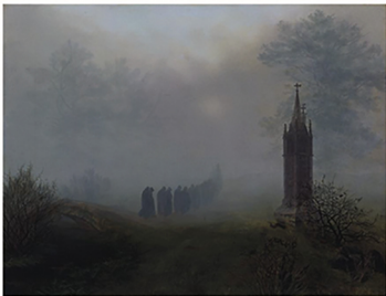
Hierboven: W'een Night Gown, Nona Limmen, 2019, digitale fotografie.

Nona Limmen woont en werkt in Amsterdam, maar haar foto's geven ons visioenen van een wilde, mysterieuze droomwereld die duister grenst aan die van ons. Dit raadselachtige koninkrijk bestaat uit schaduwen en geheimen, met torenhoge kliffen, donkere grotten, grimmige gebouwen en gesluierde bewoners, in snapshots vol dreiging, mysterie en magie. De analoge benadering van fotografie voegt nog een laag van geheimzinnigheid toe: de korrel, veelzijdige lenzen en wazige indrukken geven je het gevoel dat je mazzel hebt om glimpjes op te mogen vangen van een oord dat zowel magisch als zeldzaam is, een plek die nooit eerder door anderen is gezien.