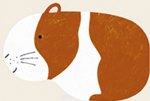
Dieren leren tekenen