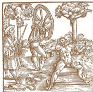
1113 Radbraken betekende een uiterst pijnlijke, publieke dood.

Zodra de voorgeschreven tijd was verstreken, werd het leven van het slachtoffer beëindigd. Dat kon op meerdere manieren gebeuren. Een paar flinke