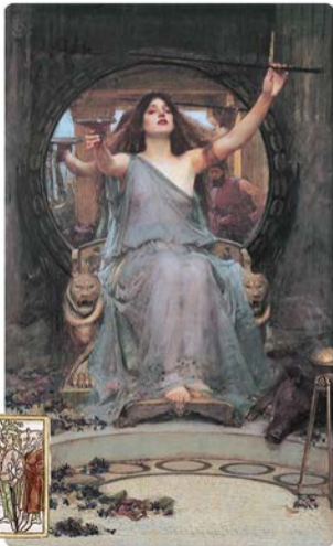
NIETS: Circe leidt Odysseus naar haar dwarkpaleis. John William Waterhouse, 1891.

Circe werd door haar vader Helios in zijn gouden zonnewagen naar het eiland Aeaë gebracht. Daar leefde ze in een paleis, omringd door betoverende wilde dieren.