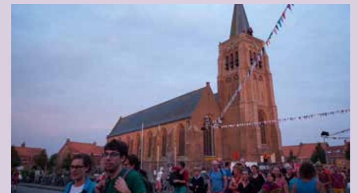
Niets leukers dan festivalgangers en kampeerders afloeren (2003).