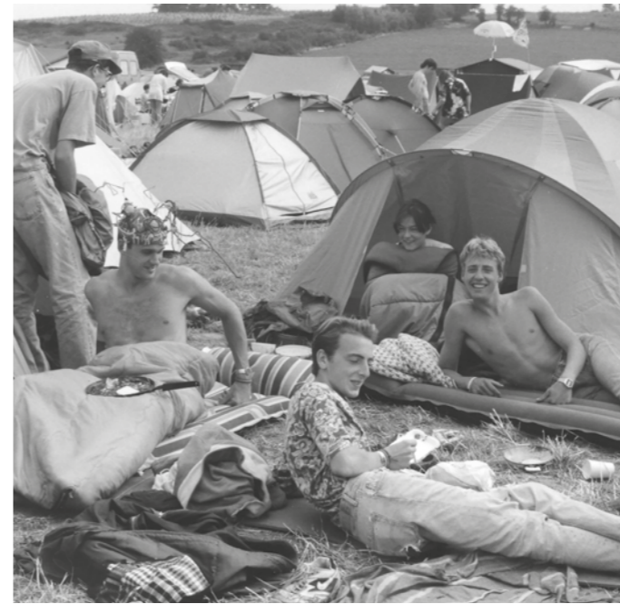
⤵ Net wakker (1994). Powernaps zijn essentieel (2000)! ⤴