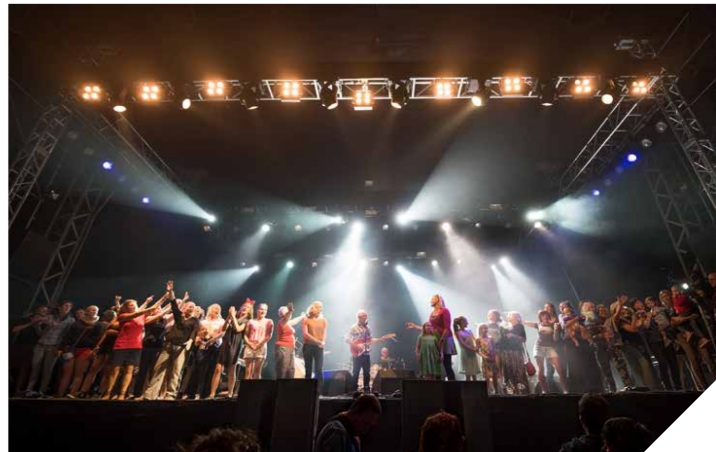
Voor de 40ste verjaardag van zijn hit 'Meisjes' riep Raymond Van Het Groenewoud 40 jonge en iets minder jonge meisjes het podium op om de bekende tekst mee te zingen (2016).