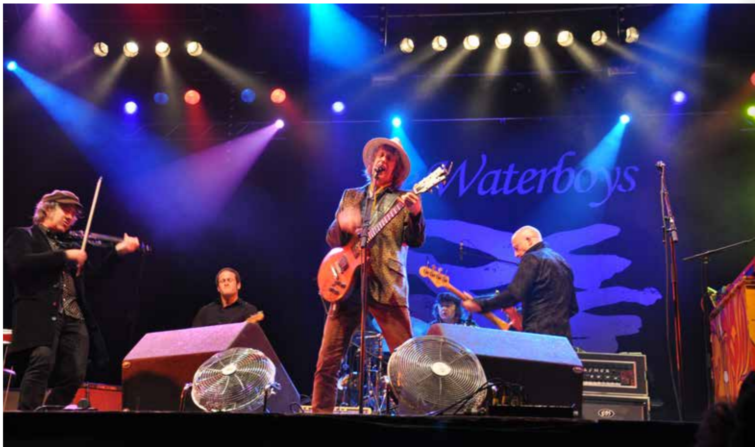
Te klasseren onder de noemer 'Dranouter Classics': The Waterboys (2012).