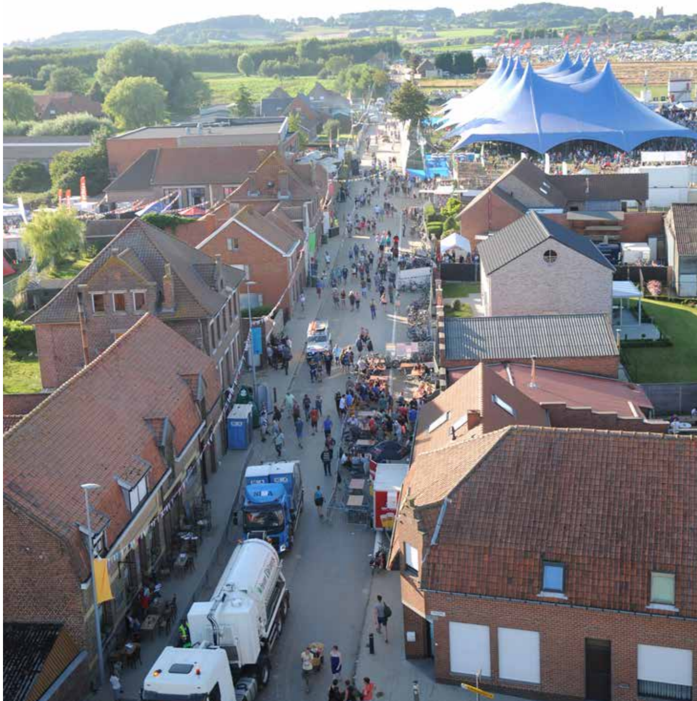
De sfeer opsnuiven in het dorp: het hoort erbij (2016).