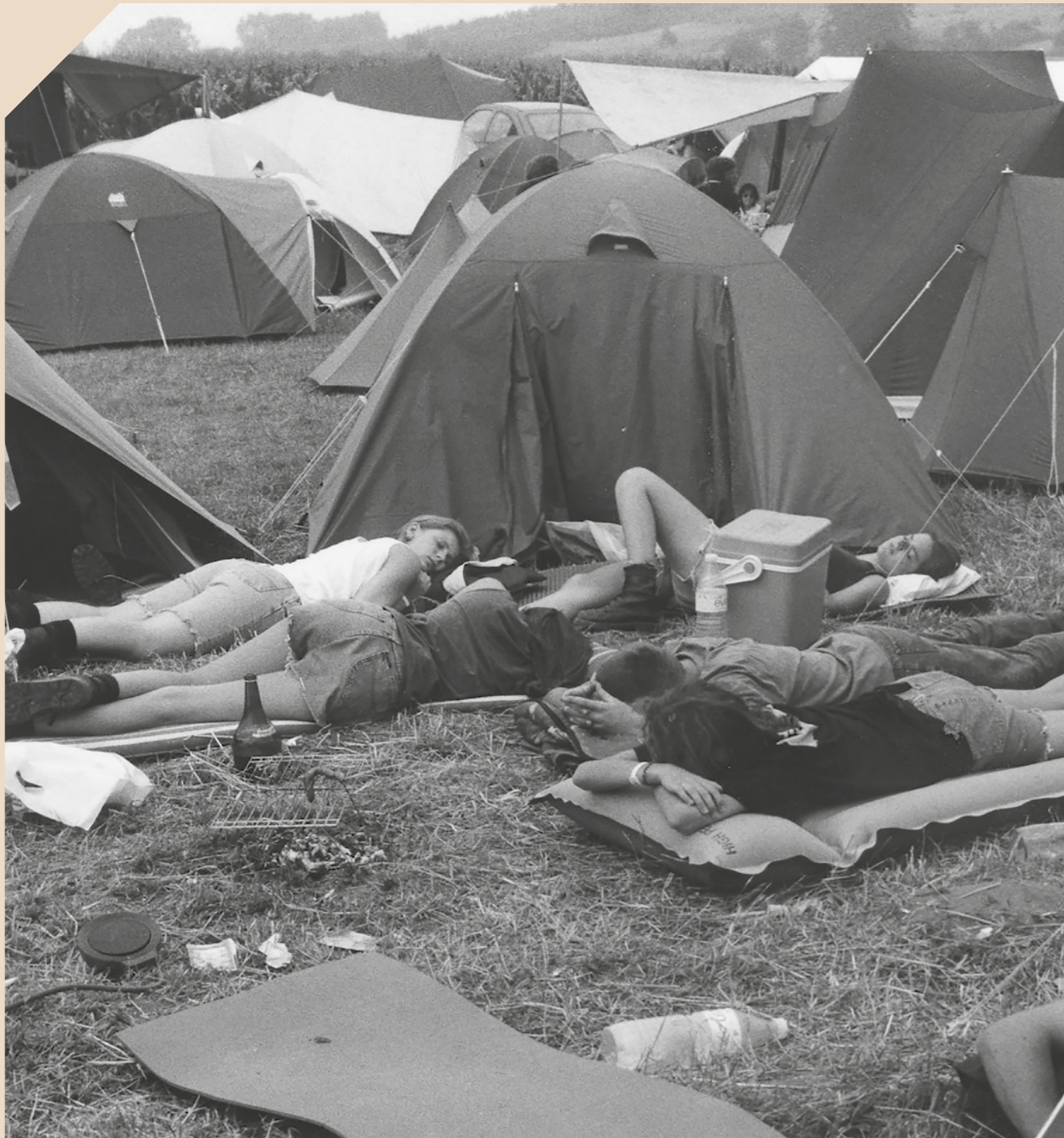
⤴ Te warm in de tent? Dan maar onder de blote hemel uitrusten (jaartal onbekend).