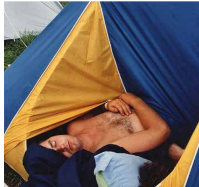
⤴ En powernapjes zijn van alle tijden (2002).