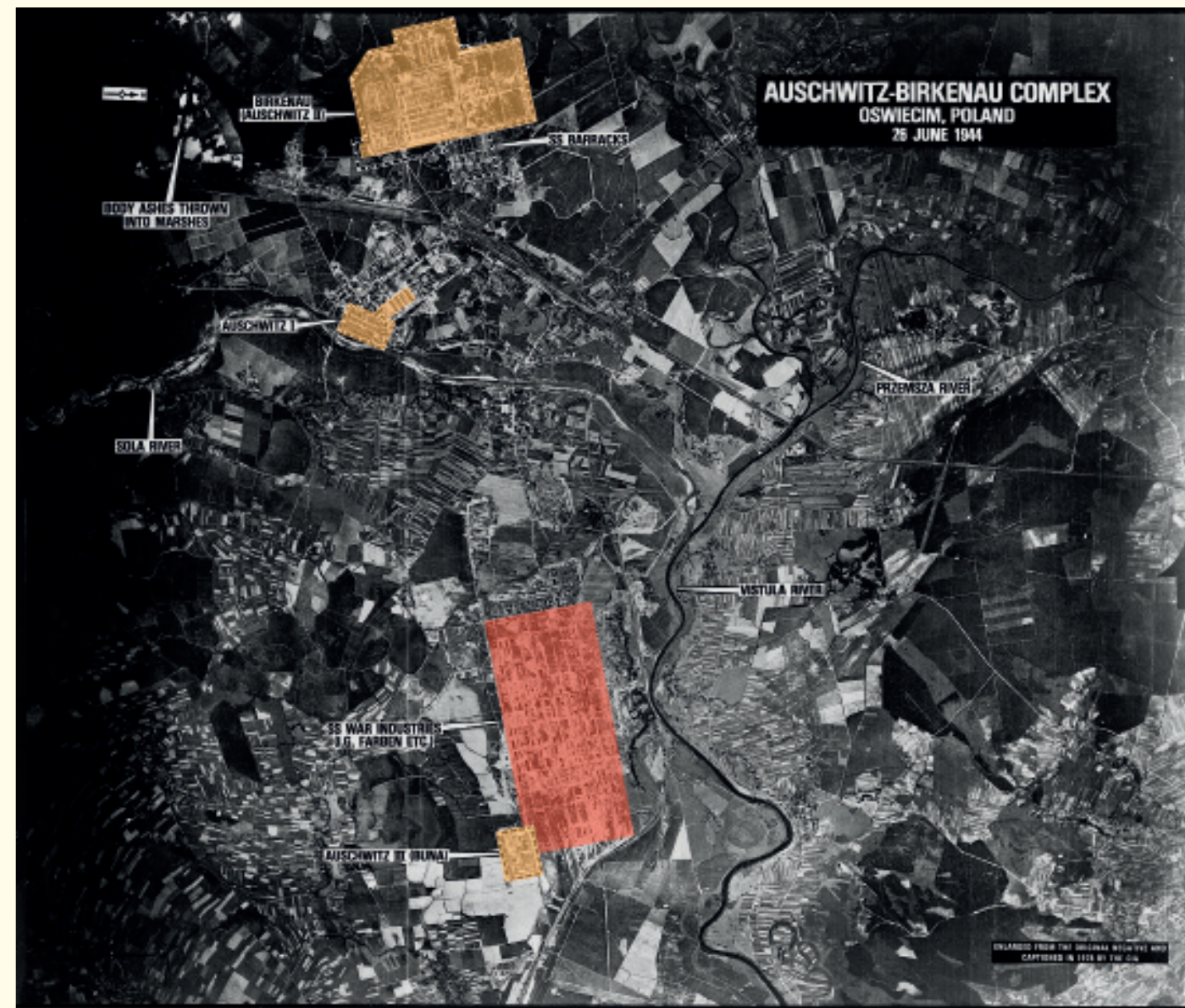
Het Auschwitz-kampcomplex met zijn drie redelijk autonome entiteiten, gefotografeerd op 26 juni 1944 door een Mosquito-vliegtuig van het 60ste Fotoverkenningsskader van de Zuid-Afrikaanse luchtmacht.

Het ontstaan, de opbouw en de organisatie van Auschwitz-Birkenau in de loop van zijn bestaan is een complex verhaal, te lang om hier tot in detail te vertellen. Kort samengevat kunnen we stellen dat het kerngebied van 40 vierkante kilometer bestond uit drie grote kampen die op enkele kilometers van elkaar lagen: Auschwitz I, Auschwitz II (Birkenau) en Auschwitz III (Monowitz). Auschwitz maakte verschillende fasen door en evolueerde van concentratiekamp tot een nieuw type kamp, dat kenmerken van concentratiekampen zoals Dachau of Gross-Rosen combineerde met die van uitroeiingscentra zoals Treblinka of Belzec.