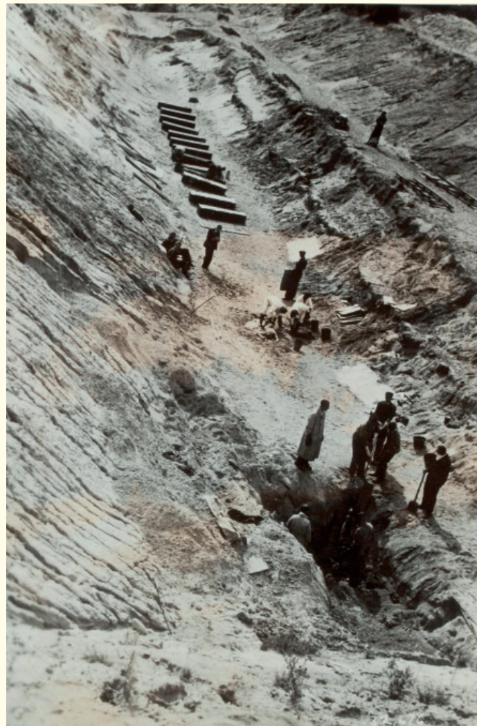
Aan het einde van de schietbaan werd een massagraf met 49 lijken gevonden. Deze massa-executie was een van de vergeldingsacties naar aanleiding van de aanslag op Hanns Albin Rauter, de hoogste vertegenwoordiger van de SS in Nederland. Hoewel die aanslag niet direct tegen hem was gericht, geraakte Rauter zwaargewond.

Het onderzoeksteam van Nationaal Monument Kamp Amersfoort heeft inmiddels dankzij binnen- en buitenlandse archieven, transportlijsten, politierapporten, naoorlogse processen-verbaal en memoires van oud-gevangenen ruim 35 700 geregistreerde identiteiten achterhaald van de circa 47 000 gevangenen. Onder hen waren vele honderden vrouwen en kinderen. In het kamp zijn 652 mensen vermoord, waarvan 383 door executie, en er worden nog steeds 17 personen vermist; ten minste 373 gevangenen wisten te ontsnappen.