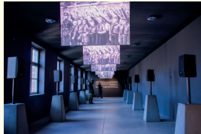
Het Staatsmuseum Auschwitz-Birkenau omvat exposities in diverse gebouwen van Auschwitz I en de openstelling van het kampterrein van Auschwitz-Birkenau. Blokken 4 en 5 van Auschwitz I huisvesten bijvoorbeeld een tentoonstelling over de Holocaust. In Blok 5 ligt een verzameling voorwerpen die in het kamp werden gevonden, o.a. brillen, schoenen, kookgerei en koffers. Een vitrinekast van ongeveer 30 meter lang is in het geheel gevuld met het afgeschoren haar van gevangenen. Blokken 6 en 7 bevatten een expo over het leven in Auschwitz. Blok 11 is de eerste plek in dit kamp waar Zyklon B werd gebruikt om mensen te vergassen. Vlak daarnaast bevindt zich de Dodenmuur, waar mensen werden neergeschoten. Sinds 1960 zijn in de verschillende blokken permanente 'nationale' tentoonstellingen ondergebracht. Ze zijn opgebouwd in samenwerking met het betreffende land waarvan de inwoners tijdens de Tweede Wereldoorlog naar Auschwitz zijn gedeporteerd. Het Belgische en Nederlandse luik zijn terug te vinden in Blokken 20 en 21.

Bij aankomst van een transport vond een eerste selectieprocedure plaats: gezinnen werden opgesplitst. De mannen en de oudere jongens aan de ene kant, de vrouwen en jonge kinderen aan de andere kant. Daarna volgde een bezoek aan de kampartsen, die op basis van een oppervlakkige inspectie beslisten of de nieuwkomers zouden blijven leven of sterven. Leeftijd was een van de belangrijkste criteria voor selectie. Over het algemeen werden alle kinderen onder de 16 jaar (vanaf 1944 onder de 14 jaar), alle ouderen en al wie niet fit genoeg leek, de dood in gestuurd. In de praktijk kwam dit meestal neer op driekwart van het transport.