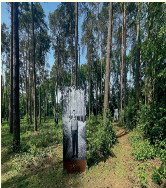
In het bos naast het herinneringscentrum komt de wandelaar 'oog in oog te staan met de laatste getuigen'. Fotograaf Frank Demiel sprak en fotografeerde 17 mannen en vrouwen die tussen 1941 en 1945 in het kamp gevangen zaten en vereeuwigde hen in deze levensgrote portretten op de plaats waar ze als gevangenen rondliepen.