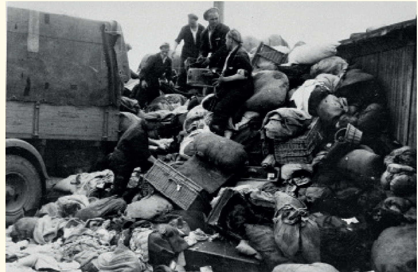
Gevangenen van het opruimingscommando lossen de in beslag genomen eigendommen van een transport van Joden bij een van de opslagplaatsen in Auschwitz-Birkenau. De kampgevangenen noemden deze opslagplaatsen 'Kanada', omdat ze ze associeerden met de rijkdom waarvoor Canada symbool stond. De 'Kanada'-opslagfaciliteiten besloegen verschillende tientallen barakken en andere gebouwen rondom het kamp. De geplunderde eigendommen werden vanuit Auschwitz via een uitgebreid distributienetwerk naar individuen en verschillende economische takken van het Derde Rijk gestuurd.