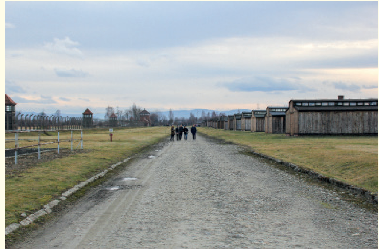
Van de bijna 300 houten barakken in Birkenau zijn er slechts negentien overeind gebleven: achttien nabij het entreegebouw en één barak verder het kamp in. Als bezoeker krijg je hier vooral een gevoel van totale leegte. De onbeschrijflijke desolaatheid van het terrein confronteert je met de enormiteit van de misdaden die hier plaatsvonden.