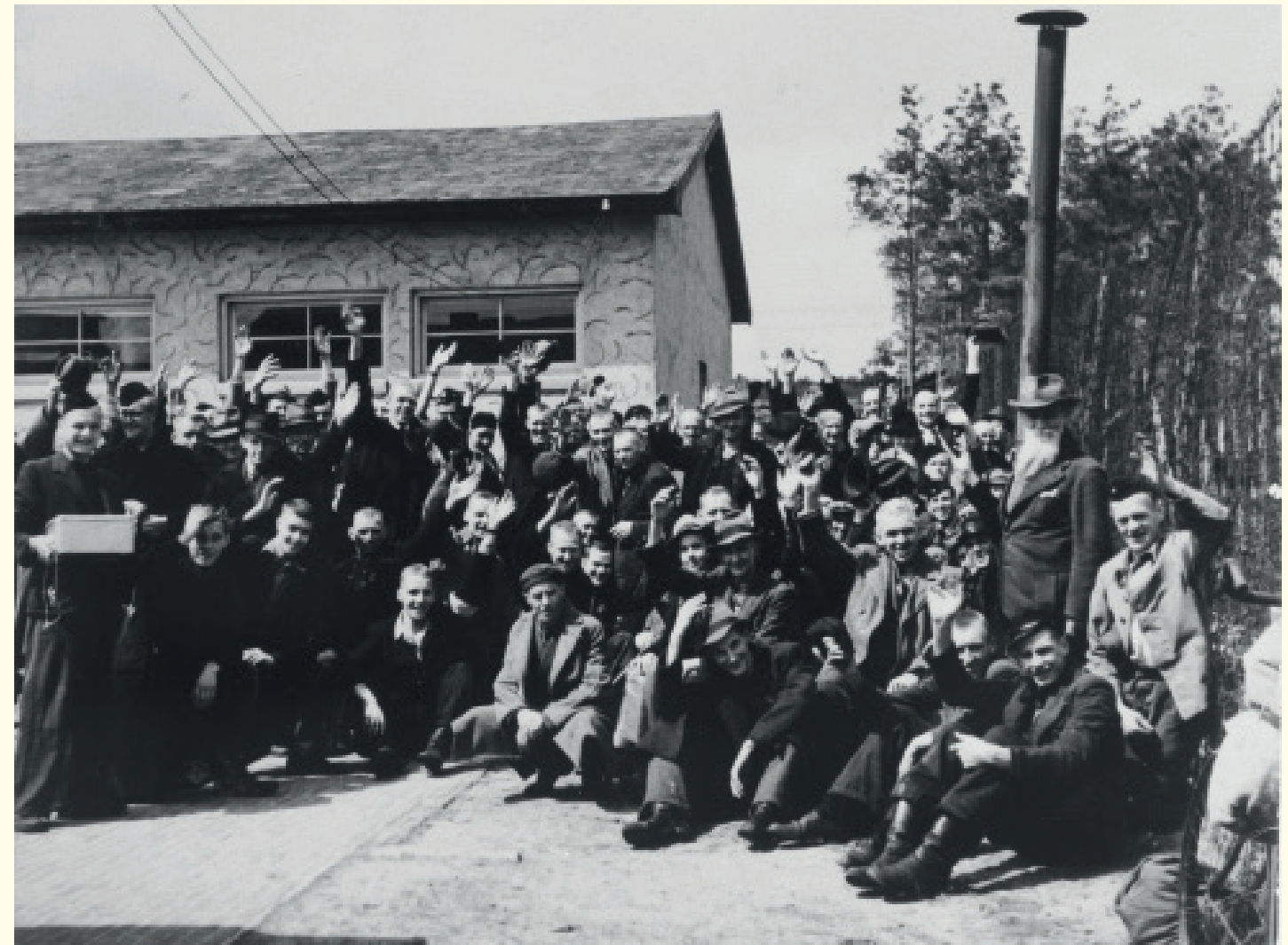
7 mei 1945. Gevangenen van Kamp Amersfoort vlak voor de terugkeer naar huis.

De omstandigheden in Kamp Amersfoort waren in de periode na de heropening minder slecht dan voorheen. Dit had veel te