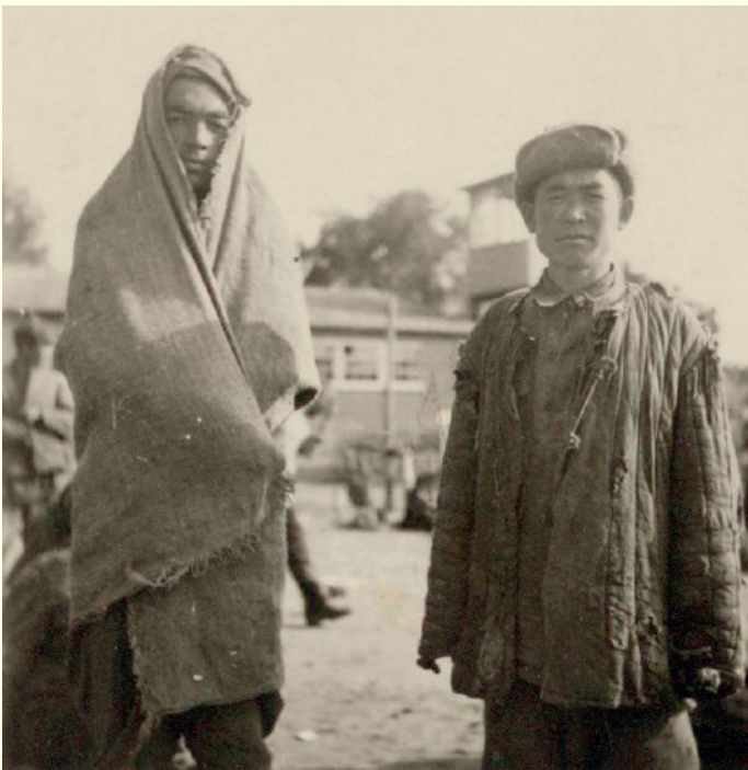
Twee overlevende Sovjetkrijgsgevangenen. Van de 100 Sovjetkrijgsgevangenen werden er 77 op 9 april 1942 geëxecuteerd, de op een na grootste massa-executie in Nederland.

(Voor de totstandkoming van dit hoofdstuk, zowel wat betreft tekst als fotografie, is de auteur grote dank verschuldigd aan het onderzoeksteam van Nationaal Monument Kamp Amersfoort, in het bijzonder drs. Floris van Dijk en Micha Bruinvels.)