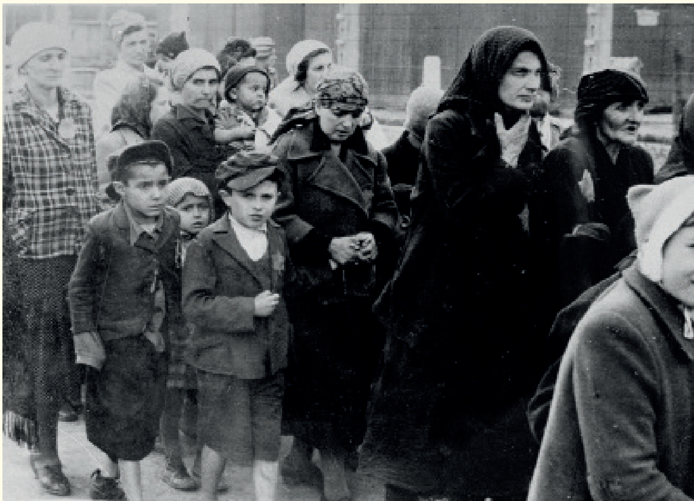
Joodse vrouwen en kinderen op weg naar de gaskamer.