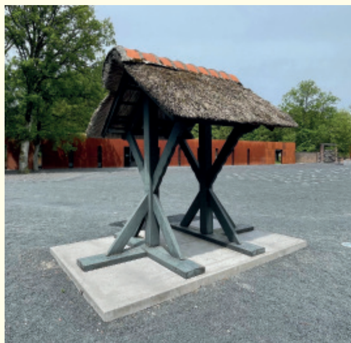
De appellok en klokkenstoel herinneren aan de - door gevangenen - gehate appels. De klok en klokkenstoel zijn gerestaureerd. De appellok wordt twee keer per jaar geluid, op 19 april (herdenking van de overdracht van Kamp Amersfoort aan het Nederlandse Rode Kruis) en op 4 mei voorafgaand aan de 'Stille Tocht'.