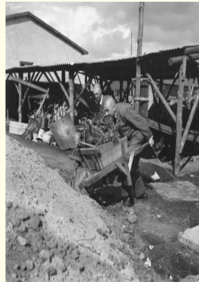
Na de oorlog werd Kamp Amersfoort gebruikt als oorlogsmisdadigers en collaborateurs.