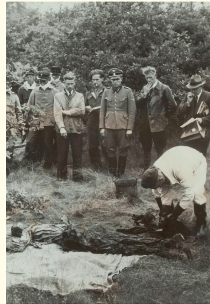
Nederlandse politiemannen brachten de voormalige commandant van Kamp Amersfoort, Karl Peter Berg, naar Amersfoort om hen te wijzen waar de slachtoffers waren begraven en hem te dwingen te kijken naar de resultaten van zijn misdaden. Binnen twee maanden werden ongeveer 150 slachtoffers gevonden.