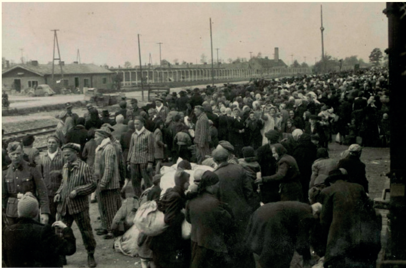
Aankomst van een transport met Hongaarse Joden in mei 1944. In die maand begonnen de Hongaarse autoriteiten, in samenwerking met de Duitse veiligheids politie, systematisch Hongaarse Joden te deporteren. De Hongaarse politie voerde de razzia's uit en dwong de Joden op de deportatietreinen. In minder dan twee maanden werden bijna 440 000 Joden uit Hongarije gedeporteerd in meer dan 145 treinen.