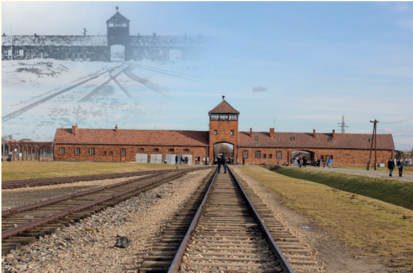
De wereldberoemde toegangspoort in Birkenau waarlangs de transporten rechtstreeks tot in het kamp kwamen. Toen en nu verwrongen tot een machtig beeld dat symbool staat voor een van de lelijkste passages in de geschiedenis van de mensheid.