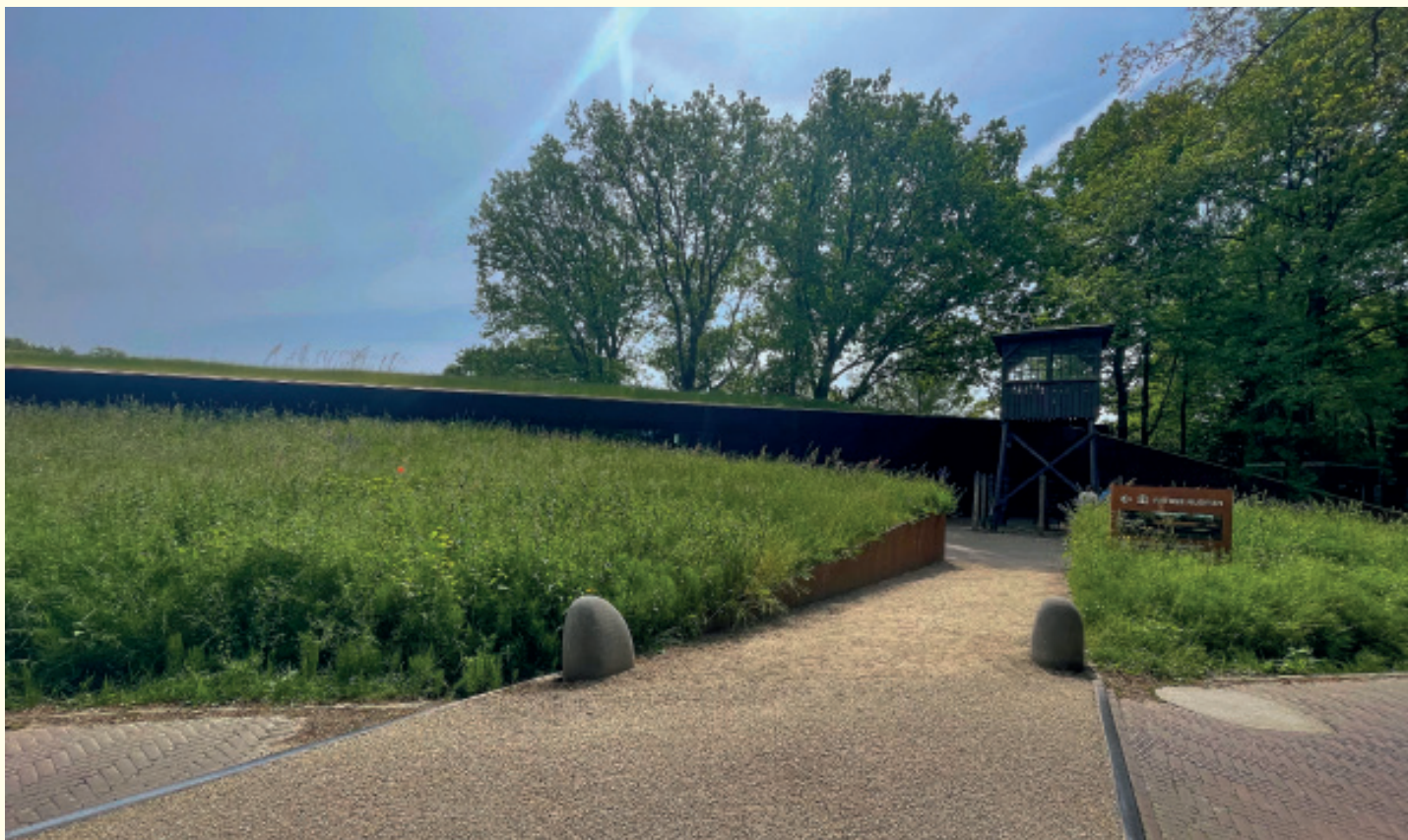
Een authentieke wachttoren verwelkomt de bezoekers aan de ingang van het museum.