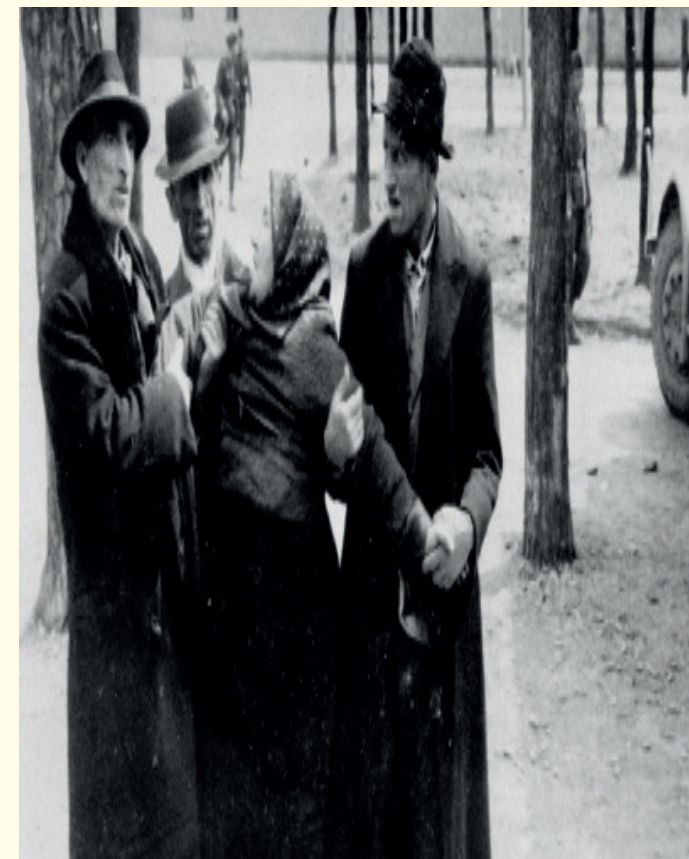
Deze oude Joodse vrouw moet worden tegengehouden door drie van haar mannelijke lotgenoten. Ze is net van haar familie gescheiden.