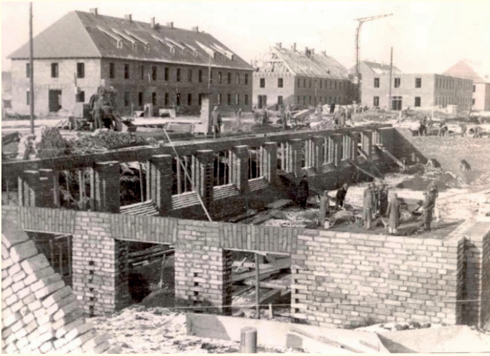
In de buitenwijken van de Poolse stad Oświęcim werd een voormalige legerkazerne uitgekozen om een nieuw concentratiekamp op te richten. De bestaande barakken werden aangepast en uitgebreid. In het voorjaar van 1941 begon de bouw van acht nieuwe blokken, die klaar waren in de eerste helft van 1942.