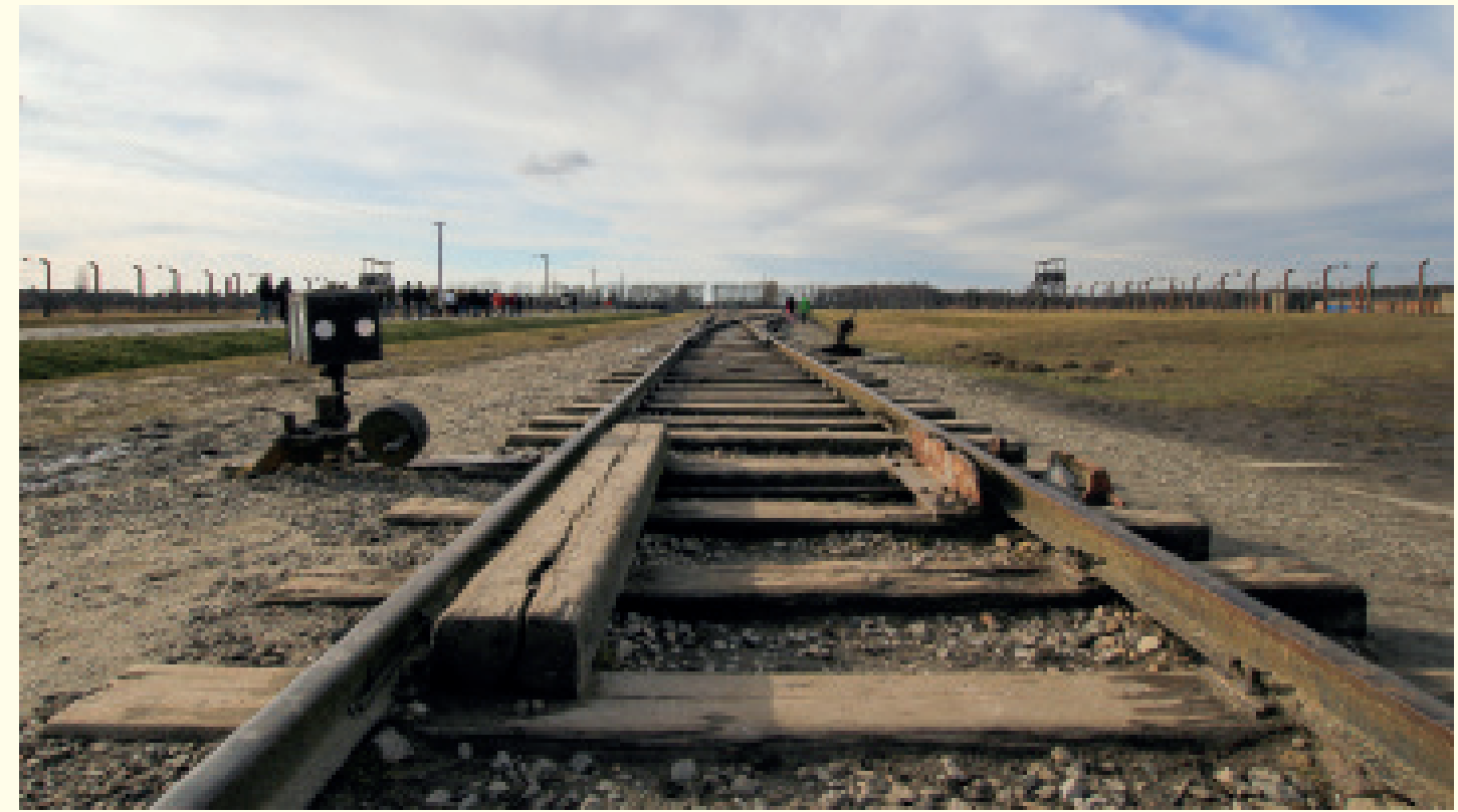
Nog een beeld dat de enorme uitgestrektheid van dit moordkamp illustreert. Het eerste 'losplatform', gelegen naast Auschwitz I, was in gebruik gedurende de hele periode dat het Auschwitz-kampcomplex operationeel was en bediende voornamelijk het hoofdkamp. De tweede losplaats (de zgn. Alte Judenrampe ) werd in 1942 in gebruik genomen en was gelegen op het terrein van het goederenstation van Oświęcim, tussen Auschwitz en Birkenau. De derde werd vanaf 1943 gebouwd binnen het kamp Birkenau en in mei 1944 in gebruik genomen. De spoorlijn langs deze losplaats liep tot aan de gaskamers en crematoria II en III.