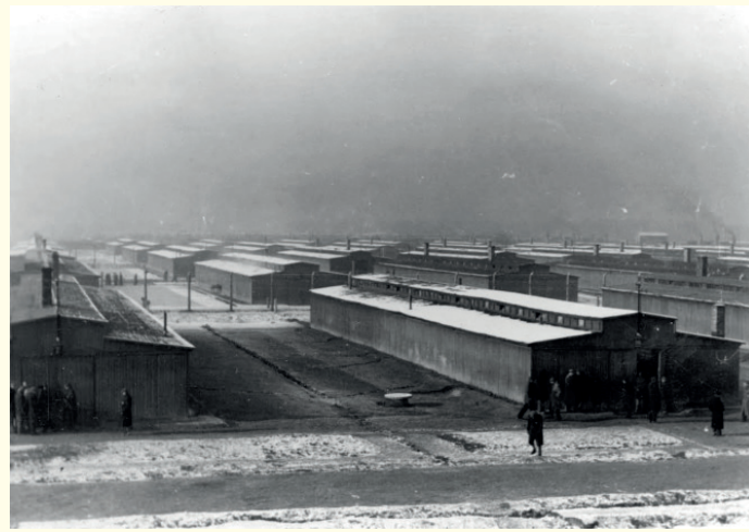
'Monsterkamp' Birkenau opende in maart 1942 als een dependance van Auschwitz en groeide uit tot een autonome administratieve entiteit en een centrum voor de grootschalige uitroeiing van Joden. Het was met voorsprong het grootste onderdeel van het Auschwitz-complex. De gevangenen werden in Birkenau gehuisvest in bakstenen en houten barakken. De houten barakken leken op stallen, vooral in de segmenten BII en BIII. Zoals men ziet hadden deze barakken geen ramen. In plaats daarvan zat er aan weerszijden bovenaan een rij dakramen. Een schoorsteenkanaal, dat de barakken in de winter verwarmde, liep bijna over de hele lengte van de muren. De barakken waren verdeeld in 18 stallen, oorspronkelijk bedoeld voor ... 52 paarden.

Hoeveel gedeporteerden uiteindelijk de dood vonden in het kampcomplex van Auschwitz is een zeer moeilijke vraag. Historici schatten dat ongeveer 1,5 miljoen mensen zijn omgekomen gedurende de minder dan 5 jaar van zijn bestaan. Hiervan kwamen ongeveer 1,1 miljoen mensen om door vergassing, de rest door andere oorzaken, zoals uithongering, mishandeling, medische experimenten, enz. De grootste groep slachtoffers van de gaskamers waren de ongeveer 1 miljoen Joden, gevolgd door de meer dan 70 000 niet-Joodse Polen en ongeveer 20 000 Roma. Ook duizenden Sovjetkrijgsgevangenen en gevangenen van andere etnische achtergronden stierven in de gaskamers van Birkenau.