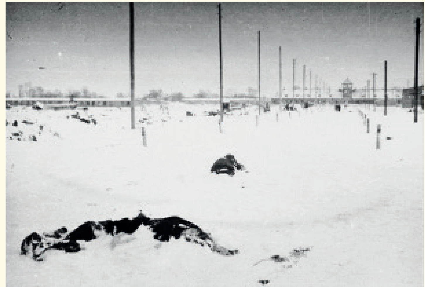
Het originele bijschrift op de foto: Het spoor van evacuatie, gemarkeerd door lichamen om de paar stappen. Wie viel, werd ter plaatse gedood. Midden januari 1945 begonnen de nazi's met de definitieve evacuatie van het kamp. In principe zouden alleen gezonde mensen de aftocht mogen aanvatten, maar in de praktijk boden ook zieke en verzwakte gevangenen zich aan, omdat ze dachten, niet zonder reden, dat de Duitsers de achterblijvers zouden ombrengen. Duizenden lijken van gevangenen die werden neergeschoten of die stierven door vermoeidheid of blootstelling aan de kou, lagen langs de routes waar ze passeerden.