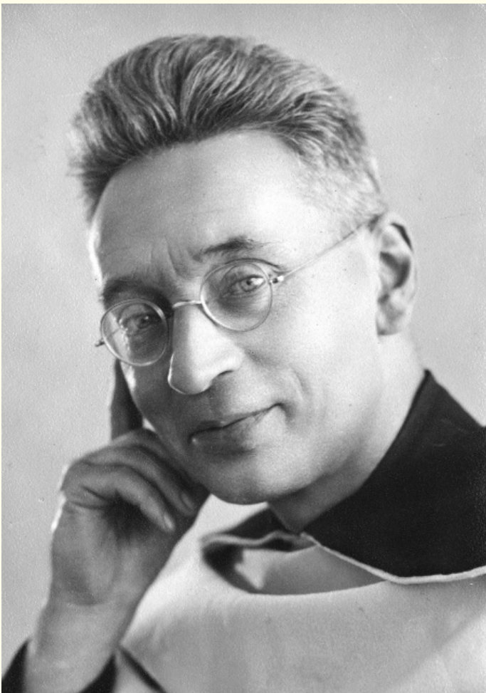
Gevangene Titus Brandsma met gevangenennummer 58. Brandsma was specialist in middeleeuwse mystiek en zelf mysticus. Tijdens de bezetting ageerde hij tegen het nazisme. In 2022 werd hij heilig verklaard.

sjacheren en regelen van voedsel of diensten, door gevangenen 'organiseren' genoemd. Er was vooral de allesoverheersende honger. De voedselverstreking in Kamp Amersfoort liet zeer veel te wensen over. Getuige daarvan: eind januari 1942 had liefst dertig procent van de gevangenen last van hongeroedeem. Ondanks enige verbetering vanaf 1943 bleef Kamp Amersfoort een hongerkamp.