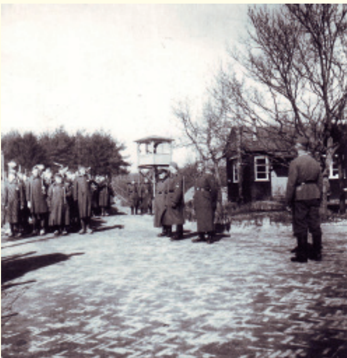
Appelplaats van Kamp Amersfoort.

Vanaf juni 1945 arriveerden in Kamp Amersfoort de eerste groepen Nederlandse repatrianten uit de Duitse oorlogsindustrie. Een ander gedeelte fungeerde als interneringskamp voor collaborateurs en heette in de volksmond 'het Foute Kamp'. De mishandelingen van deze gevangenen verschilden weinig van die tijdens de oorlog.