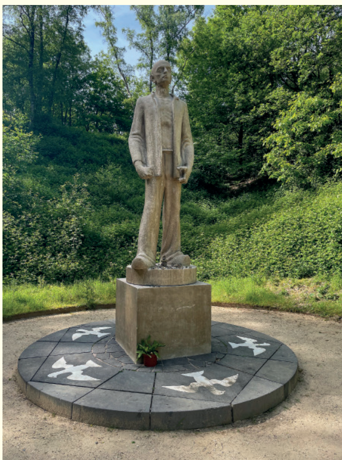
Aan het einde van de schietbaan, die door de gevangenen met de hand werd uitgegraven, staat de Gevangene voor het vuurpeloton van de hand van Frits Sieger. De vuist van de man is gebald als teken van machteloze woede en ongebroken wil. De vijf vredesduiven verwijzen naar de oorlogsjaren. De Stenen man , zoals de mannenfiguur in de volksmond wordt genoemd, staat op de plek waar na de bevrijding een massagraf met 49 lichamen werd opengelegd.