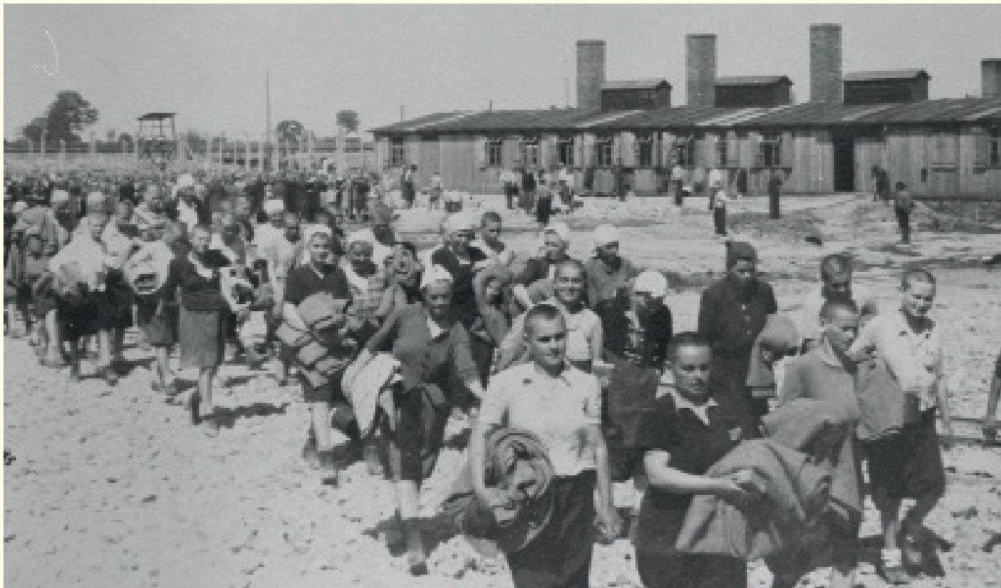
Deze jonge Joodse vrouwen zijn fit genoeg bevonden om te werken en mogen dus blijven leven. Na desinfectie en een 'kappersbeurt' worden ze weggeleid naar hun barakken.