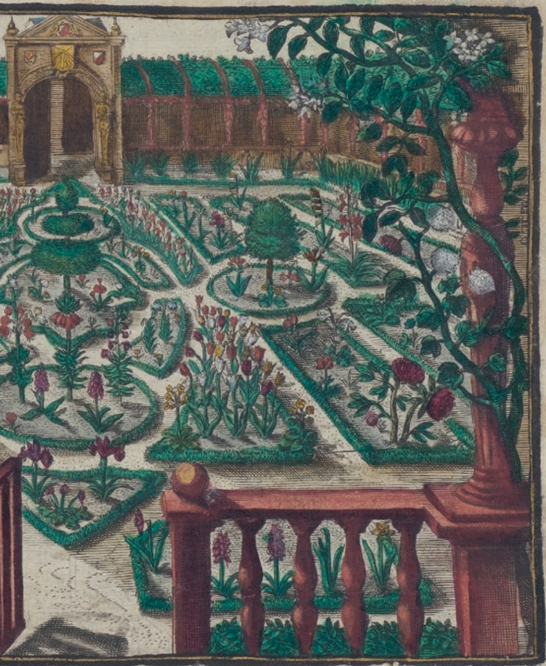
Crispijn de Passe II, De Lente uit de Hortus Floridus , 1614, Oak Spring Garden Foundation, Upperville, Virginia (USA)