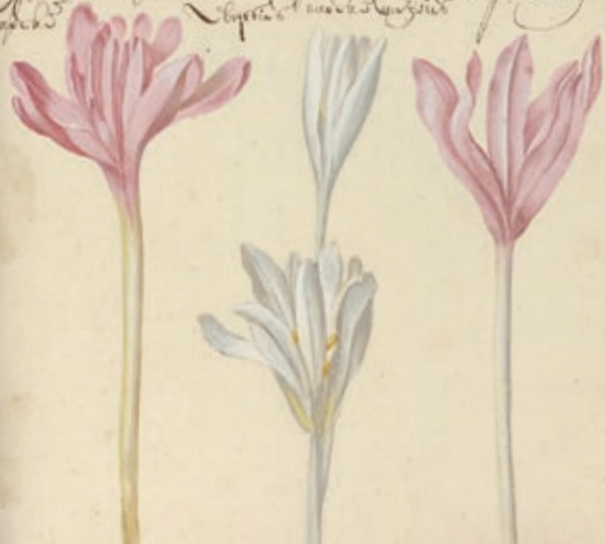
Franciscus de Geest, Cyclamen hederifolium in de Hortus Amoensissimus , 1668, Bibliotheca Nazionale Centrale, Rome

Colchicum Aquilegine Colchicum Colchicum fl. Pallid. & fl. alb. semper fl. ampl. Aug. 1657 Sept. 1657 Aug. 1657