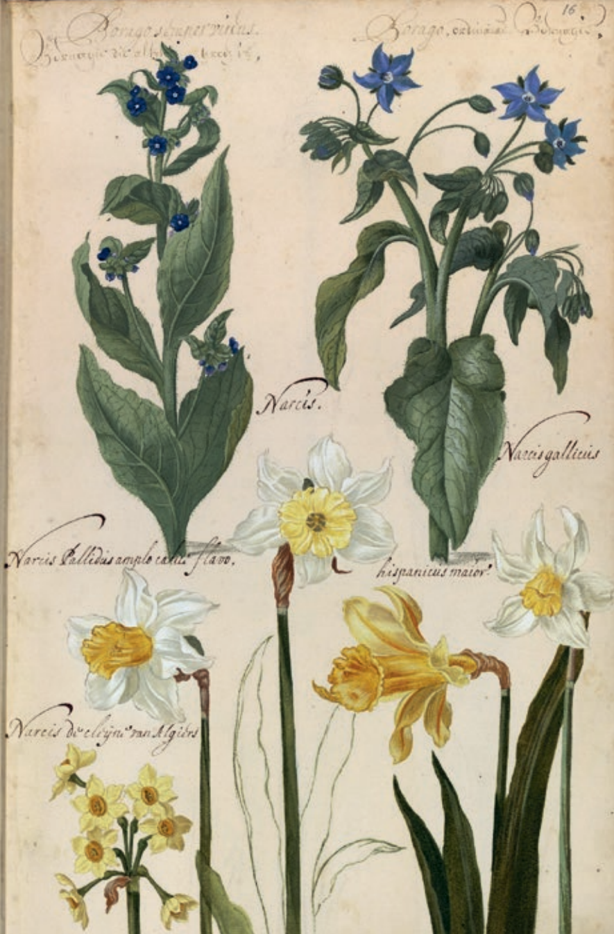
Franciscus de Geest, Borago in de Hortus Amoenissimus , 1668, Biblioteca Nazionale Centrale, Rome