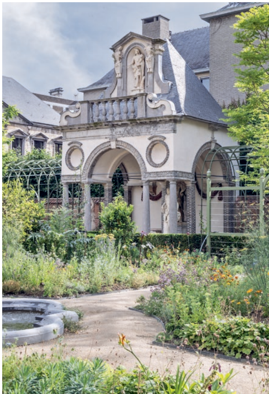
De Rubenstuin in de zomer van 2024