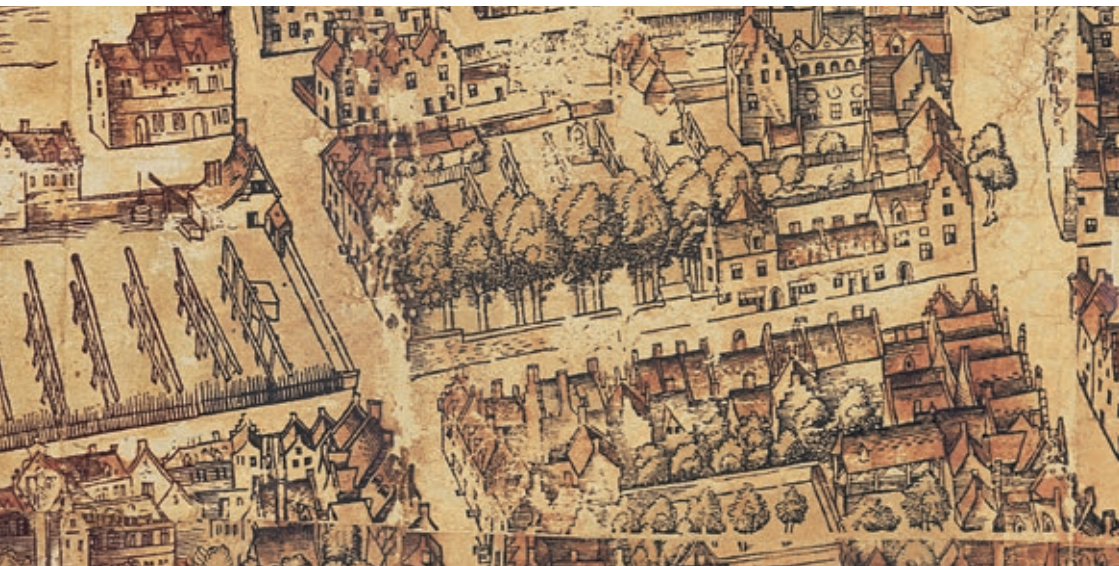
ONDER Detail van de latere Rubenshuissite met de houten ramen op het bleekveld en het Kolveniershof met de dubbele rij lindebomen, uit: Virgilius Bononiensis (tekenaar) en Gillis Coppens van Diest (drukker), Plan van Antwerpen , 1565, Museum Plantin-Moretus, Antwerpen