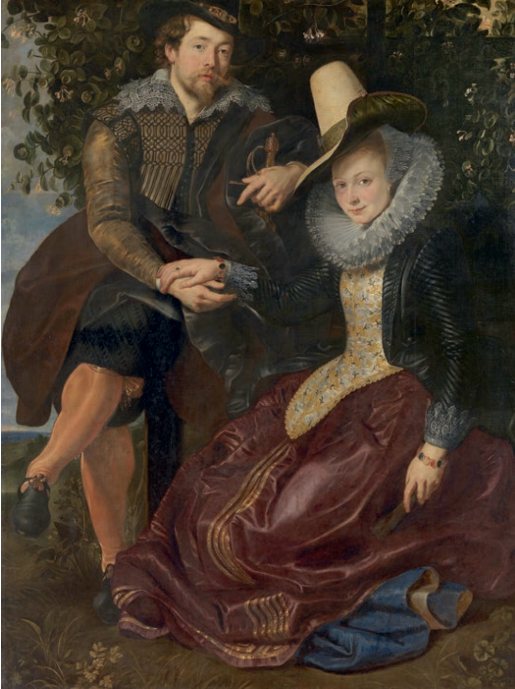
Peter Paul Rubens, Zelfportret met Isabella Brant , c. 1609, Bayerische Staatsgemäldesammlungen – Alte Pinakothek, München