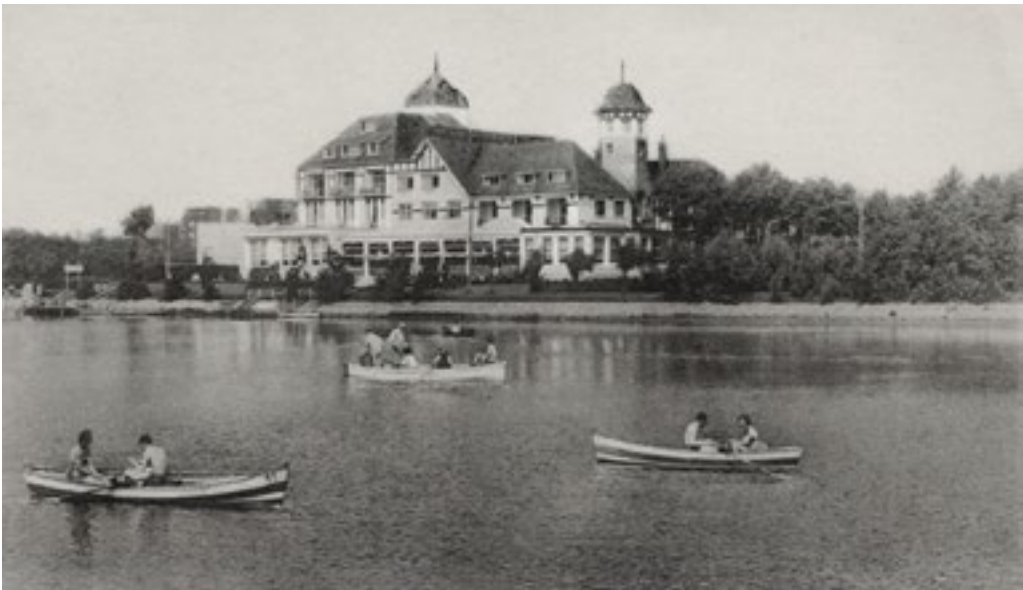
Watersporten in het net aangelegde Zegemeer (jaren 30), met de voorloper van La Réserve op de achtergrond.

Le Pavillon du Lac, construit dans les années 1920, avait beaucoup souffert de la guerre. Un nouvel hôtel fut donc construit à la fin des années 1940, cette fois dans le style cottage familial. Dès son inauguration en 1949, La Réserve devient le point de chute de toutes les célébrités qui se produisent au casino. Au restaurant du même nom, on y croisait régulièrement des visages de renommée internationale. Dans les années 1970, on ajoute au bâtiment une aile complète abritant un centre de thalassothérapie. Ses cinq étoiles étaient donc bien méritées. Mais au début du XXI e siècle, le lustre de La Réserve avait nettement terni, et il avait fallu choisir entre rénover l'hôtel en profondeur ou le démolir et reconstruire du neuf. C'est finalement la première option qui sera retenue et, à l'été 2021, La Réserve rafraîchie accueillait ses premiers hôtes.