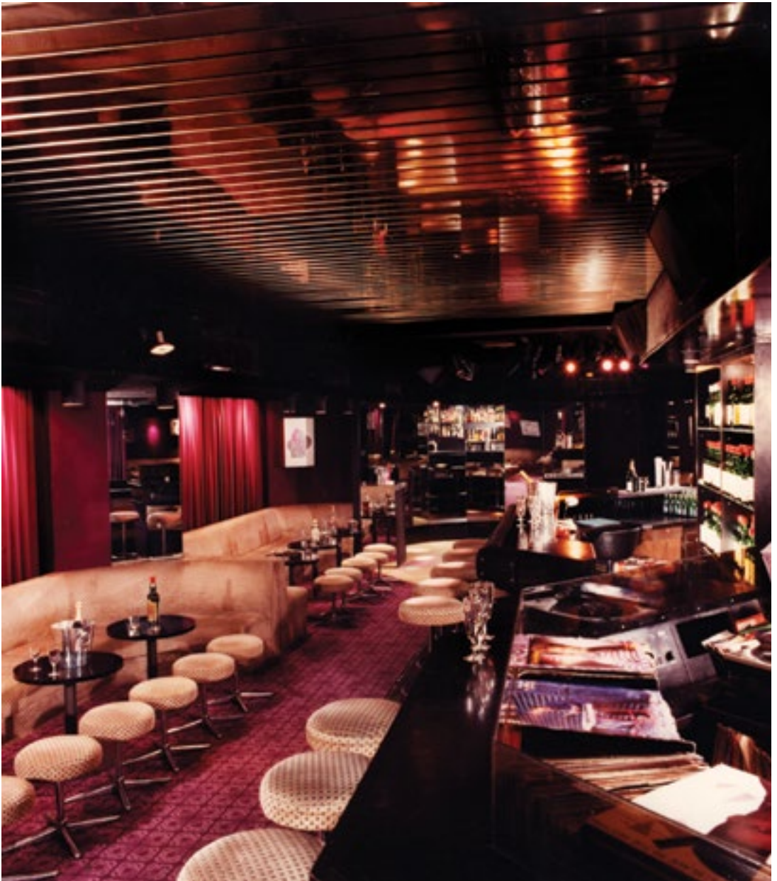
Het interieur van het casino.