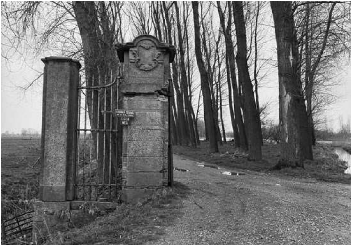
* Afbeelding: Hekpijler ingang Hof van Souburg.

Jacoba volgde haar vader op zestienjarige leeftijd op, maar haar oom, de Luikse bisschop Jan VI van Beieren, had ook zijn oog laten vallen op de erfenis van graaf Willem VI. Hij werd hierin gesteund door de Duitse keizer Sigismund die verdere invloed van de Bourgondische hertogen in zijn gebieden wilde voorkomen. Jacoba, gesteund door haar moeder Margaretha van Bourgondië zocht haar steun bij Jan zonder Vrees, de hertog van Bourgondië en broer van Margaretha. De strijd tussen Jacoba en Jan betekende tevens een oplaaiing van de Hoekse en Kabeljauwse twisten. Onder Jacoba's leiding behielden de edellieden die onder Willem VI gediend hadden hun positie, zij behoorden tot het Hoekse kamp. Daarentegen werd Jan VI van Beieren door de Kabeljauwse edelen gesteund.