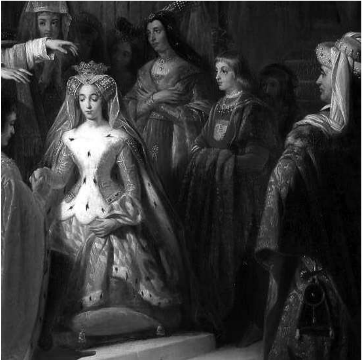
* Afbeelding: Fragment van schilderij 'Het huwelijk van Jacoba van Beieren met Jan IV, hertog van Brabant' van Jacob Joseph Eeckhout, te zien in het Rijksmuseum in Amsterdam.

hertog van Bourgondië. Het escaleerde in een persoonlijke ruzie tussen Filips de Goede die een duel wilde uitvechten met Humphrey. De koningen van Engeland en Frankrijk vonden dat beide Royals zich niet in zo'n duel moesten begeven, Filips bleef echter strijdvaardig, maar Gloucester besloot eind april er toch vanaf te zien. Jacoba bleef achter in Henegouwen. Vervolgens begon de Inname van Henegouwen (1424-25) en moest zij zich overgeven en werd in Gent gevangen gezet. Gloucester steunde zijn vrouw nog wel met Engelse troepen in de Slag bij Brouwershaven in 1426, maar het huwelijk werd al snel daarna ontbonden.