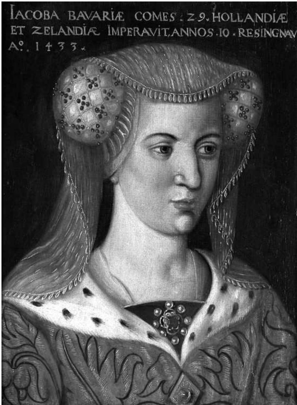
* Afbeelding: Portret van Jacoba van Beieren. Bron: Jacoba van Beieren door Hollandse school ca 1600.

In 1417 overleed echter ook Jan van Touraine en werd Jacoba weduwe. Enkele maanden later overleed ook haar vader graaf Willem VI van Holland.