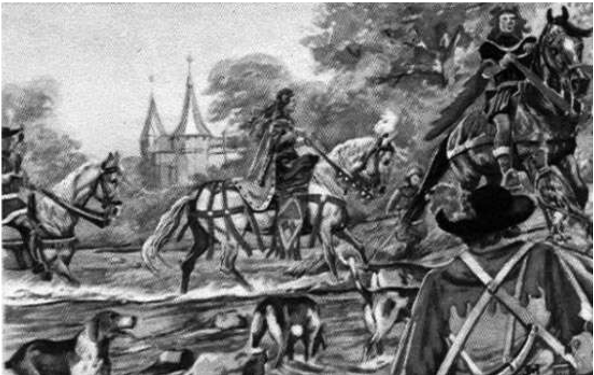
* Afbeelding: Jacoba van Beieren op Valkenjacht. Rechts te paard haar vierde echtgenoot Frank van Borselen. (Artiest onbekend)